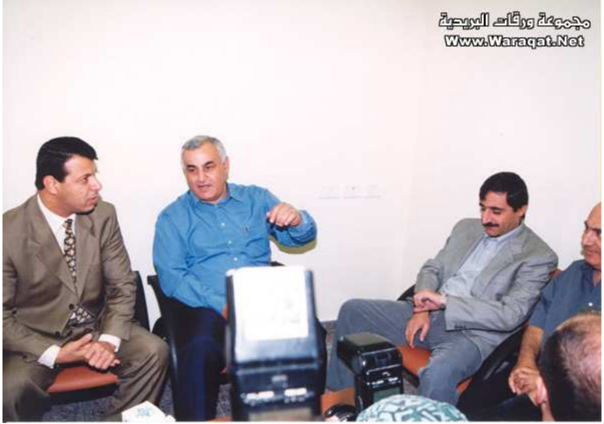
من اليمين رشيد أبو شباك رئيس جهاز الأمن الوقائي في الوسط ياد مردخاي وزير الأمن الصهيوني الإسرائيلي و بجانبه دحلان