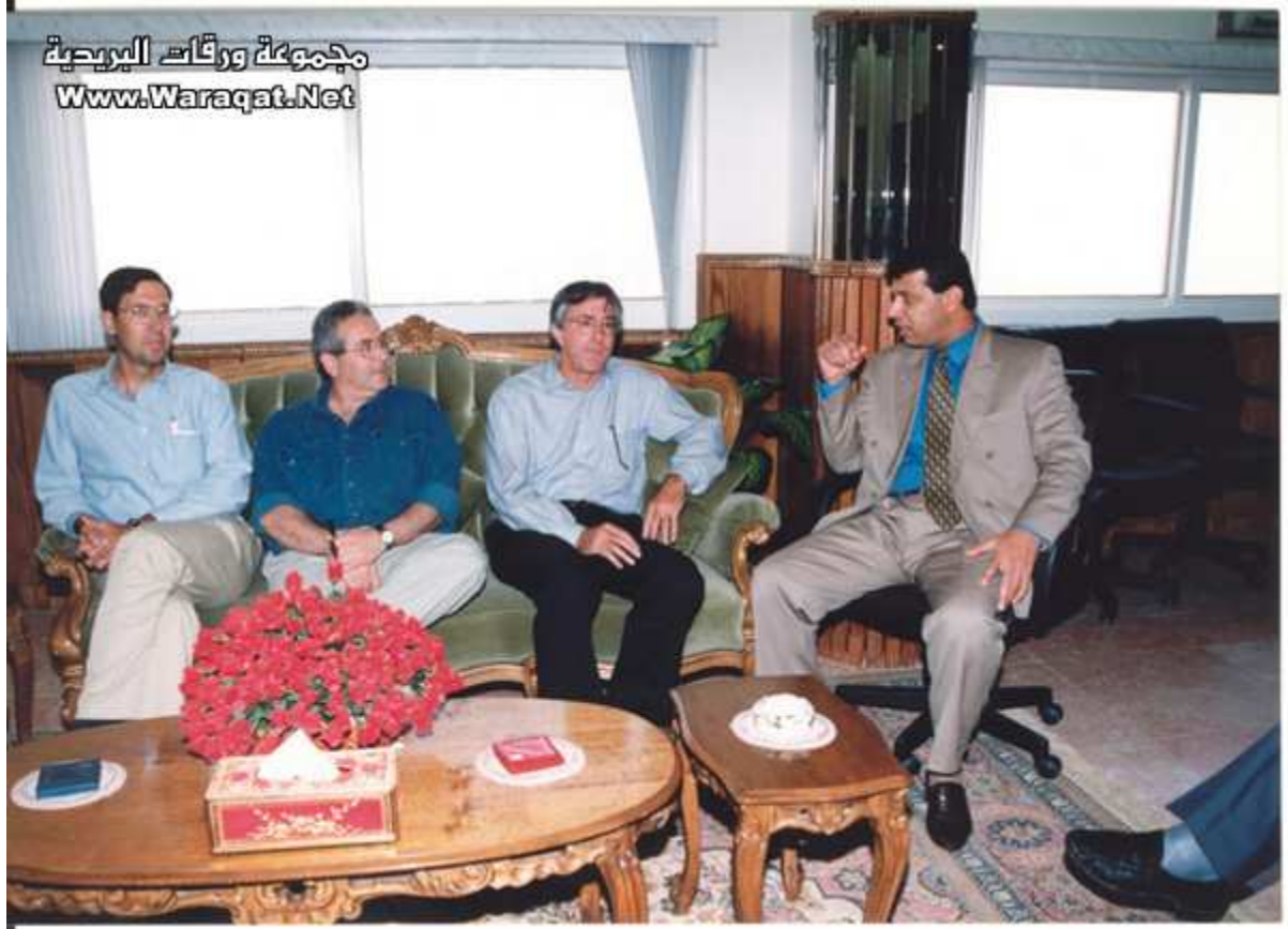
جلسة عمل أخرى لكن مع المنسق الأمني الأمريكي اليهودي دينس روس..