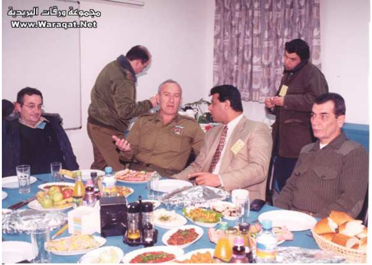
مع الزملاء في الجيش الإسرائيلي..