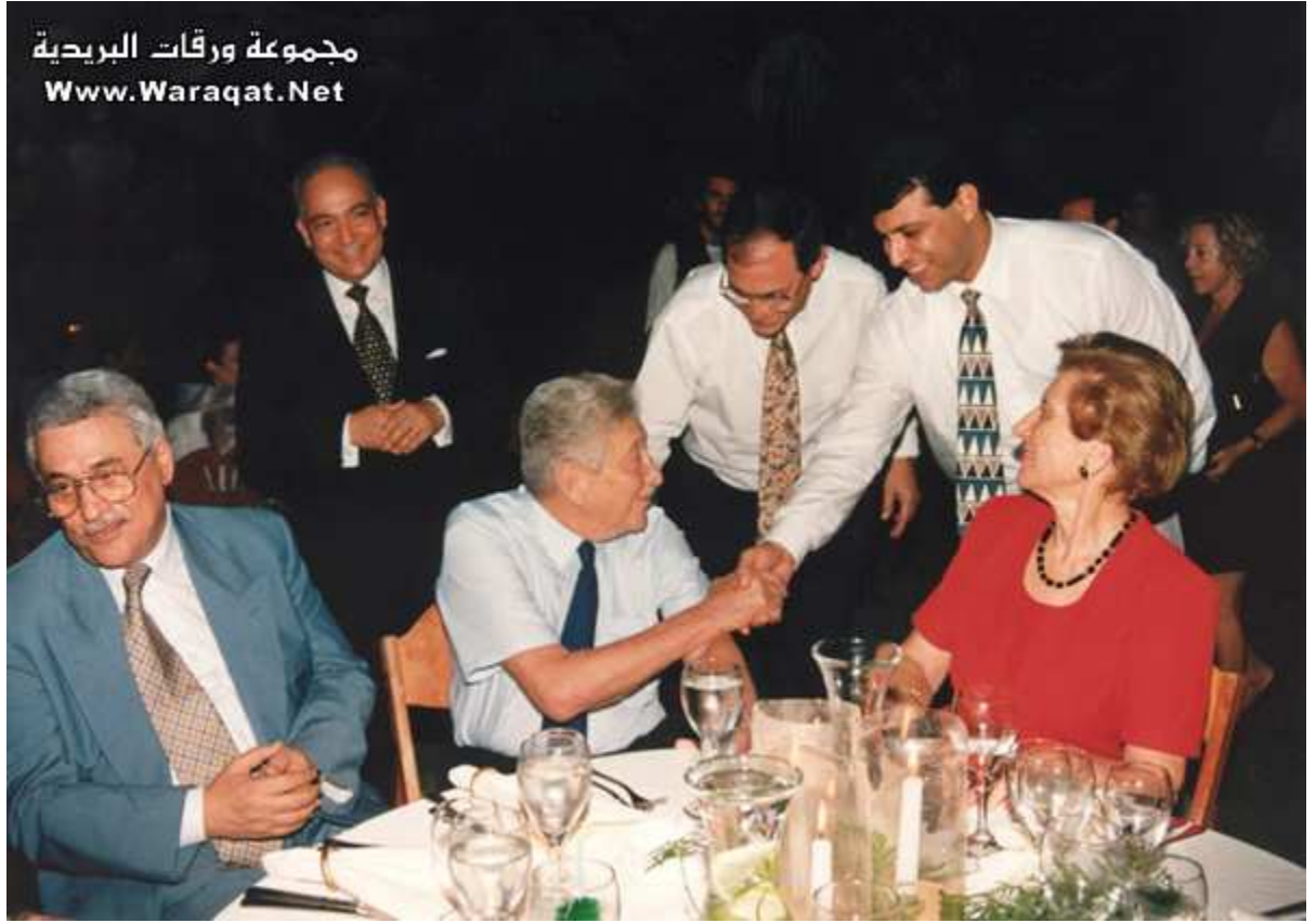
سلام حار لعيزر وايزمن الرئيس الاسرائيلي السابق .. وعلى الطاولة من الجانب الاخر رئيس السلطة محمود عباس