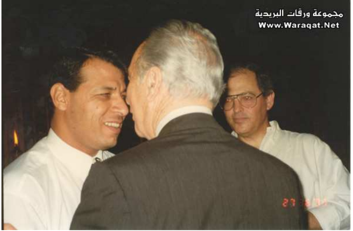
مع رئيس دولة الكيان الاسرائيلي .. حماسة السلام شمعون بيرس...