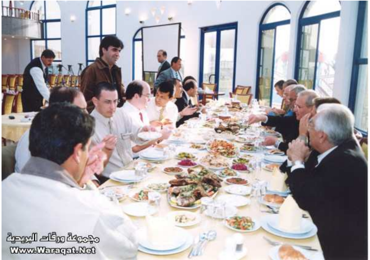
حصار على الشعب الفلسطيني .. وسفرة وبوفيه مفتوح..