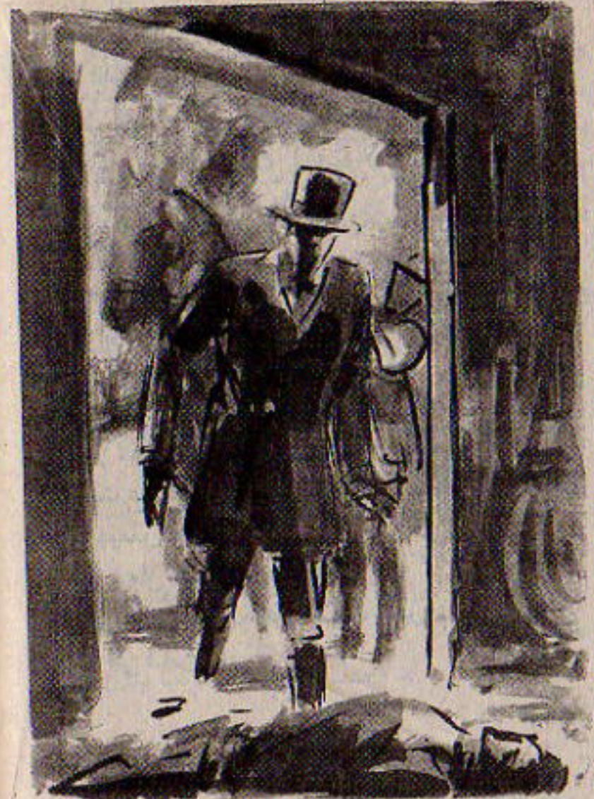
وفى ركن المكان كان هناك رجل راقد يرتدى قميصاً خشناً وسروالاً أزرق ..

تشبه (سييل فين) .. هل تذكر (سييل) ؟ حسن ..