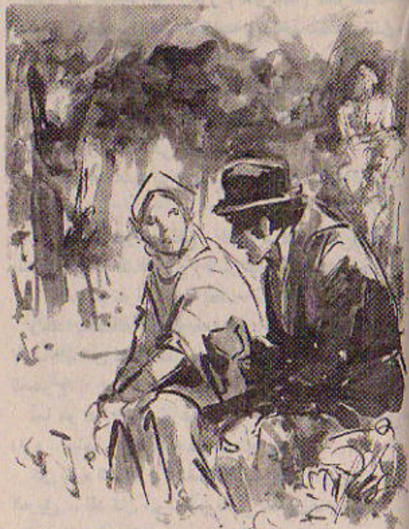
وبكياسة راح يحذرهما من هذا الشاب المتألق الذي يحوم حولها ..

- « إن رؤيته تعنى أن تهيم حباً به .. وإن معرفته تعنى أن تثق به .. إنك تتركني يا ( جيم ) وأنا في أسعد وأعز أيام عمري .. لقد كانت الحياة قاسية علينا لكنها ستختلف .. أنت ذاهب إلى عالم جديد كالذي وجدته أنا فعلاً .. »