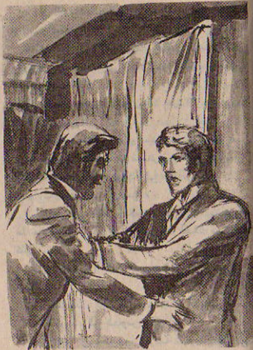
- واتجه في عصبية تجاه اللوحة .. لكن ( دوريان ) - وثب ليقف بين الرسام والستار ..

لم يستطع الرسام أن يوجه مزيداً من اللوم للفتى .. لربما كانت لامبالته هي نتيجة للصدمة .. فما زال في الفتى كثير من الطيبة والنبيل ..