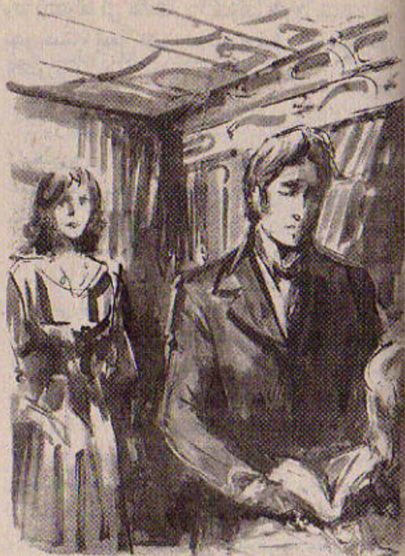
كان هذا صوت امرأة .. وسرعان ما رأى من تدخل المكتبة

كان (دوربان) جالساً في حجرة المكتب في دار لورد (هنرى) ، يتأمل الغرفة الجميلة بسقفها المصنوع من خشب البلوط وزخارفها ، وسجاجيدها الفارسية السمكية .. وكانت هناك منضدة صغيرة عليها تمثال صغير لـ (إقليدس) .. وجواره رواية فرنسية مجلدة بعناية .. وعلى رف المدفأة كتات أنية خزفية جميلة ..