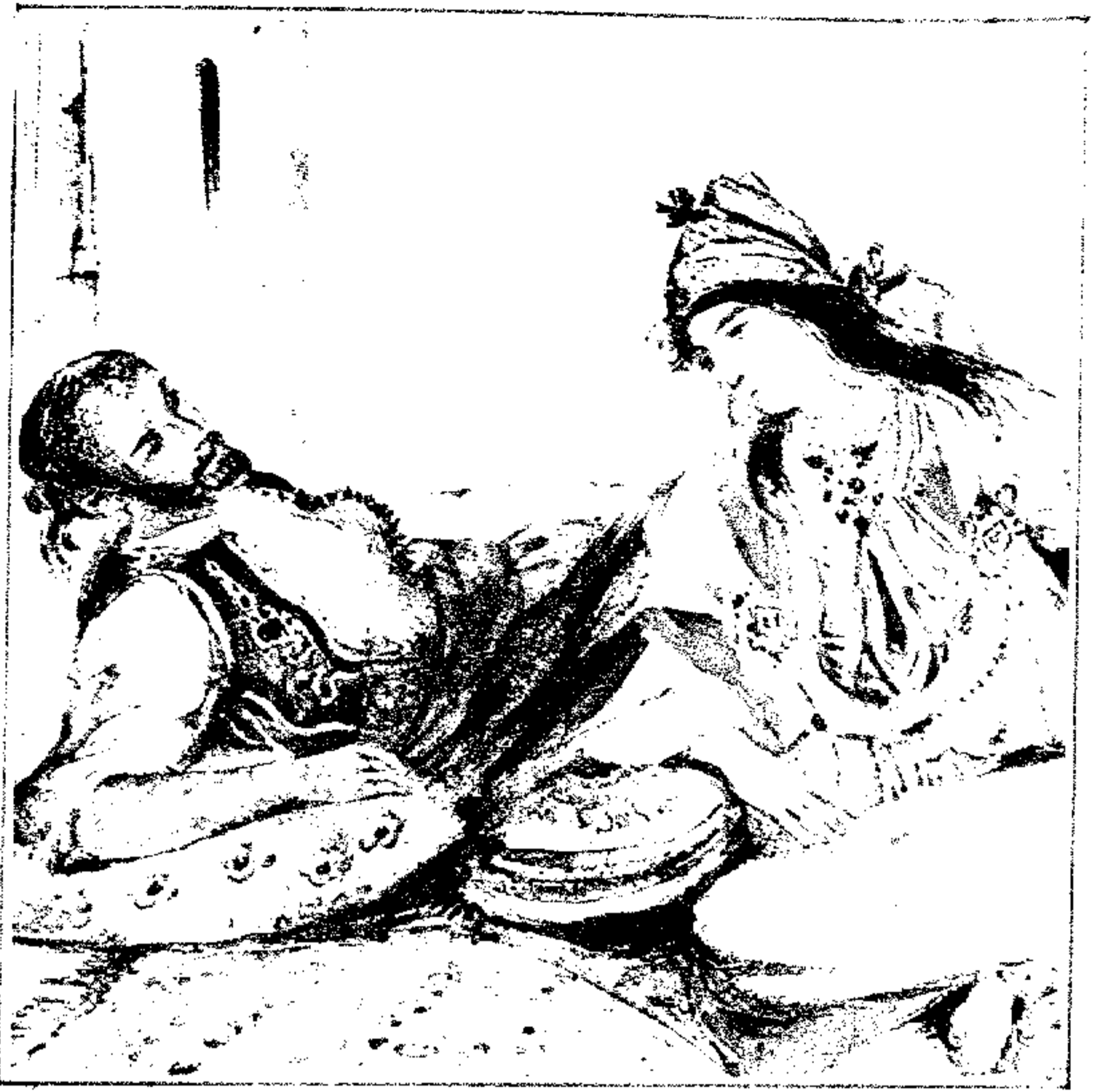
● رسم : اوجین دیلاکروا - متحف الفنون بامریکا .