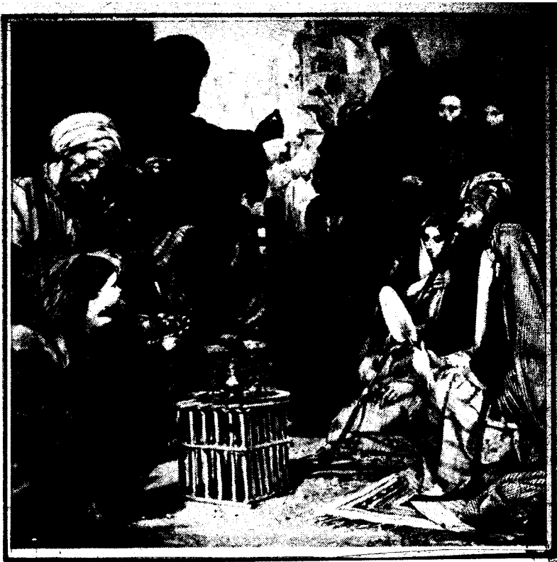
● رسم : جون فريدرش .

كل إنسان يقول ما يحلو له ، أي شخص يدخل فيما لا يعنيه .