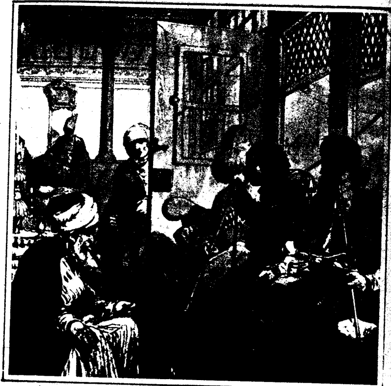
● رسم : اميديو بريوسي

لكن ماذا سنأتي به الايام؟ بل ماذا يخيبء اليوم نفسه؟