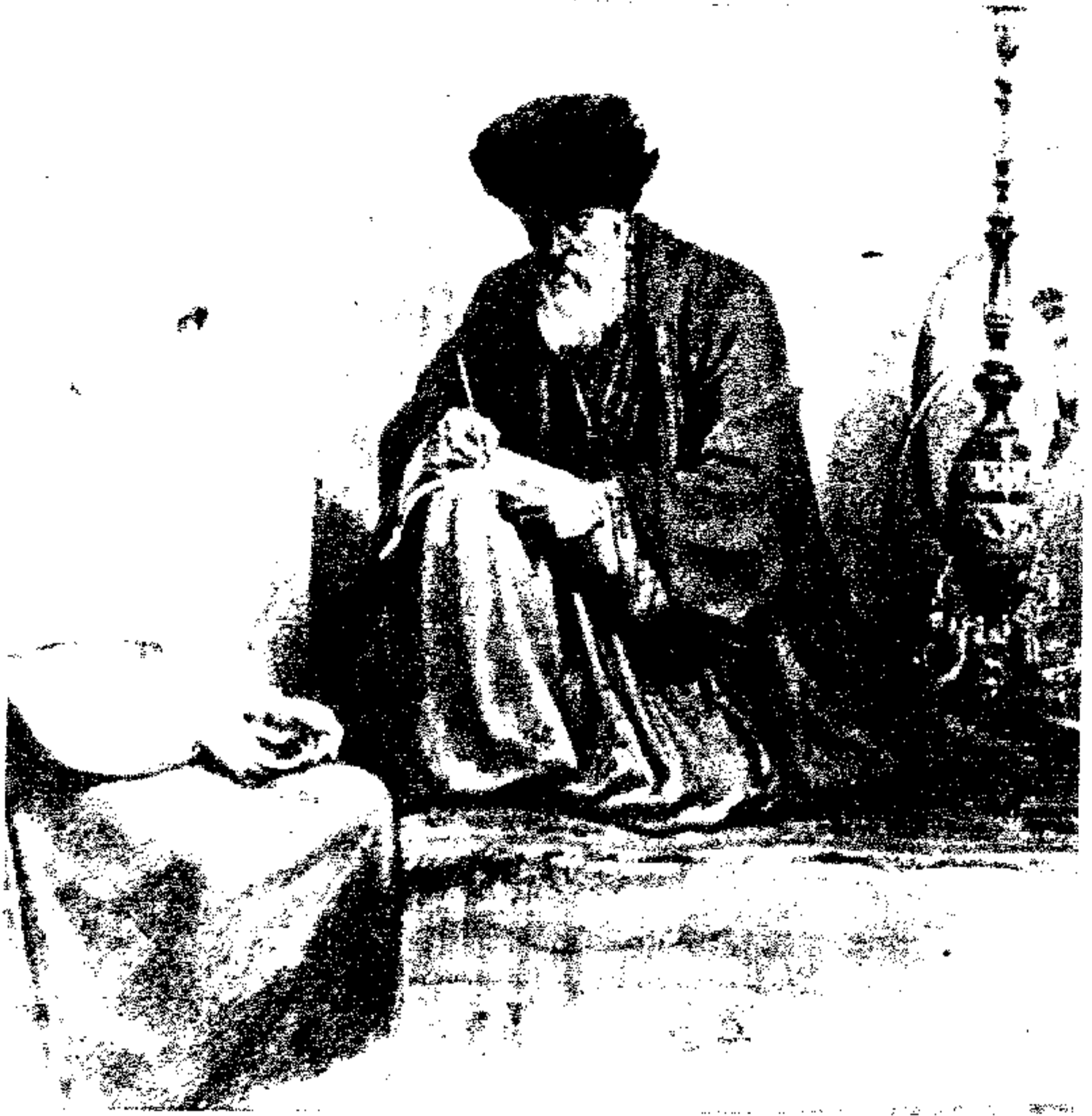
● رسم : دافيد روبرتس .

لا يدري انسان ، أن ثمة خيطا يشد ويربط كل أرباب المغاني والمنشدين إلى كبير البصاصين .