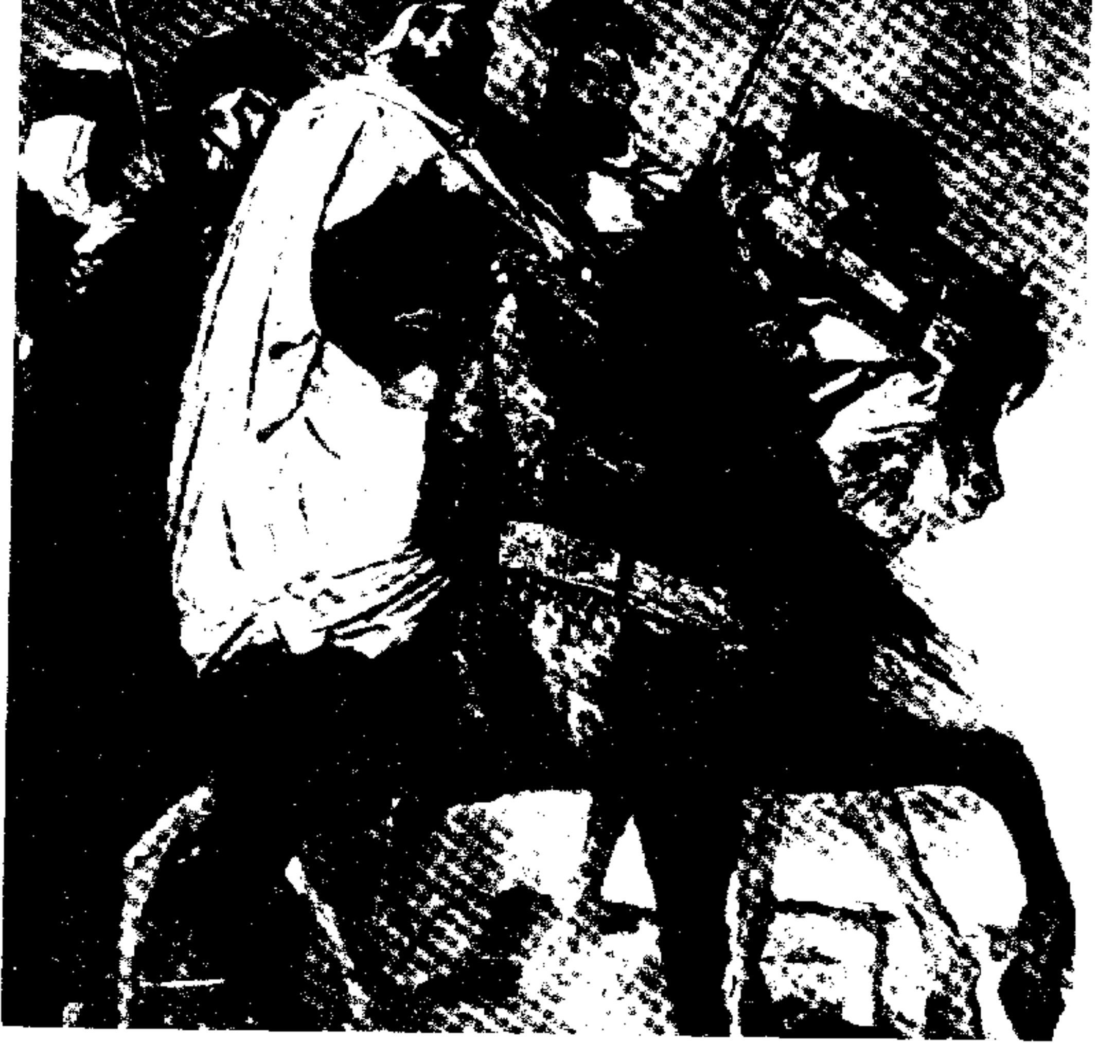
● رسم : جادور كَسْبِرُو

وتوافد كبار البصاصين من أركان المعمورة إلى القاهرة . قلب العالم وبستان الكون .