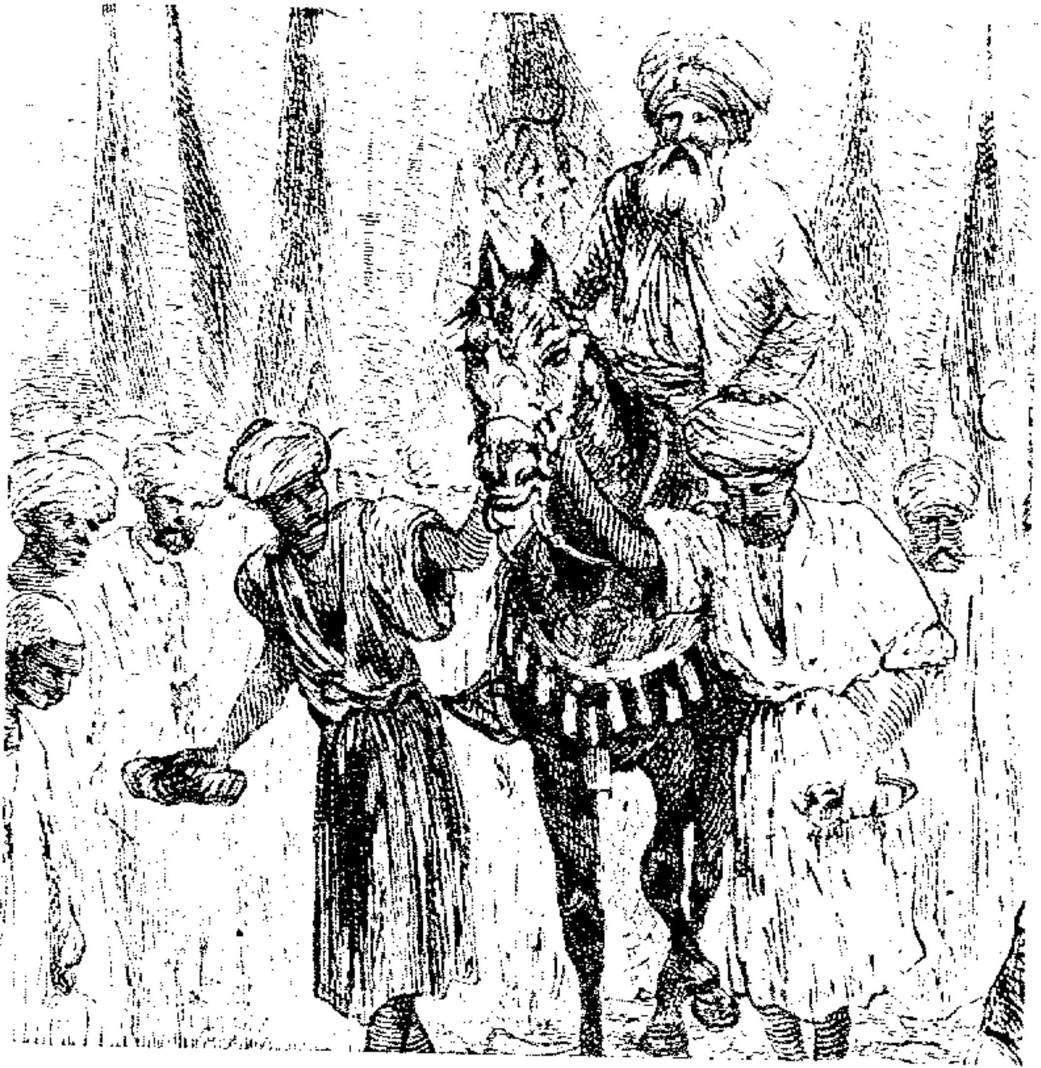
● رسم : إدوارد لين .

الشيخ أبو السعود الجارحي ، يمشي عبر الأفئدة ، فوق القلوب .