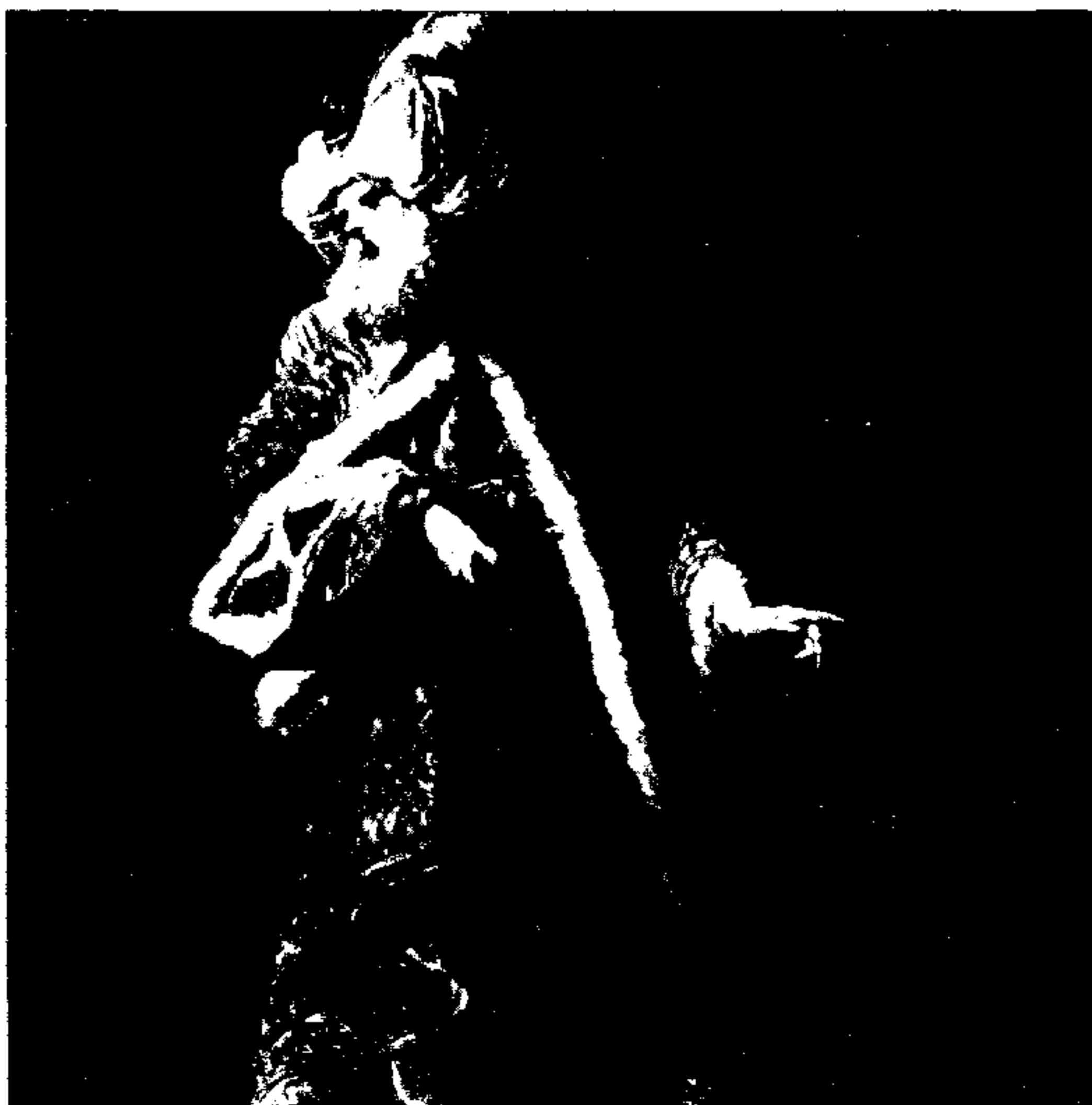
● رسم : جين باربولت - متحف اللوفر - باريس .