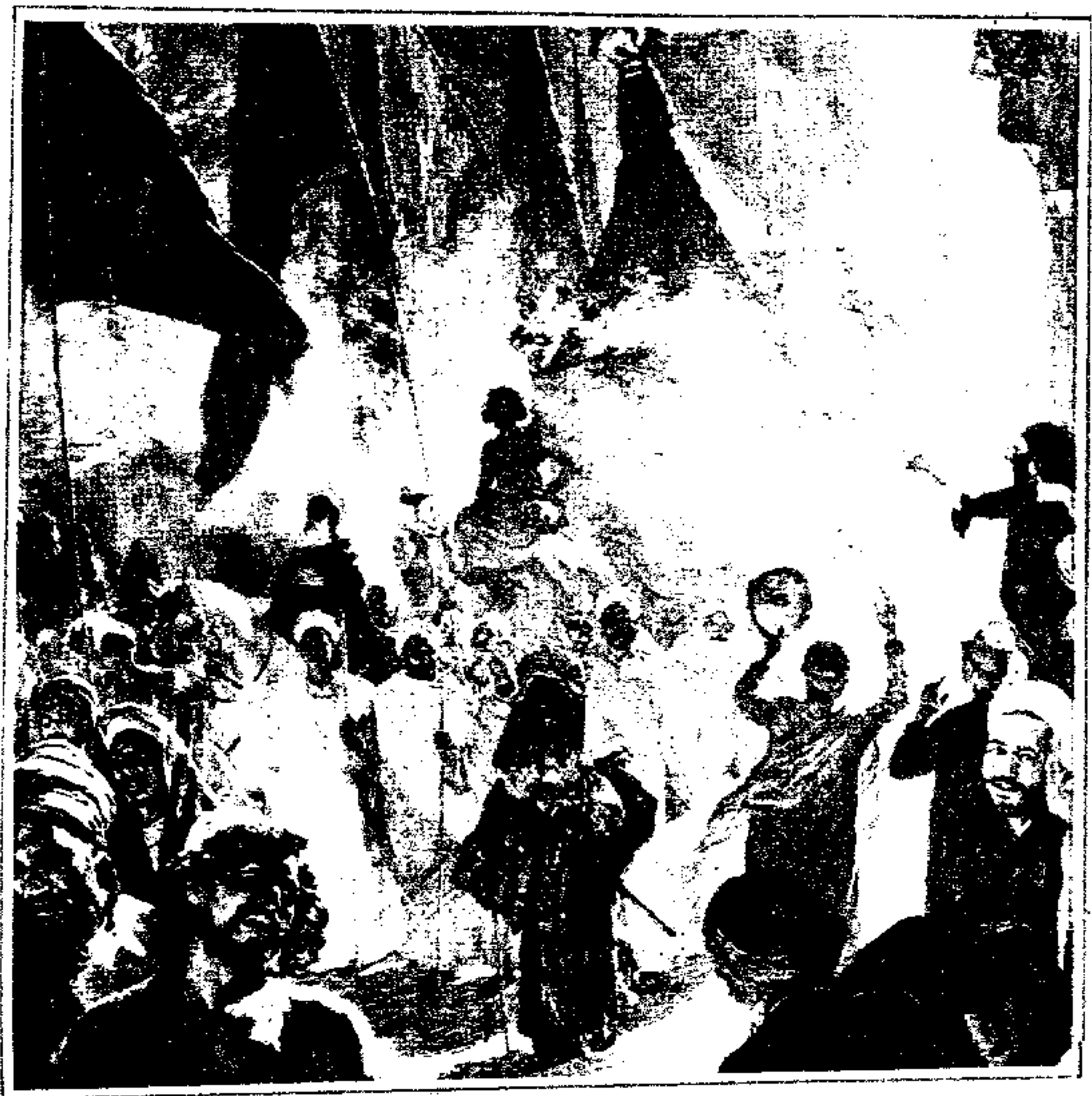
● رسم : لودج دويتش