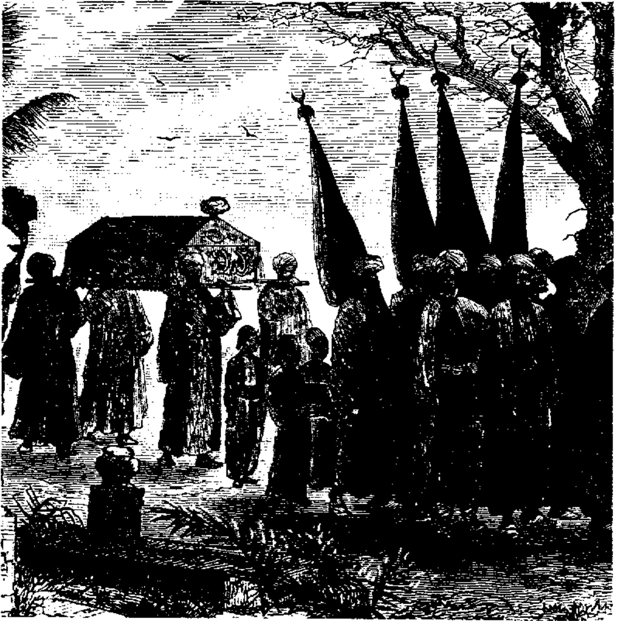
● رسم : ادوارد لين

الخراب الخفى ساع فى الفراغ . وما كان أصبح فى حكم العدم .