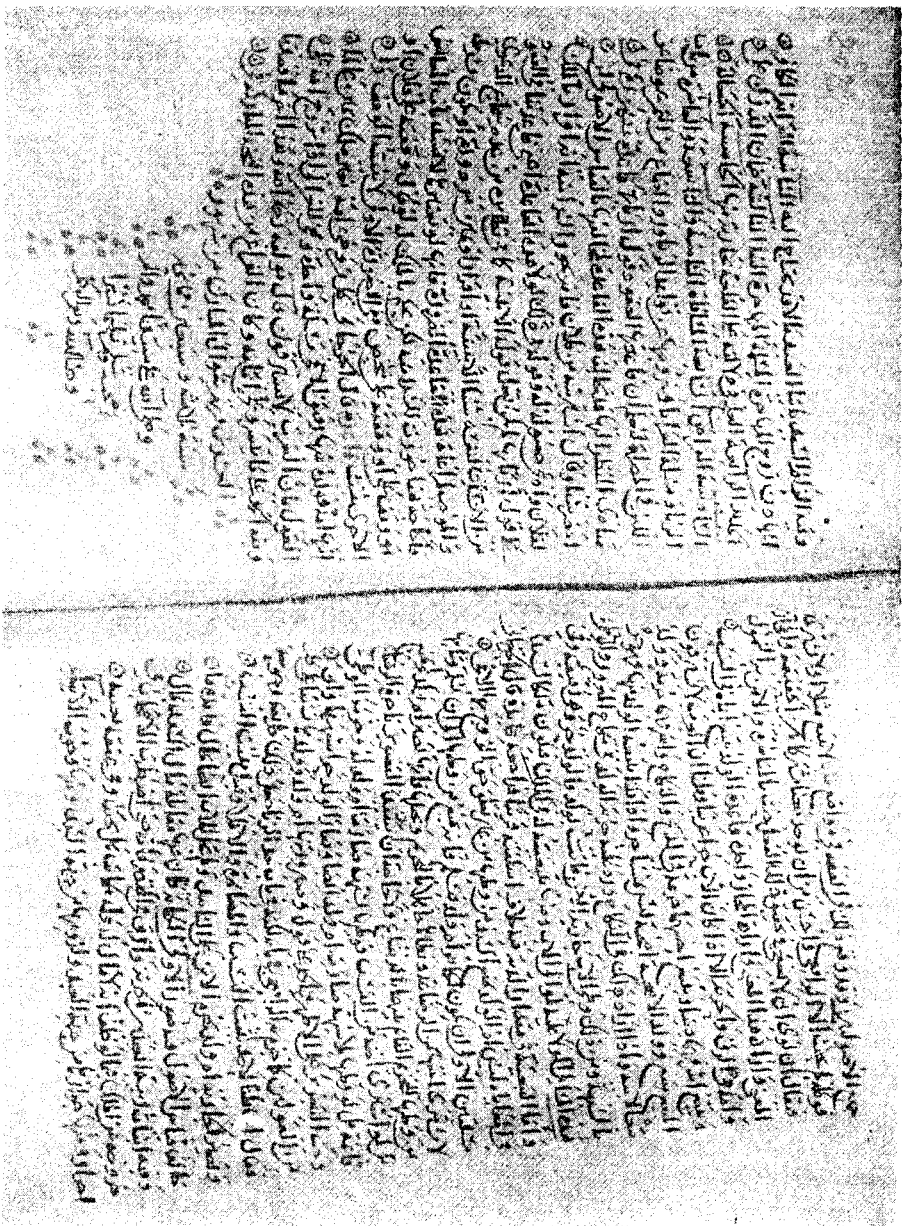
الورقة الأخيرة من النسخة (ق)