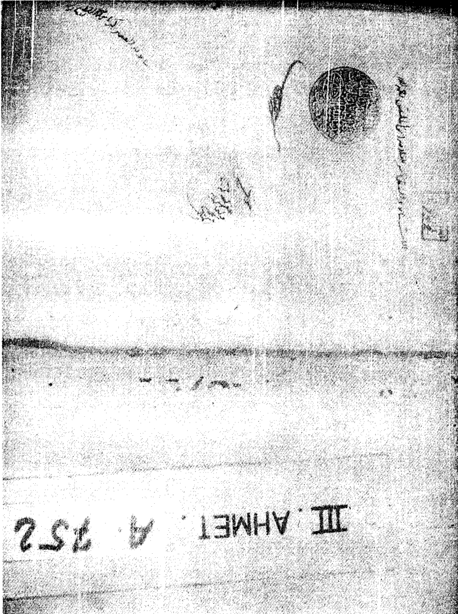
لوحة الغلاف من النسخة (ق)