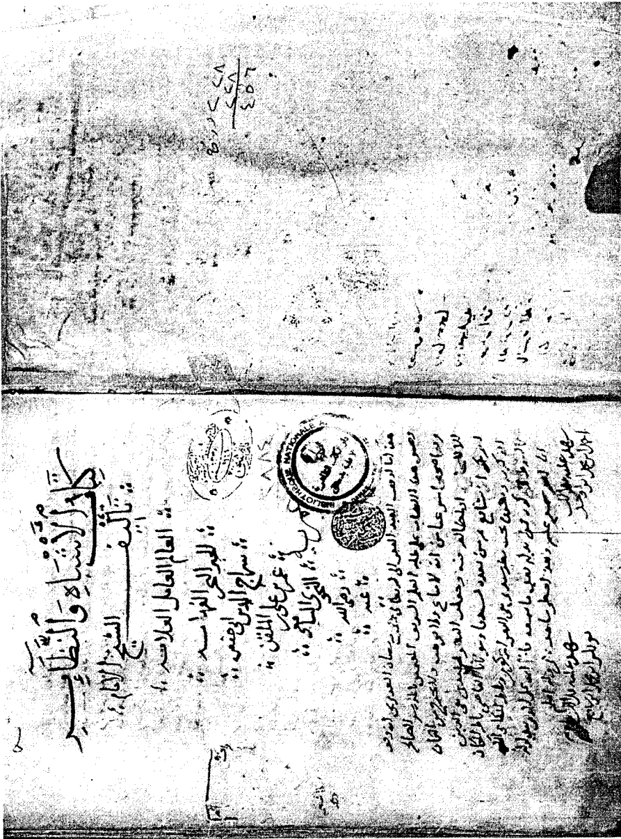
لوحة الغلاف من النسخة ( ن )