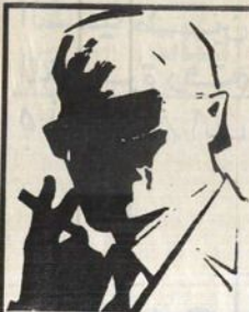
رقم ١٣ - صفر، الزعيم الغامض الذي لا يعرف حقيقته احد ..