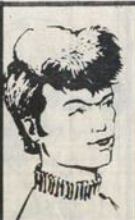
رقم ٦ - مصباح من ليبيا