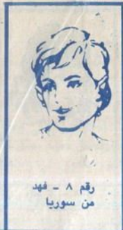
رقم ٨ - شهد من سوريا