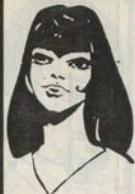
رقم ٣ - الهام من لبنان