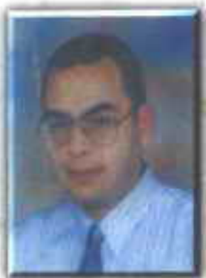
د. احمد خالد توفيق