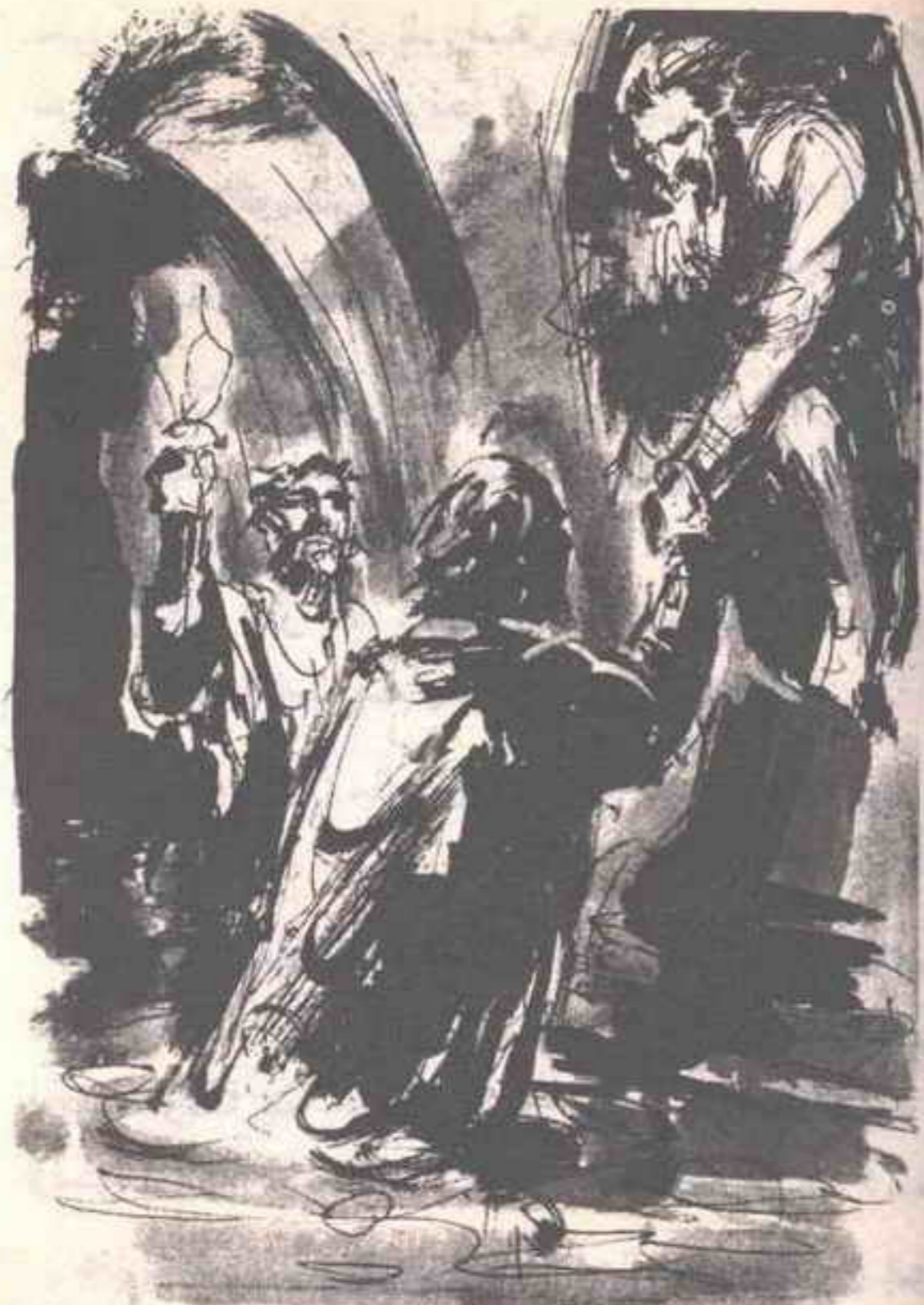
في نهاية المر الكريه كانت هناك كوة عالية عن مستوى السائل ، فتسلقها أحدهم ، ووقف هناك ومد يده يعينني على الصعود ..

في نهاية المر الكريه كانت هناك كوة عالية عن مستوى السائل ، فتسلقها أحدهم ، ووقف هناك ومد يده يعينني على الصعود .. وسرعان ما كنت أدخل الكوة وأزحف على ركبتي .. يا للاشمئزاز !! لو كان بوسعي أن أغمس جسدي كله في حمض النتريك المركز لفعلت الآن ..