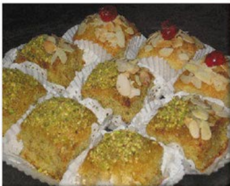
من صنف 'المحليات'