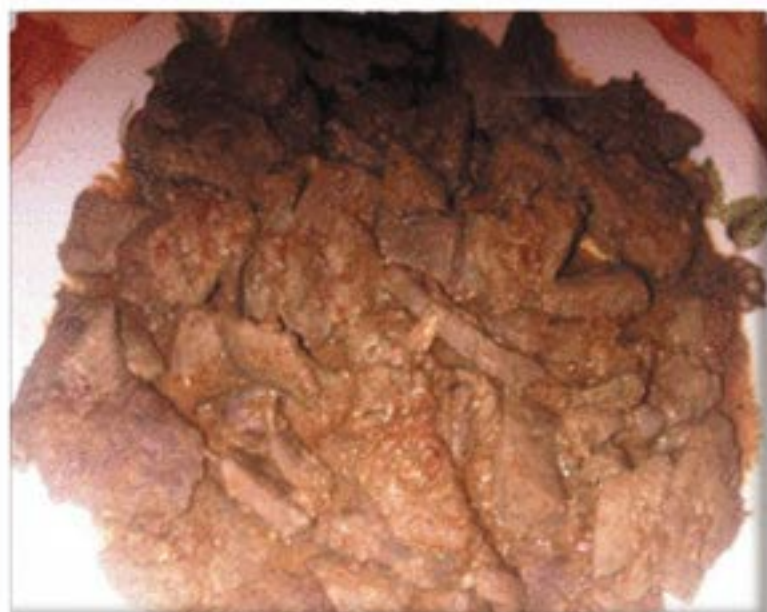
من صنف 'الأطباق الرئيسية'