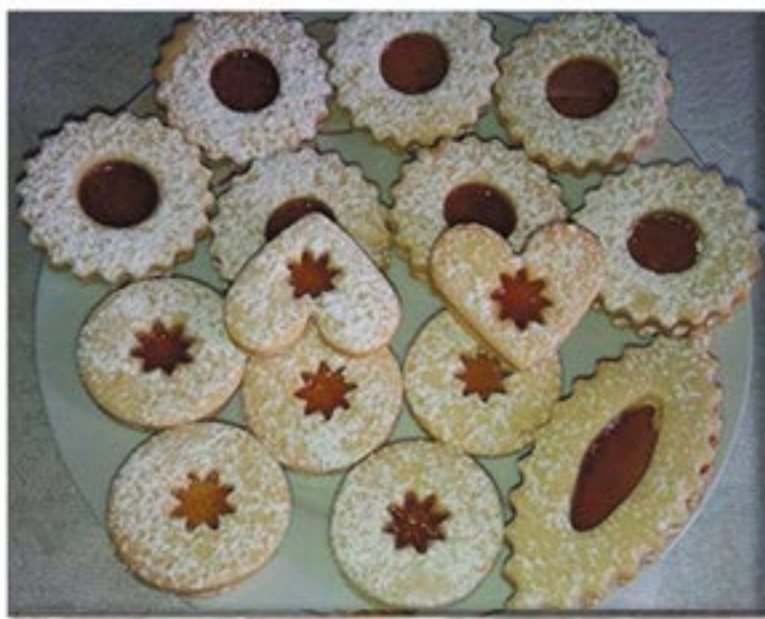
من صنف 'المحليات'