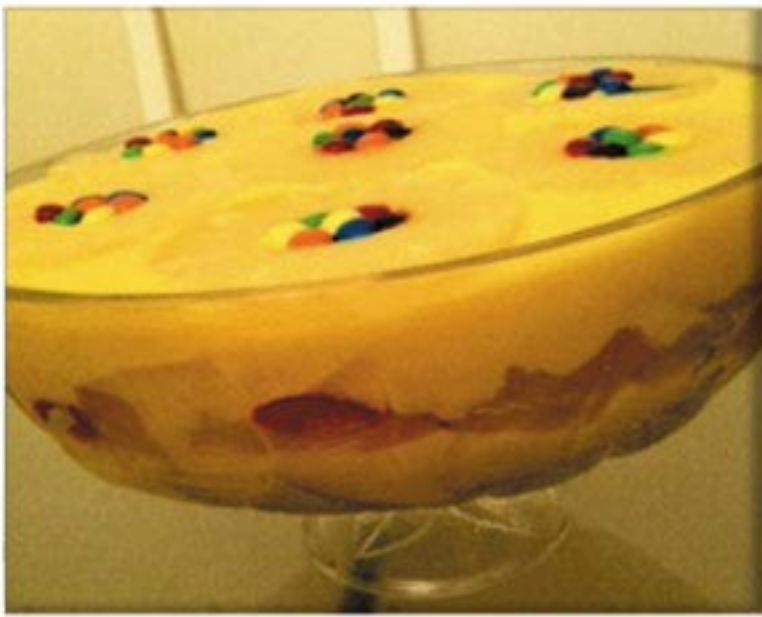
من صنف 'المحليات'