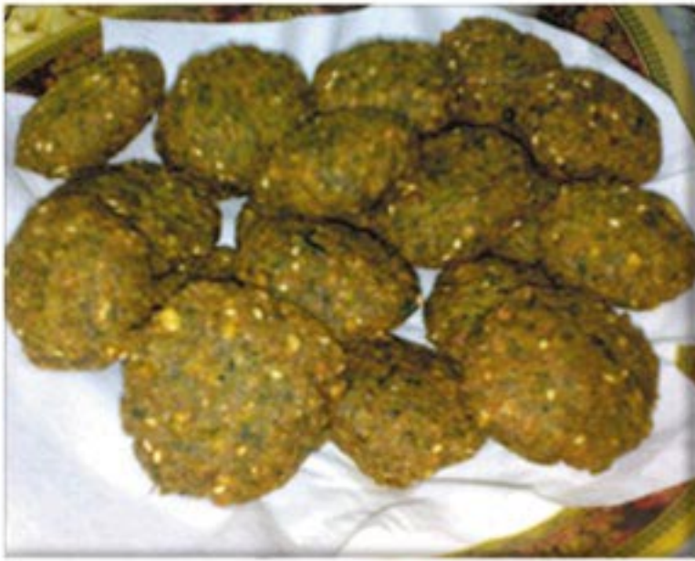
من صنف 'القبلاط'