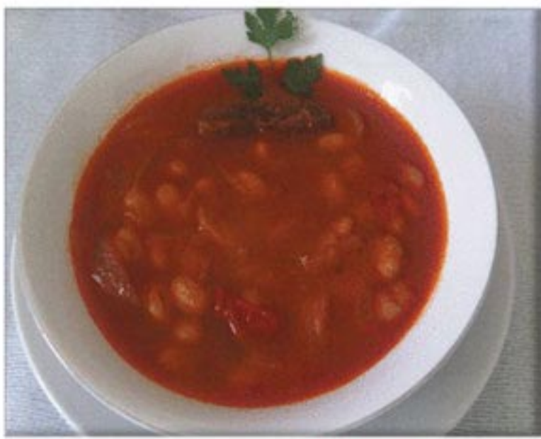
من صنف 'الشوربات'

فاصوليا حمراء لحم 2 حبة بصل 2 حبة طماطم ملح فلفل أسود بهار مشكل بابريكا ملعقة مركز الطماطم زيت