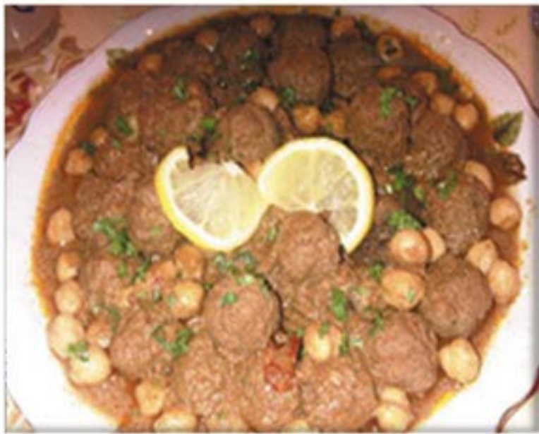
من صنف 'الأطباق الرئيسية'