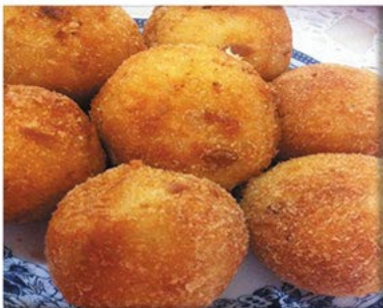
من صنف 'القبيلات'

3 حبة بطاطا ملعقة زبدة جبن طري ملح و فلفل أسود رشة بابريكا لحم مفروم حبة بصل حبة طماطم فص ثوم بهار زيت بيض طحين بقسماط