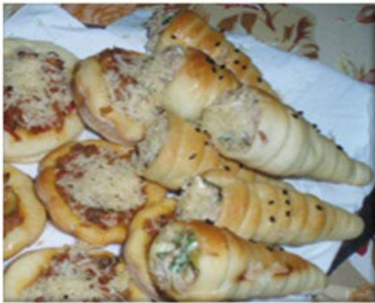
من صنف 'العجنات'

عجينة عشر دقائق تونة مايونيز بصلة صغيرة بققدونس زيتون أخضر جبن طري ملح فلفل أسود كزبرة ناشفة حبة البركة جبن مبروش