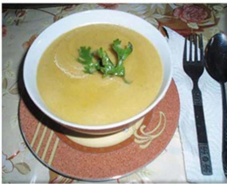
من صنف 'الشوربات'

قطع لحم حبة بطاطا 2 حبة جزر 2 حبة لفت حبة بصل عود كرفس ملح فلفل اسود كزبرة ناشفة كريمة ( اختياري ) ملعقتين زيت