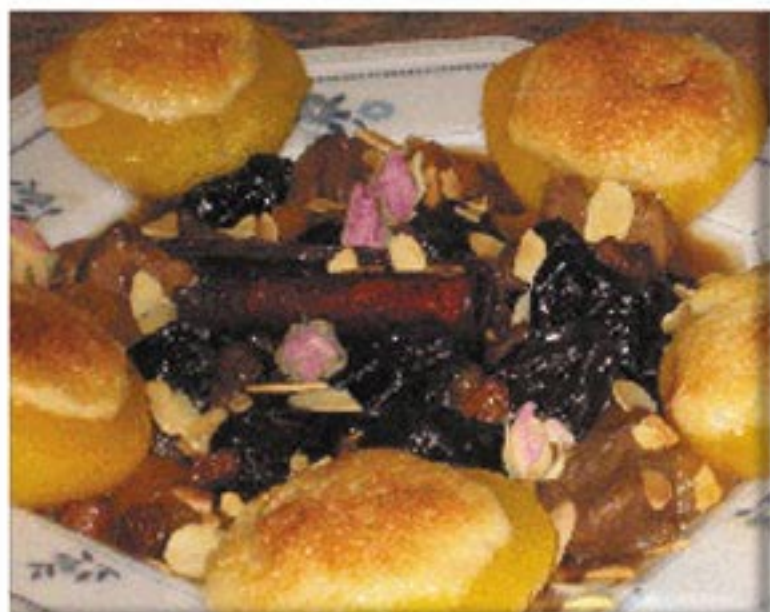
من صنف 'الحلو'