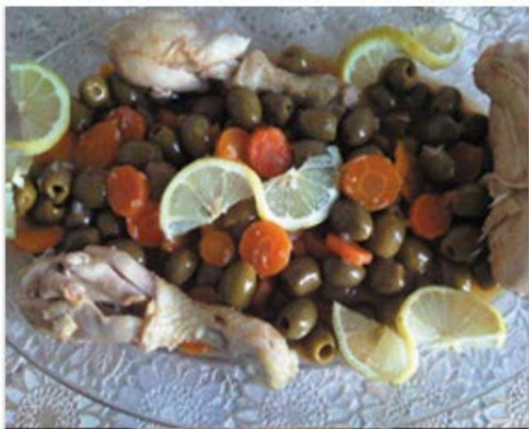
من صنف 'الأطباق الرئيسية'