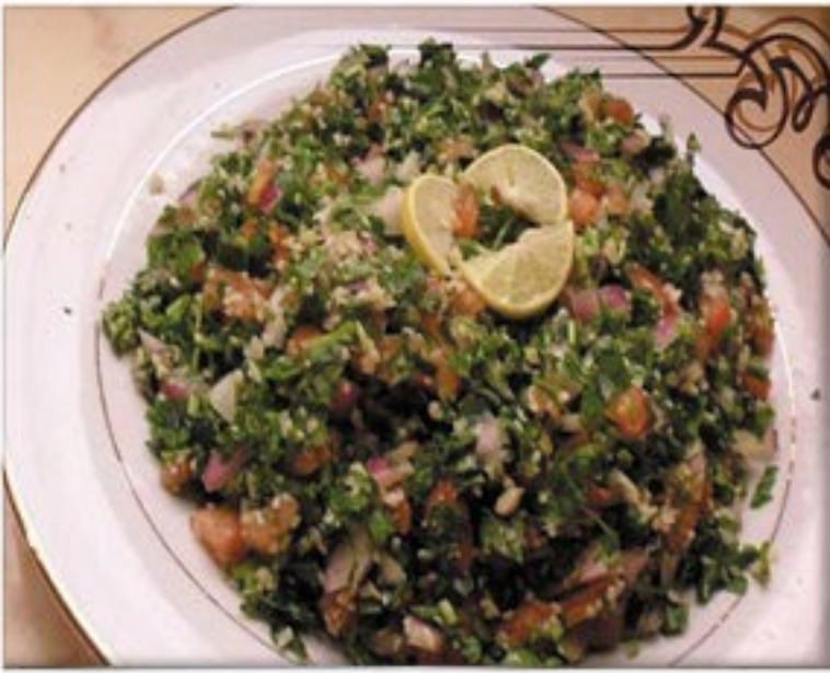
من صنف 'السلطات'