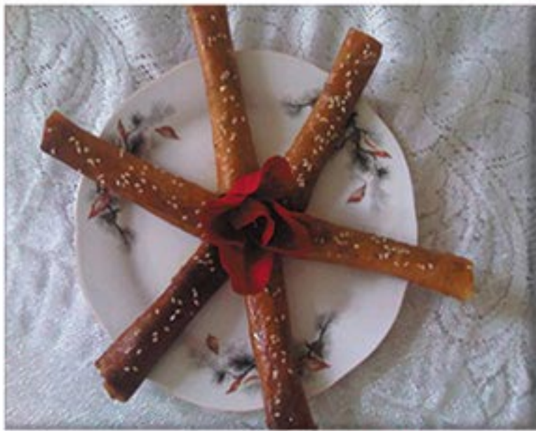
من صنف 'المحليات'