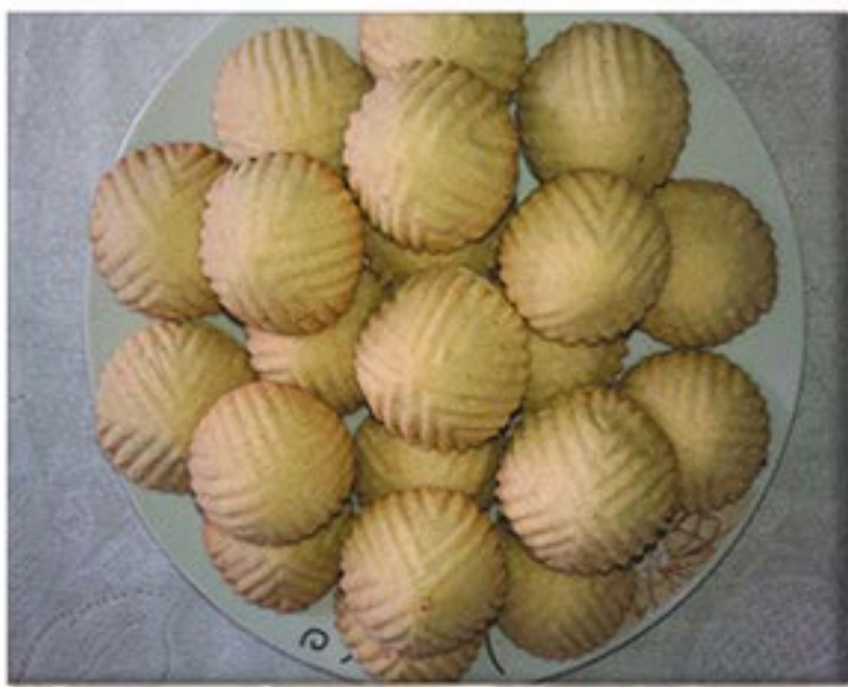
من صنف 'المحليات'

ربع كيلو تمر معجون 2 ملعقة سمس (جلجلان) محمص و مطحون ملعقة كبيرة ماء زهر ملعقة كبيرة زيت