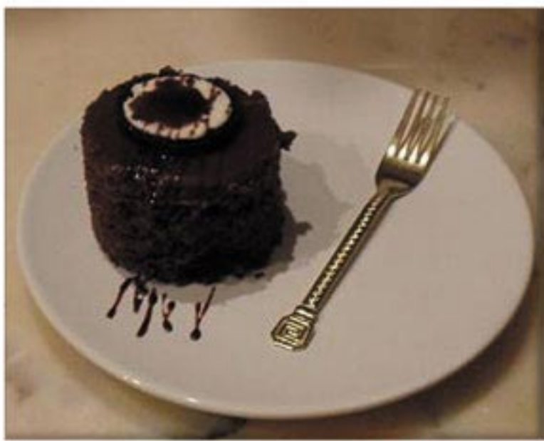
من صنف 'المحليات'

بسكوت اوريو خلطه بيتي كروكر بالشكولاته زبدة 6 جلاكسي 2 قشطة هيرشي بالشوكلاته