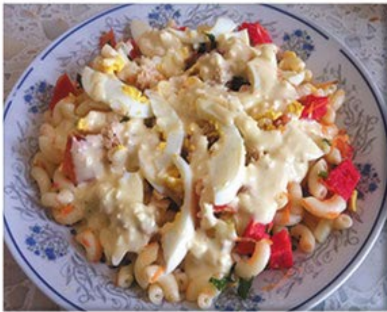
من صنف 'السلطات'