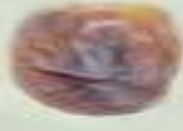
نبتة علي Nabtat Ali