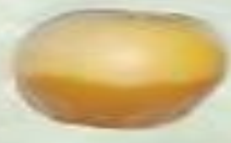
نبتة سلطان Nabtat Sultan