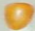
دقلة نور Deglet Noor