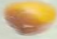
نبتة سيف Nabtat Seif