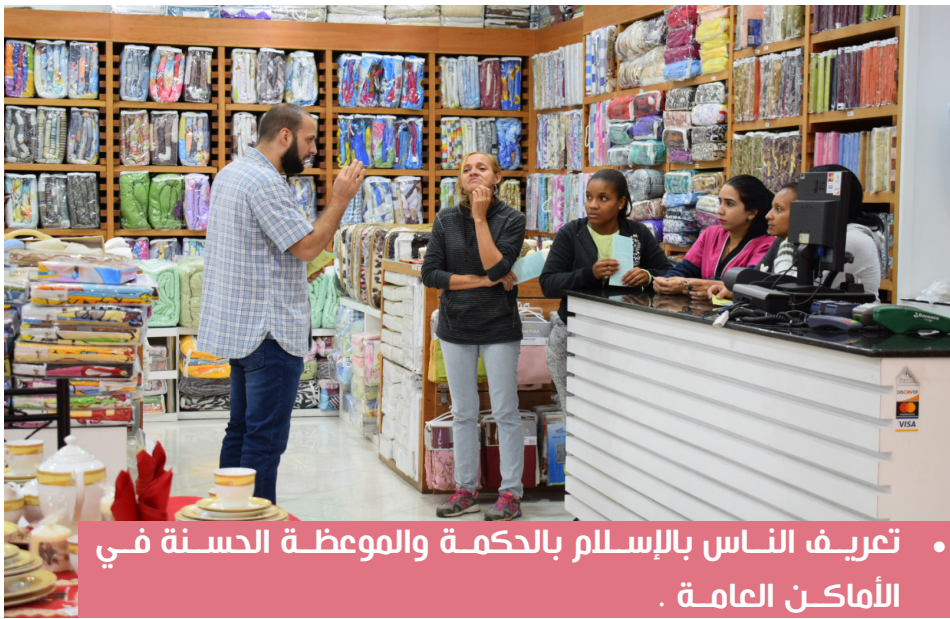
• تعريف الناس بالإسلام بالحكمة والموعظة الحسنة في الأماكن العامة .