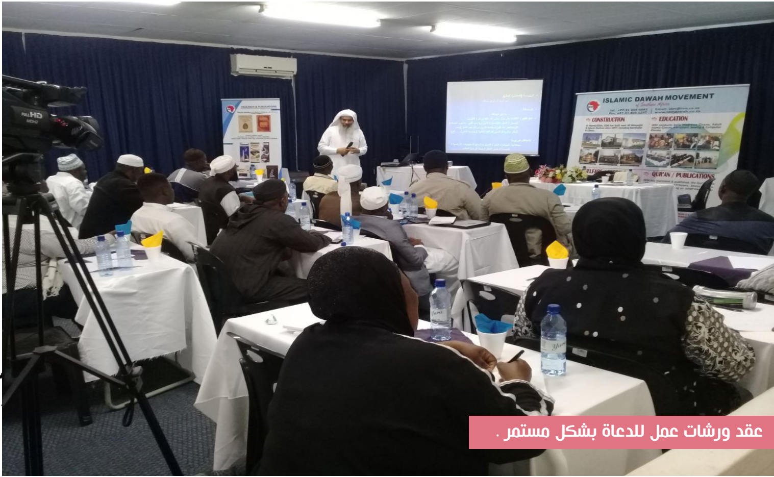
عقد ورشات عمل للدعاة بشكل مستمر .