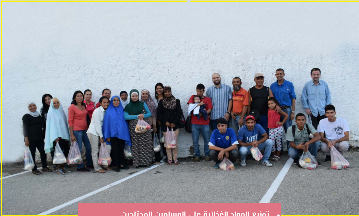
توزيع المواد الغذائية على المسلمين المحتاجين .