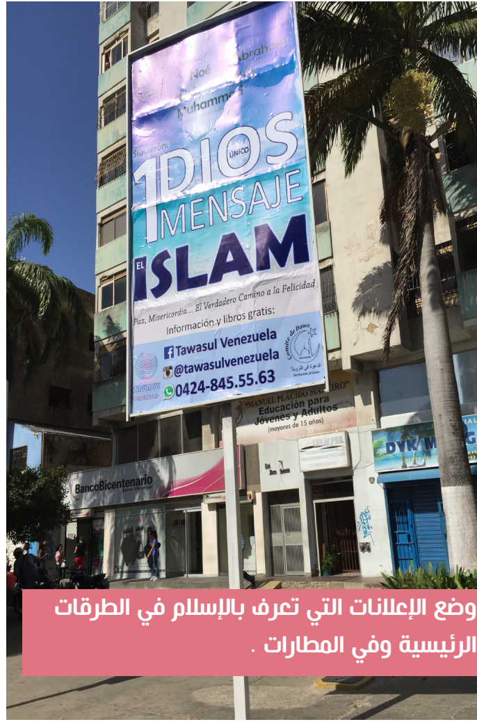
وضع الإعلانات التي تعرف بالإسلام في الطرقات الرئيسية وفي المطارات .