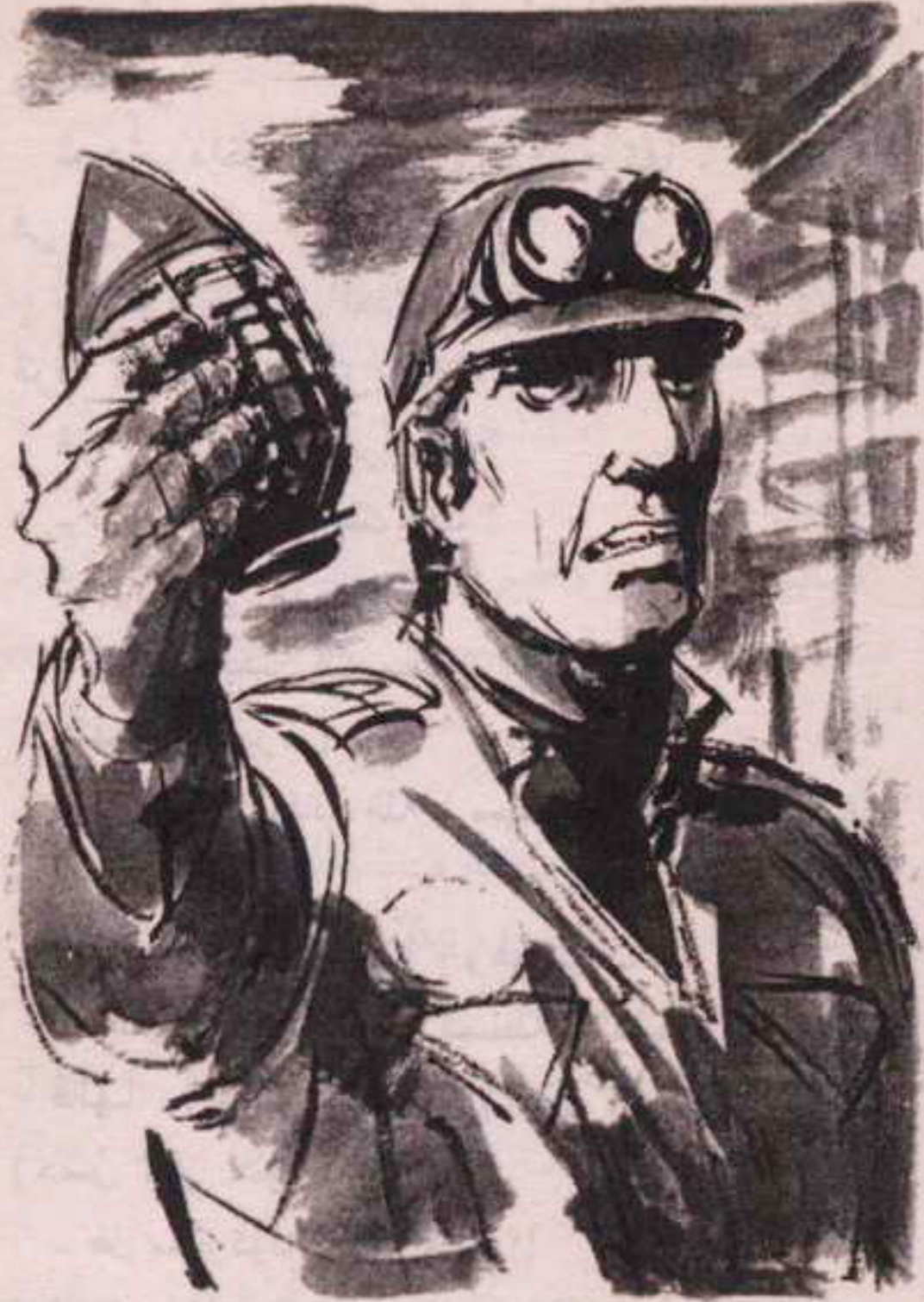
ومع صرخته ، انتزع من حزامه قنبلة مستديرة وهو يتراجع في سرعة ..