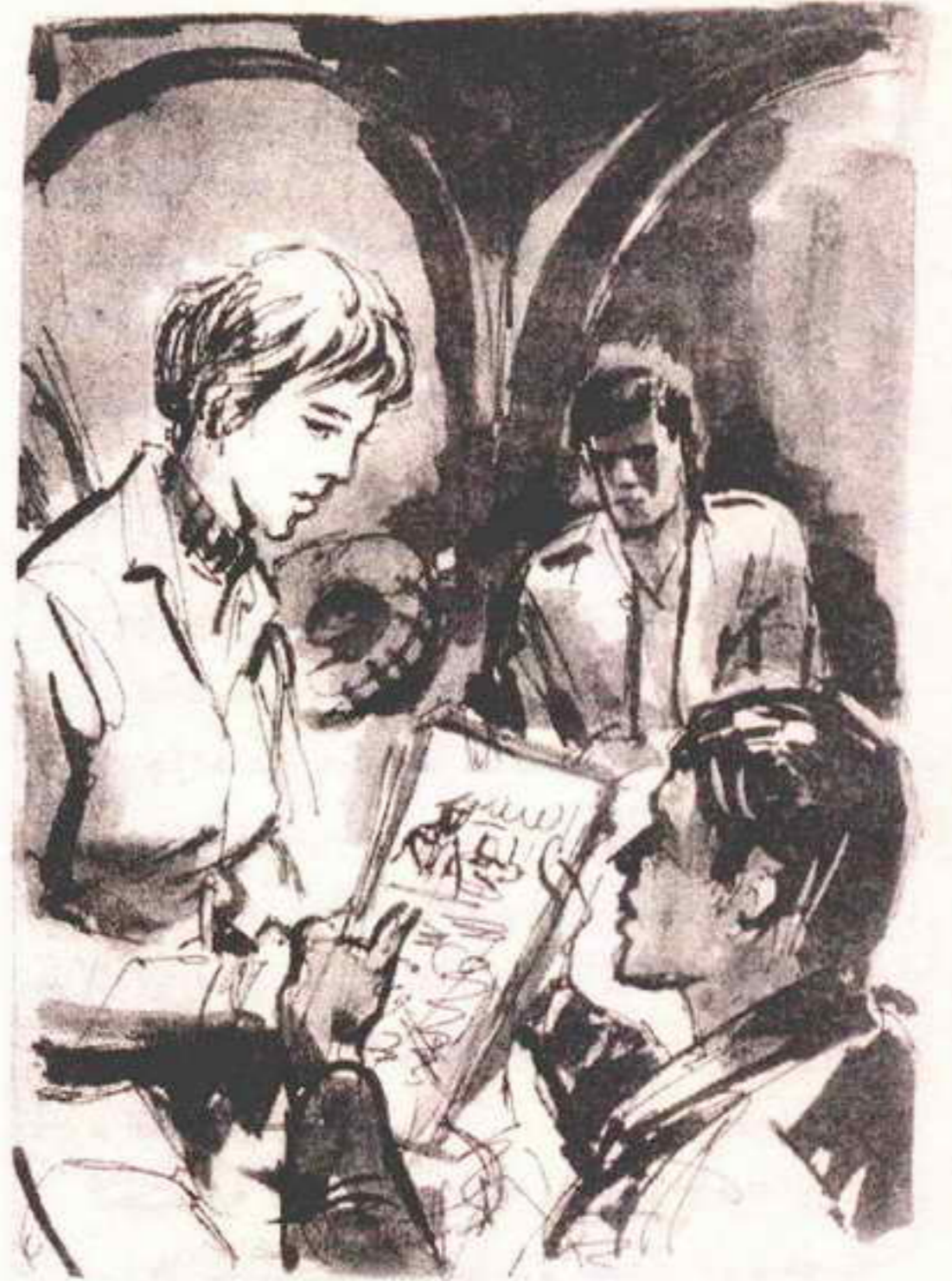
قرأ (طارق) الخبر في اهتمام شديد ، ثم أشار إلى صورة (هولداشتاين) ، قائلاً : - أهذا هو !؟ ..

- أراهن على أن نشر الخبر جزء من فخ كبير ، أعدوه لنا ، إذا ما حاولنا السعي لإنقاذ رفيقكما . أجابه ( طارق ) في هدوء : - ليس لدى أدنى شك في هذا . أضاف ( نور ) في سرعة : - ولكننا لن نتخلى عن ( أكرم ) . تبادل رجال المقاومة نظرة متوترة ، قبل أن يقول ( آلان ) في حزم : - يوسفنى أن أقول هذا يا ( نور ) ، ولكننا لن نتعاون معكم في هذا الشأن . أجاب ( نور ) : - خطأ يا ( آلان ) .. لا بد أن نتعاون جميعاً ؛ لمواجهة ( هولداشتاين ) . قال أحد رجال المقاومة في حدة : - كلاً يا رجل المستقبل .. إنها قضيتكما وليست قضيتنا .. إننا نعلم أن ( هولداشتاين ) قد أعد لنا فخاً ، ولن نلقى أنفسنا فيه بهذه البساطة . قال ( طارق ) بنفس الهدوء : - ستكون هناك خطة بالتأكيد .