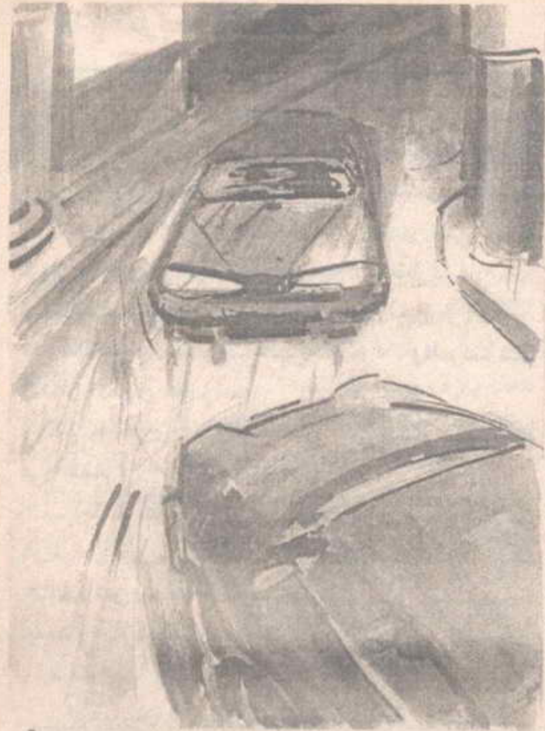
وفوجيء ( نور ) بالسيارة الصغيرة تنحرف بحركة حادة ، وتعترض طريقه في عنف ..

إعجابي وثقتي بحق .. قالها ، وأخرج من جيبيه جهازًا صغيرًا ، ضغط أزراره ، فاشتعل محرك سيارته الصغيرة ، قبل أن تنطلق بغتة تكو سيارة ( نور ) .. وفوجيء ( نور ) بالسيارة الصغيرة تنحرف بحركة حادة ، وتعترض طريقه في عنف ، وصرخ ، ( أكرم ) : - يا إلهي ! .. احترس يا ( نور ) .. وضغط ( نور ) فرامل سيارته بالفعل .. ولكن السيارة الصغيرة كانت أقرب مما ينبغي .. ولم يكن هناك مفر من الاصطدام .. أبداً .