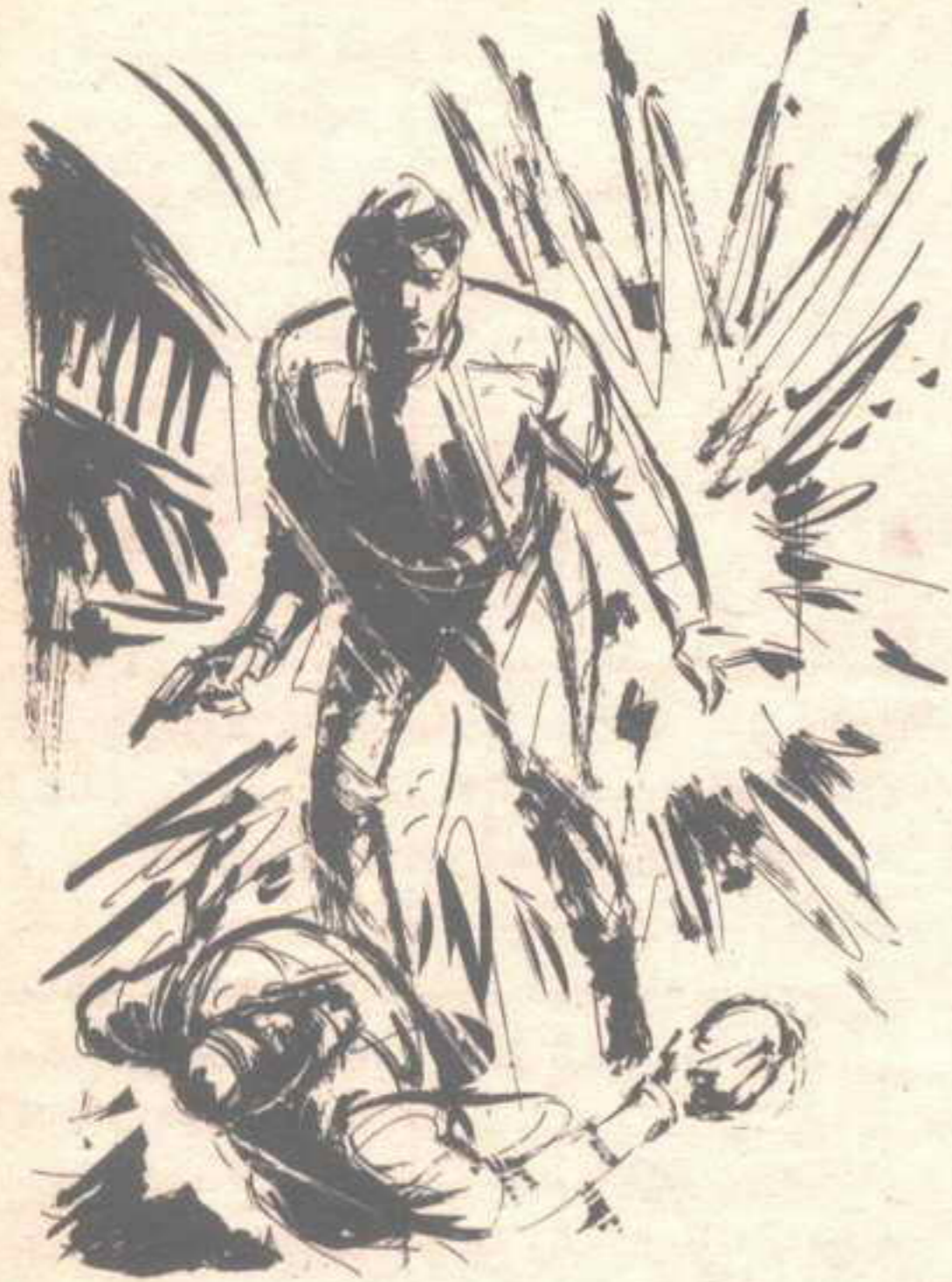
ومع انفجار ذلك الركن وانسحاقه بصاعقة قوية ، وثب (أكرم) ..