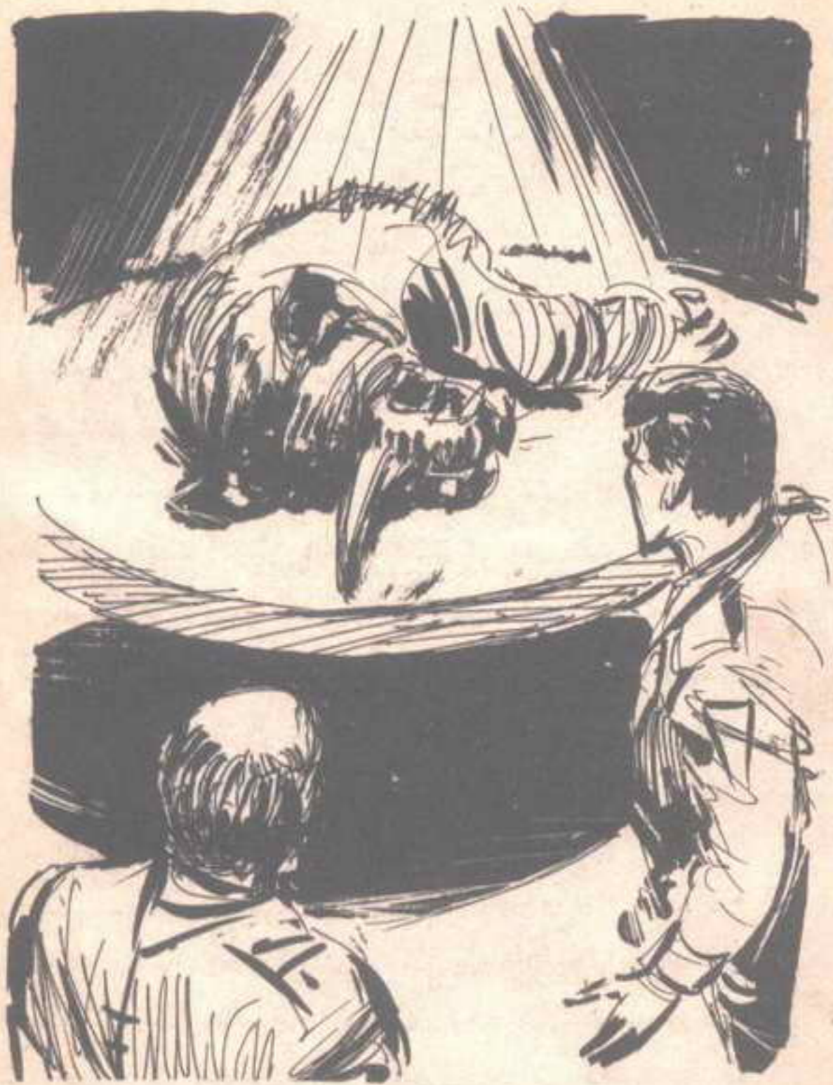
فتكوّنت فوقها صورة هولوغرافية مجسّمة لنصف جسد