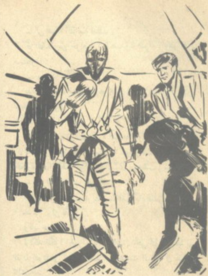
ثم التقط من حزامه كُرة صغيرة حراء ، وهو يقول مستطردًا : — وسبدأ بيده —

— ما هذا بحق السماء ؟ أجابه ( بودون ) في هدوء : — اهتزاز ذرّي فائق التردد ، يتيح لها العبور خلال ذرّات الباب ، مهما بلغ تماسكها . ثم أضاف في حزم : — إنه واحد من أسلحة ( أرغوران ) السريّة ، التي لم تقع بعد في أيدي الأعداء . سألته ( نشوى ) في توأّر : — هل سيفلح ؟ صمت لحظة ، ثم أجاب في هدوء : — سترون جميعًا .. سترون بعد لحظات .