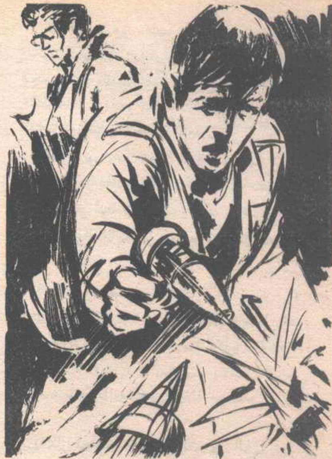
وانتزع مسدسه الليزرى ، وهو يضاوى القذائف المنمنمة ، وسفن الفضاء الدقيقة ..

لم يضع ( نور ) لحظة واحدة .. لم ينتظر حتى ليرى ما أصاب الدكتور ( وليد ) .. كان يعلم النتائج ، دون أن يراها .. وفى سرعة .. انتزع الدكتور ( شوقى ) من ذهوله ، وجذبه من معصمه فى قوة ، وهو يدفع ( محمود ) أمامه إلى خارج القاعة ، وأخذ يغلقها خلفهم فى إحكام .. ثم أخذ يعدو برفقتهما إلى الخارج ، حتى عَبَرُوا مَرَّ التعقيم ، فصاحت ( سلوى ) فى جَزَع :