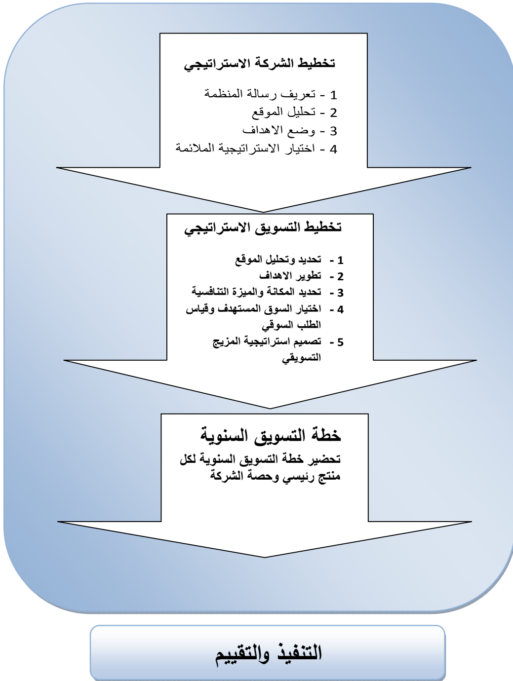
الشكل (3) المستويات الثلاثة في تخطيط المنظمة