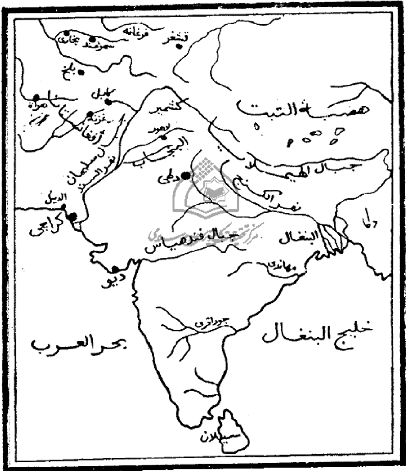
الهند في عصر دولة سلاطين المماليك بدلهي