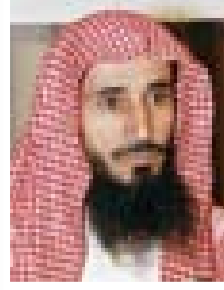
■ الشيخ ناظم المسباح