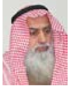
■ الشيخ حمد الأمير