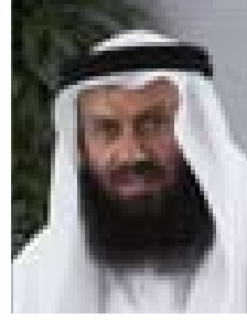
■ الشيخ خالد السلطان