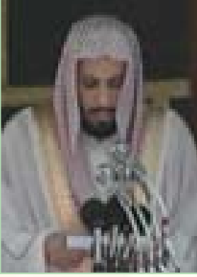
■ فضيلة الشيخ صالح آل طالب