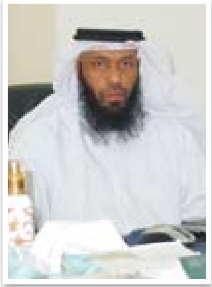
■ الشيخ ثامر العلي