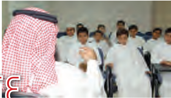
مسؤوليات المعلم (١-٢)