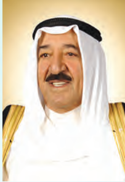
صاحب السمو الشيخ صباح الأحمد الجابر الصباح

أكد سمو أمير البلاد الشيخ صباح الأحمد موقف دولة الكويت الداعم للمملكة العربية السعودية لحماية أراضيها ومواطنيها، مشدداً على أن أي اعتداء على شبر من أراضي المملكة هو اعتداء على الكويت، مؤكداً استعداد القوات المسلحة الكويتية للمشاركة جنباً إلى جنب مع إخوانهم بالقوات المسلحة السعودية لطرد المعتدين من أرض المملكة.