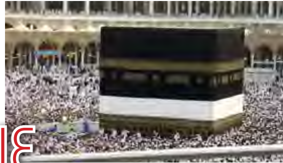
مواقف وأحكام في الحج

٢٢ • مسارات أسرية: لماذا احتواء المشكلات وليس حلها