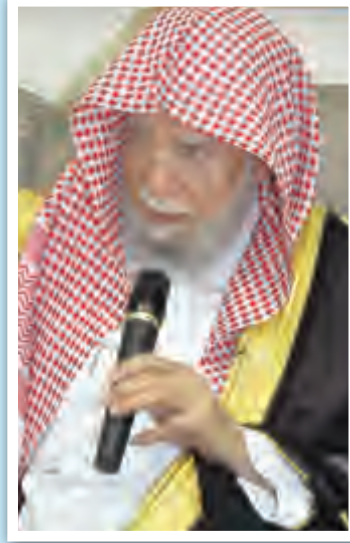
الدكتور عبدالله بن عبدالمحسن التركي

الاختلاف والتنازع في قضية لها جانب ديني لا بد أن نرجع فيه إلى الأساس وهو الكتاب والسنة