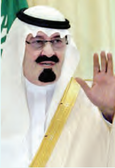
خادم الحرمين الشريفين الملك عبدالله بن عبدالعزيز