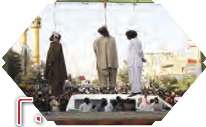
أحوال أهل السنة في إيران