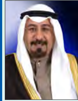
الشيخ د. محمد الصباح

أعلن نائب رئيس مجلس الوزراء ووزير الخارجية الشيخ د. محمد الصباح عن وقوف الكويت إلى