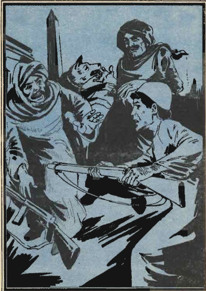
وصوب «سيد» بندقيته نحو «أبو الليل»

«بدران» و«همام» وربطت «مشيرة» جروح «بدران» التي سببها له «فهد».