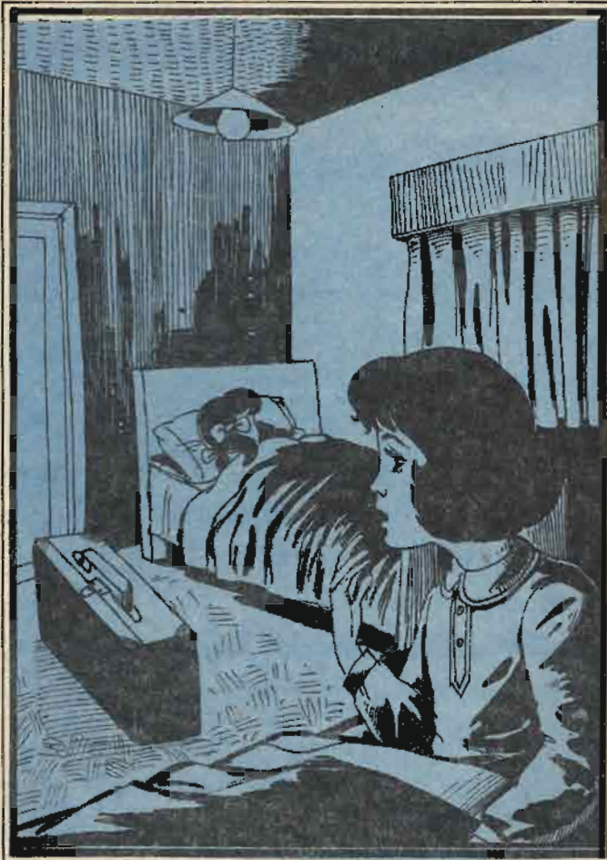
انتهت «فلفل» إلى الحقيبة التي وضعت الحماة الزاجل بداخلها

جميعاً (الخطور) ومعهم «فهد» . وطلب «خالد» من سائق الخطور أن يأخذهم إلى أقرب فندق ..