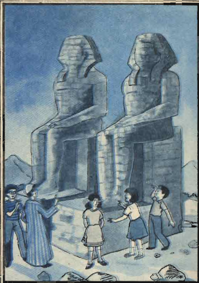
زاروا أولاً تمثال ممنون وكان التمثال لايزيد إرتفاع كل منها على عشرين مترًا

فتبع على ساقيه وقدميه حزينا صامتاً . . ودربت «فلفل» على