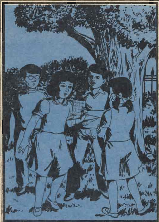
قدمت «فلفل» الرسالة لأولاد خالتها فقرعوها في دهشة

بشرط أن تعتنوا بتلك الحمامة الجميلة. فوعده «فلفل» بذلك بعد أن شكرته، وخرجت من العيادة مع أولاد خالتها عائدين إلى الفيلا. دخل الجميع الفيلا. . وكانت «فلفل» تحمل الحمامة بعناية ورفق وصعدت بها إلى غرفتها وساعدتها «مشيرة» و«خالد» و«طارق» في إعداد فراش خاص لين للحمامة المصابة لترقد فيه إلى أن يشفى جناحها. .