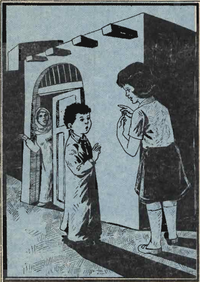
قال « على » : إن والدك تقول إن العصابة خطفت أوى بسبب الكنز

هتفت « فلفل » : بالضبط . هذا يفسر كل شيء . . لا بد أن من اختطف « عاشور » اختطفه بسبب علمه بذلك الكنز الذى تم العثور عليه وهو يعذبه ليتزعم منه اعترافاً بمكان ذلك الاكتشاف .