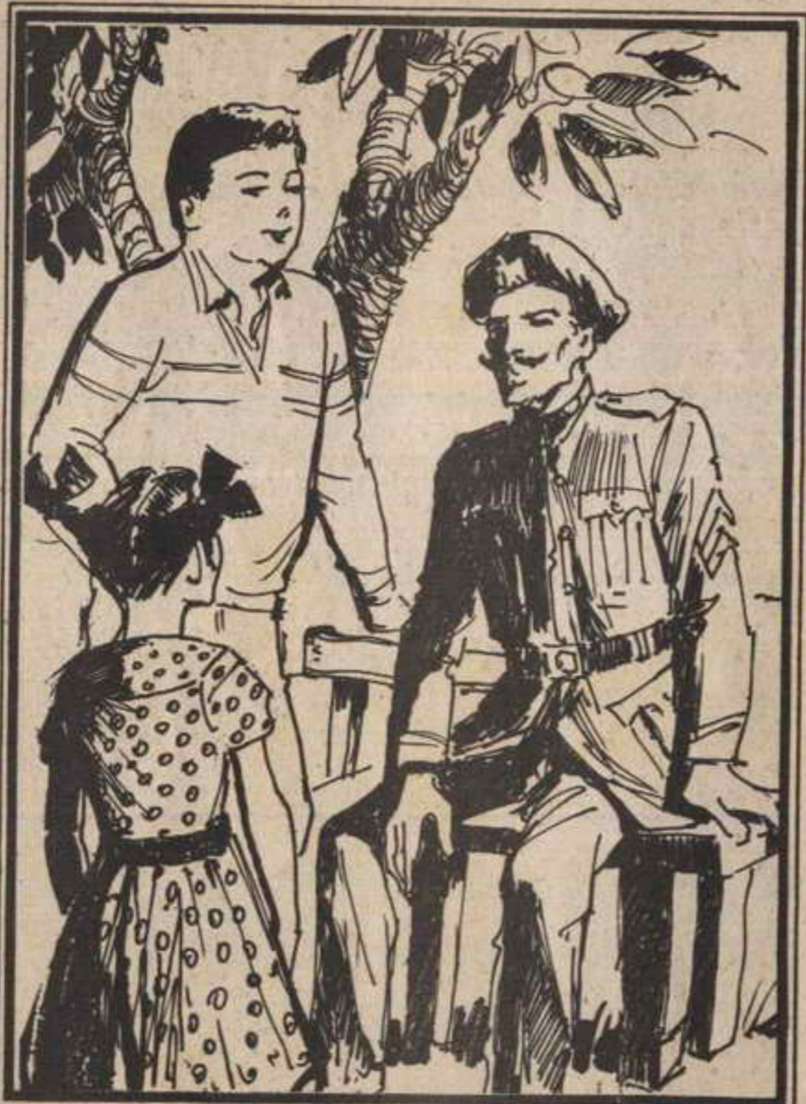
دعا الأصديق الشاويش «فرقع» إلى الجلوس معهم ..

تختخ: إننى لا أعرف طبعاً .. ولكن من المفروض أن نعتمد على أنفسنا ، وخاصة أن المفتش «سامى» مسافر .. والوقت أمامنا ضيق للعثور على الفتاة ! وكأنما الحديث عن الشرطة قد استحضر رجال الشرطة .. فلم يكده «تختخ» ينتهى من جملته حتى ظهر الشاويش «فرقع» على باب الحديقة .. كان غارقاً