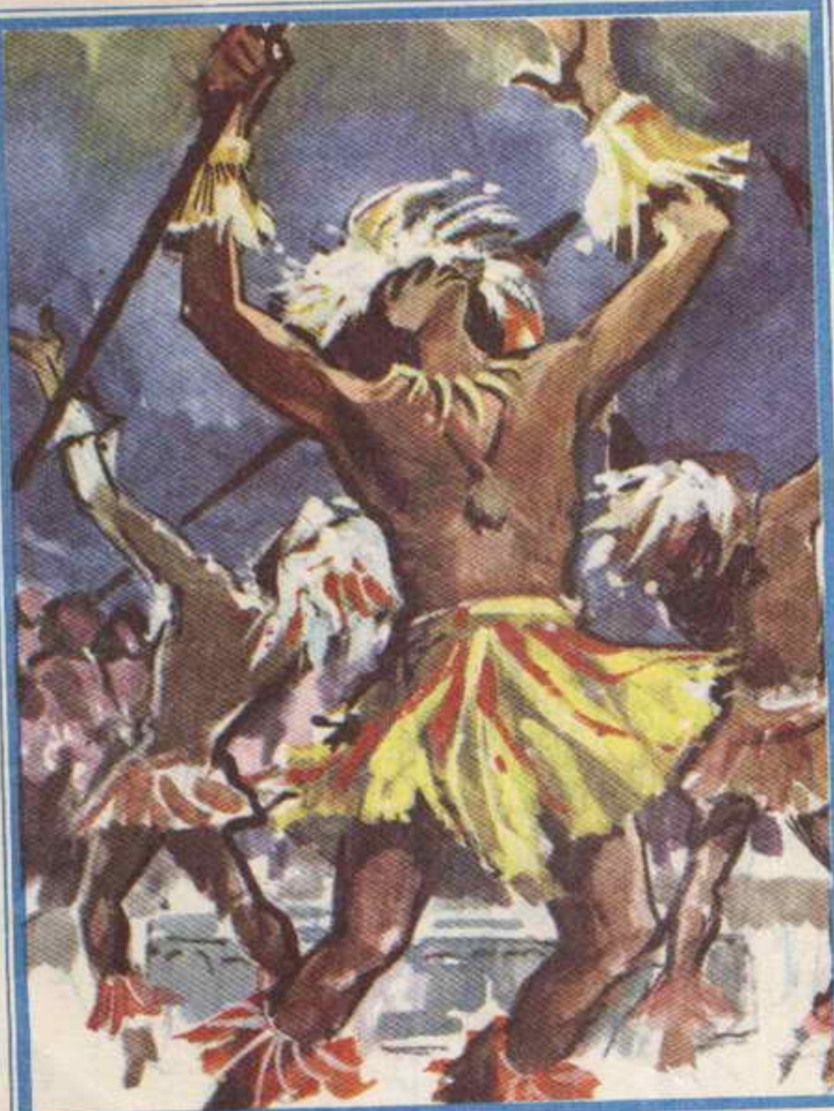
« يتوج رأس كل راقص تاج من الريش .. ويده رمح طويل .. »

ويدفع عربته الحديدية أمامه .. بعد أن أفرغ الصندوق .. متجهاً إلى « شاليه » آخر .. وهو يربت على الحقيبة الممزقة ..