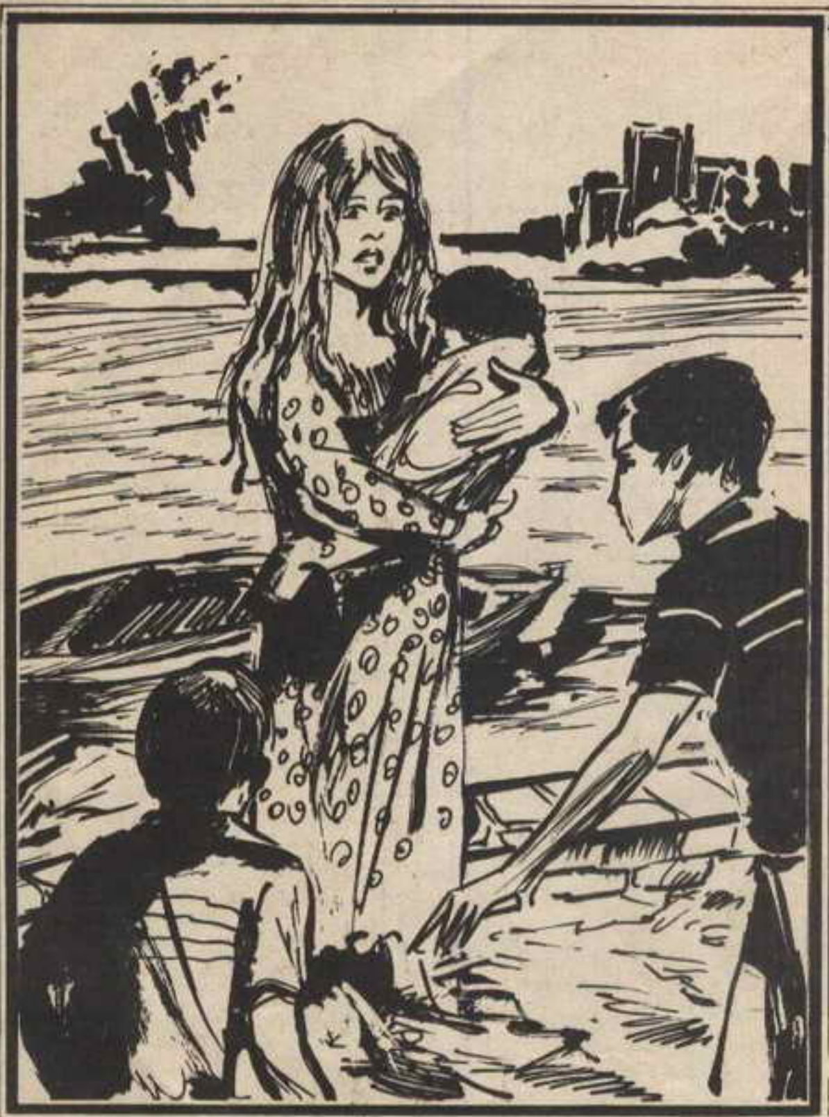
وقفت المرأة بثيابها المبتلة . . . وقد تهدلت عصلات من شعرها الأحمر

وكان « عامر » قد عاد مسرعاً من المنزل .. حاملاً بطانية من الصوف ، فأخذتها « عالية » ولفتها حول جسد المرأة التي شكرتها بابتسامة رقيقة . . . ولكن « عالية » نظرت في تساؤل إلى المرأة ذات الشعر الأحمر والبشرة البيضاء وهي تقول في دهشة بعد أن لمحت وجه الطفل : الطفل أسود اللون !