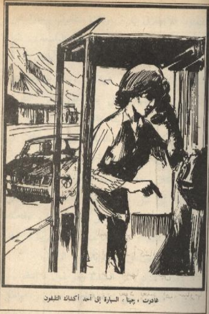
غادرت «چينا» السيارة إلى أحد أكشاك التليفون