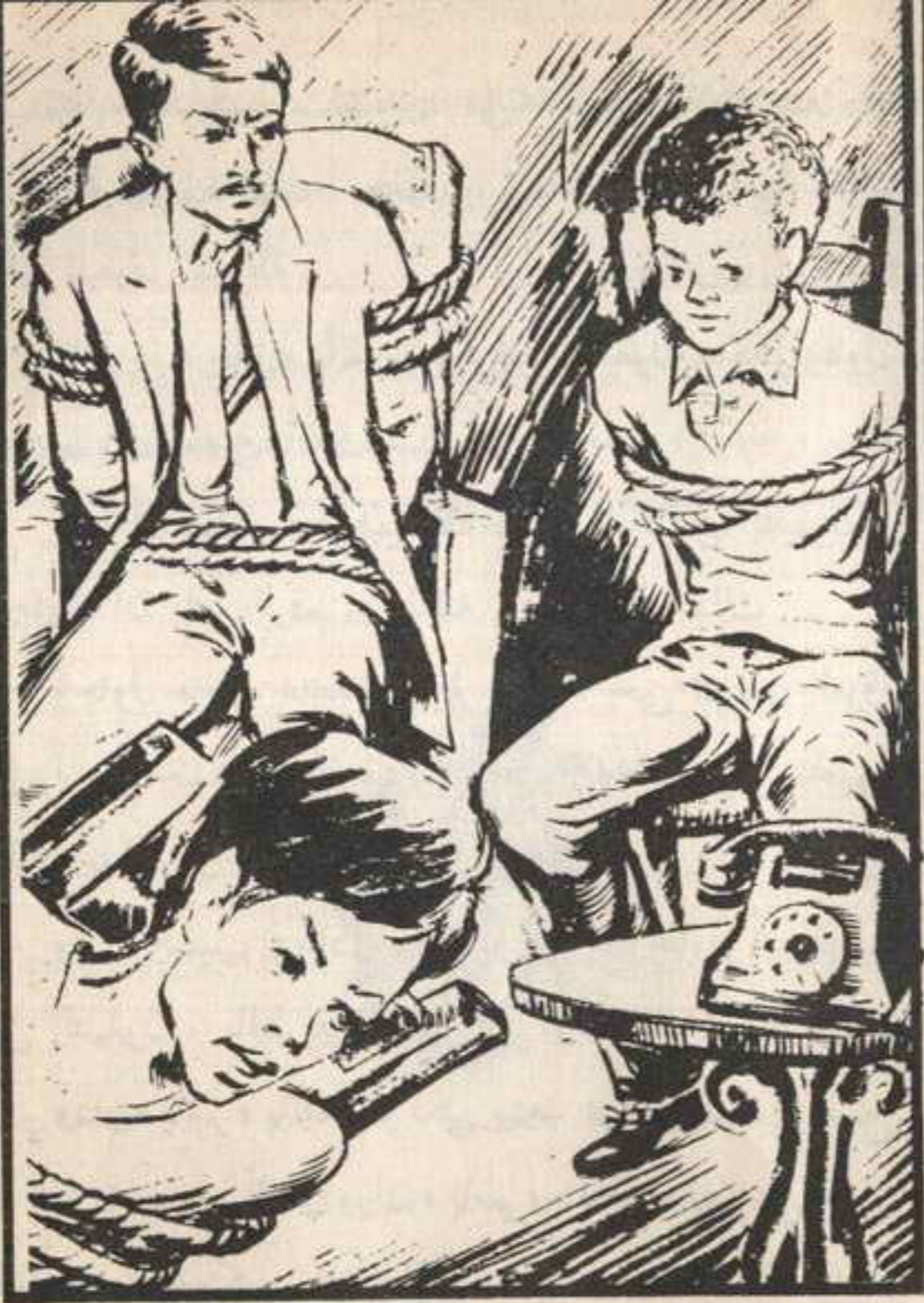
قال النقيب «عادل» : حاول أن تضرب المنضدة التي عليها التليفون لكي يسقط . . .

فقال «عادل» : حاول أن تصل أولاً ، ثم بعد ذلك تحاول أن تفكر في طريقة لذلك . . .