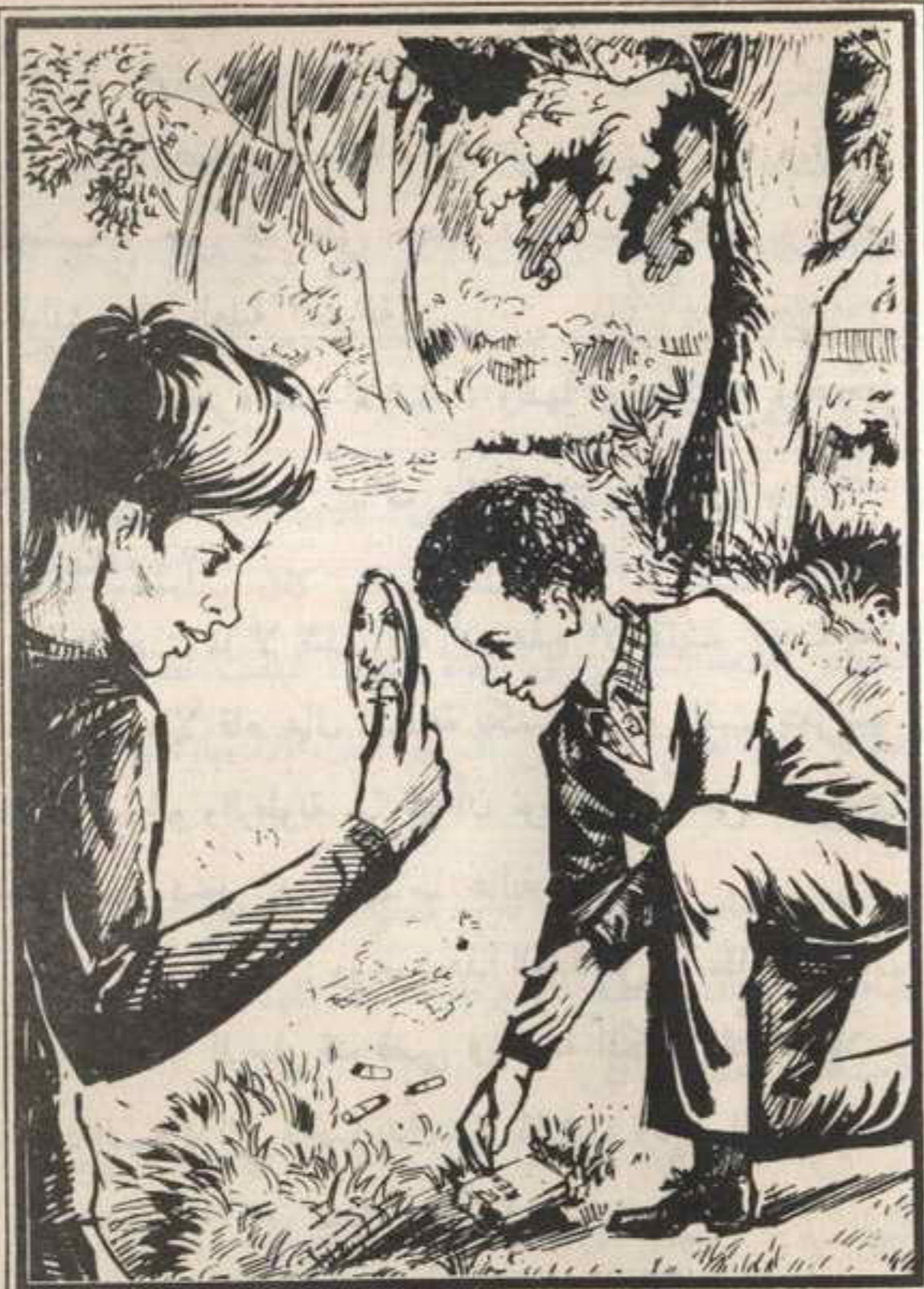
صاح « هشام » : انظر يا « ياسر » أليست هذه مرآة ؟ !

أن لهذا الرجل علاقة بتلك الجرائم . وصاح « هشام » فجأة : انظر يا « ياسر » . . أليست هذه مرآة ؟