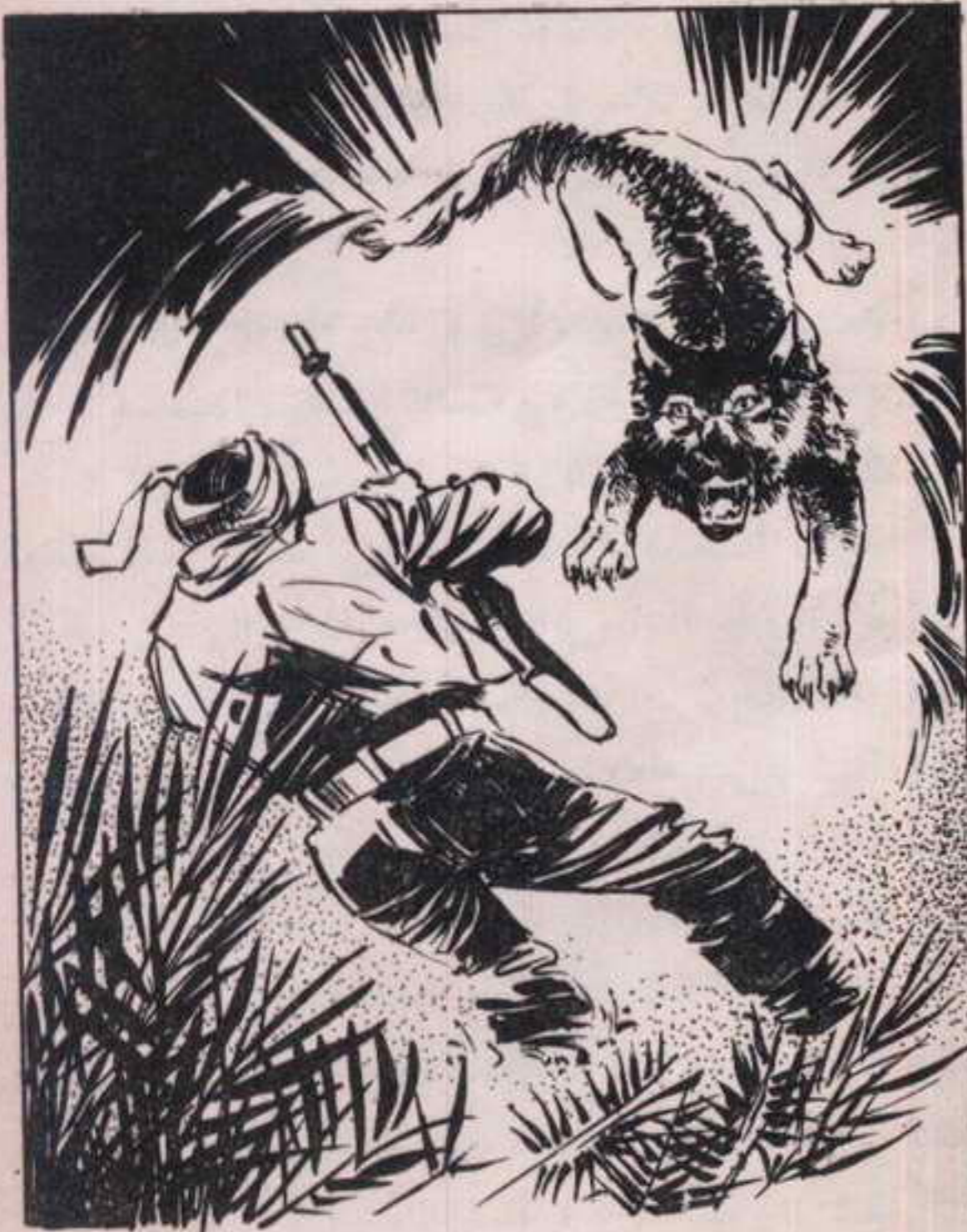
قفز «زنجري» في الظلام كالسهم على ذراع «حافظ» التي تمسك بالبندقية !

قفز «محب» دون انتظار إلى قارب من القوارب العديدة الموجودة في المرسى الصغير . . وأسرع يجدف مبتعداً خلف القارب الذي اختفى في الظلام . . وصاح «تختخ» : انتظر يا «محب» !