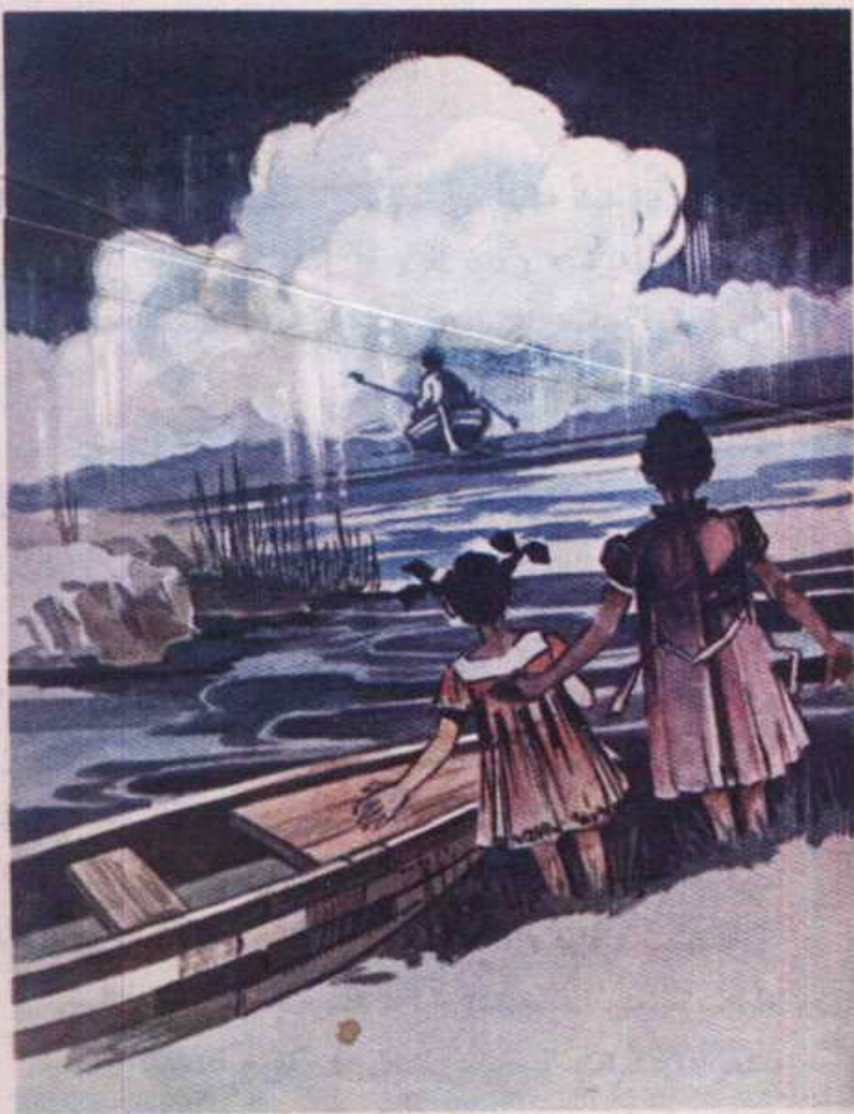
وقفت «نوسة» و«لوزة» على الشاطئ... ومن بعيد ظهرت سحابة الضباب الضخمة

أخذ «محب» و «عاطف» يجدفان والضباب تزايد كثافة . . وفجأة دوى في الصمت صوت هدير بعيد ، أخذ يتزايد شيئاً فشيئاً ، ثم ظهر في قلب الضباب الكثيف ضوء أصفر كاشف يشق الضباب في خط مستقيم . .