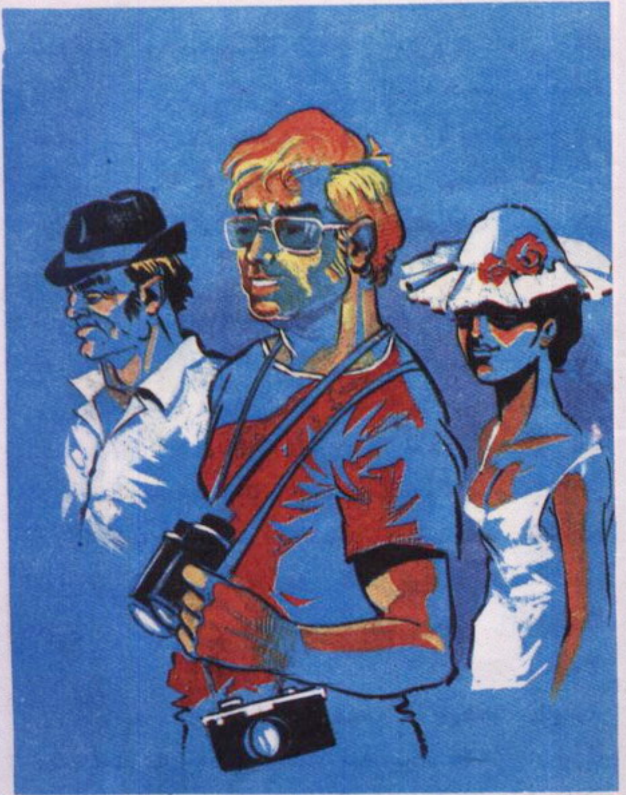
ظهر الأمريكي ومعه رجل آخر وسيدة.