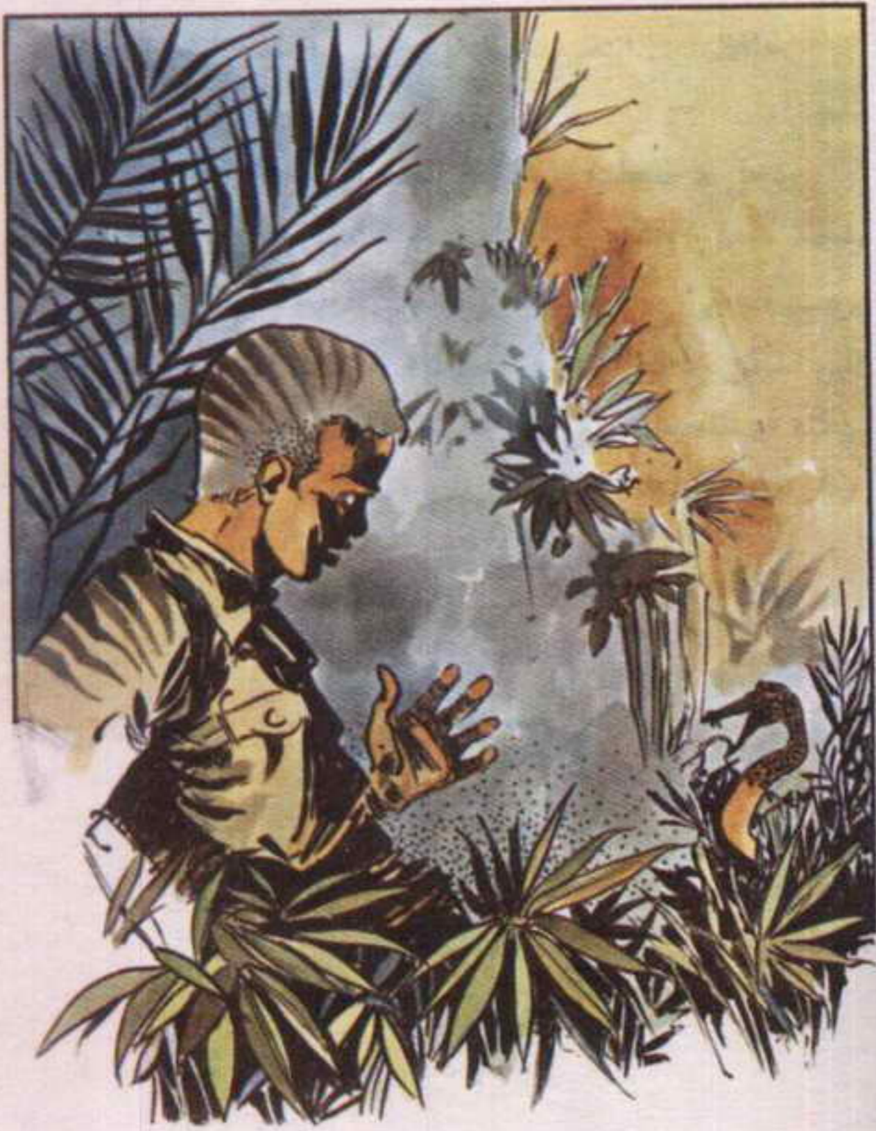
ظهرت أمام «محب» حية ضخمة تزحف بين الأعشاب الخضراء.