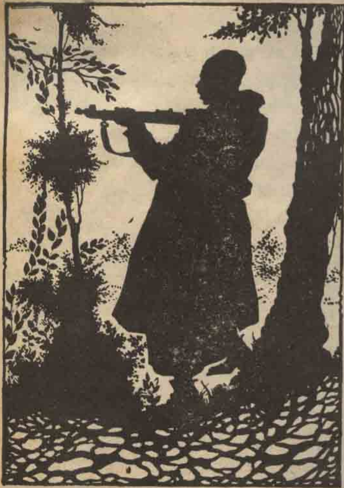
واستطاع الحارس أن يرى الشبح في الظلام ويطلق عليه النار

باب الحديدية . . وعندما اطمأن إلى ذلك خرج من مكمنه ، وقام بإبدال اللوحات ، ووضع المزيفة في الإطارات ، وأخذ اللوحات الأصلية ثم فتح إحدى النوافذ ، وقفز منها وأعاد إغلاقها من الخارج بقدر ما يستطيع حتى لا يشك أحد . . فقد كان يريد أن يبعد أى شبهة سرقة حتى لا يتحرك رجال الشرطة ، ولكن لسوء الحظ عندما وصل إلى سور الحديدية الحلقي عاد الحارس ليحضر شيئاً وشاهده من بعيد ، فأطلق النار عليه وأصابه . . ولكن الحارس لم يكن متأكداً من إصابته ، ومن ناحية أخرى فقد فضل أن يسرع إلى المتحف ليرى ما حدث فيه . . وعندما وجد الأبواب والنوافذ كلها مغلقة اطمأن حين عرف أن شيئاً لم يحدث وأحضر الشيء الذى كان يبحث عنه ثم عاد للجلوس مع حارس الباب . نوسة : ولكن الحديدية مضاعة . وكان يمكن للحارس أن يراه بعد إصابته .