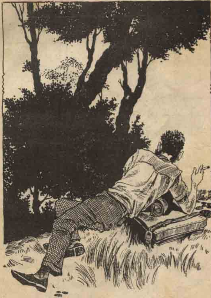
لقد أصيب، واضطر إلى البقاء في حديقة المتحف خوفاً من الخروج إلى الشارع

”رزق“ أنه أصيب وهو سائر في الطريق ، ولا يعرف من الذى أطلق عليه الرصاص . . . وموعد وصوله إلى المستشفى هو الساعة الثامنة والنصف صباح السبت الماضى كما قال فى التحقيق كما أنه لم يكن معه شيء عندما دخل المستشفى .