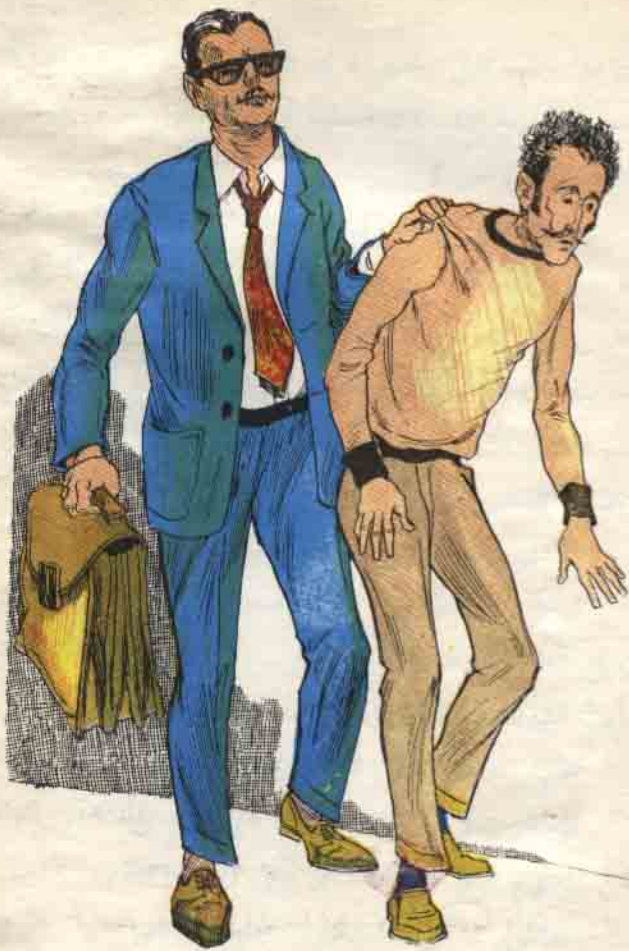
وأمسك المفتش « برزق » وقاده إلى بوفيه القطار ليروي قصته