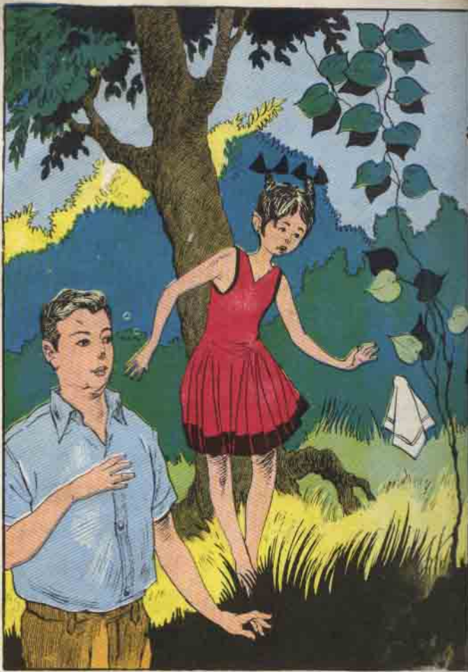
واستطاعت « لوزة » أن ترى مندبلا ملقى بين الأعشاب في الحديقة

المتحف جريئاً حتى وصل إلى المستشفى ، فلا بد أنه أخفاها في مكان ما قبل أن يصل إلى المستشفى ، فقد كان من الخطر عليه أن يأخذها إلى هناك .