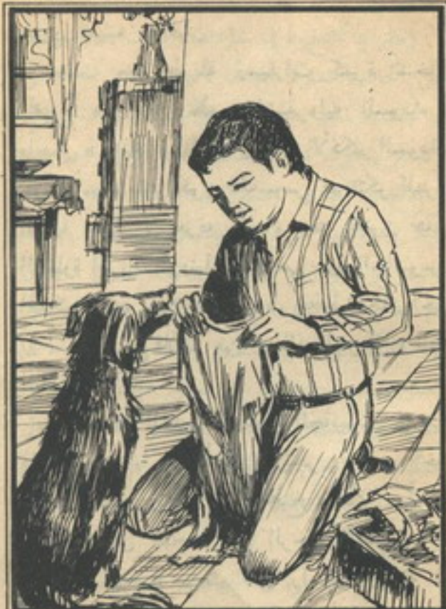
وقدم «تختخ» «زنجر» الملابس الداخلية للجاسوس فقد يستطيع التعرف عليه من راتحتها

أحد ليشتبته فيهم .. قال «تختخ» للمفتش وهم يقفون بعيداً : «أقترح أن أدخل أنا و«زنجر» إلى الجراج ونتجول أو نختفي في إحدى السيارات الواقفة فمن الأفضل أن يكون أحدنا قريباً من الجاسوس» ..