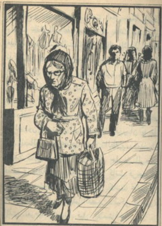
تبع «تختخ» السيدة العجوز حتى وقتت أمام السينا

الذي يتوقف على وجوده حل اللغز. تسلمت العجوز البريد، وخرجت فتبعها «تختخ» من بعيد، وعبر خلفها شارع الجلاء حيث يقع مبنى الأهرام، ثم سارت بجوار هيئة التليفونات فسار خلفها، ثم اجتازت شارع رمسيس ودخلت إلى شارع سوق التوفيقية، فأسرع «تختخ» يقترب منها حتى لا تضع منه في زحام السوق، وأصبح على بعد خطوات منها وهي تسير في نشاط ظاهر، ثم توقفت عند باعة الفاكهة فاشترت ما يلزمها، ثم واصلت السير، فسار يتبعها حتى وصلت إلى شارع توفيق، واجتازت شارع ٢٦ يوليو، ودخلت إلى شارع طلعت حرب، وكانت حركة المواصلات والزحام على أشدها، ولكن «تختخ» استطاع أن يظل قريباً منها دون أن تشعر به. اتجهت العجوز إلى داخل شارع طلعت حرب