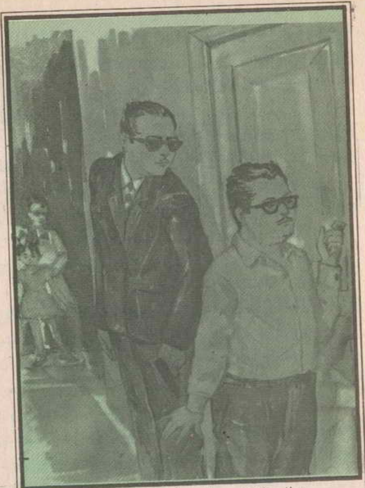
وطلب «تختخ» من المفتش أن ينتظر خارج الباب ويستمع إلى الحديث .

ارتبك «كامل» . واصفر وجهه وقال : أى أقوال؟ . تختخ : لقد قال إنه رأى نحو الساعة الواحدة قرب البنسيون يوم الحادث .