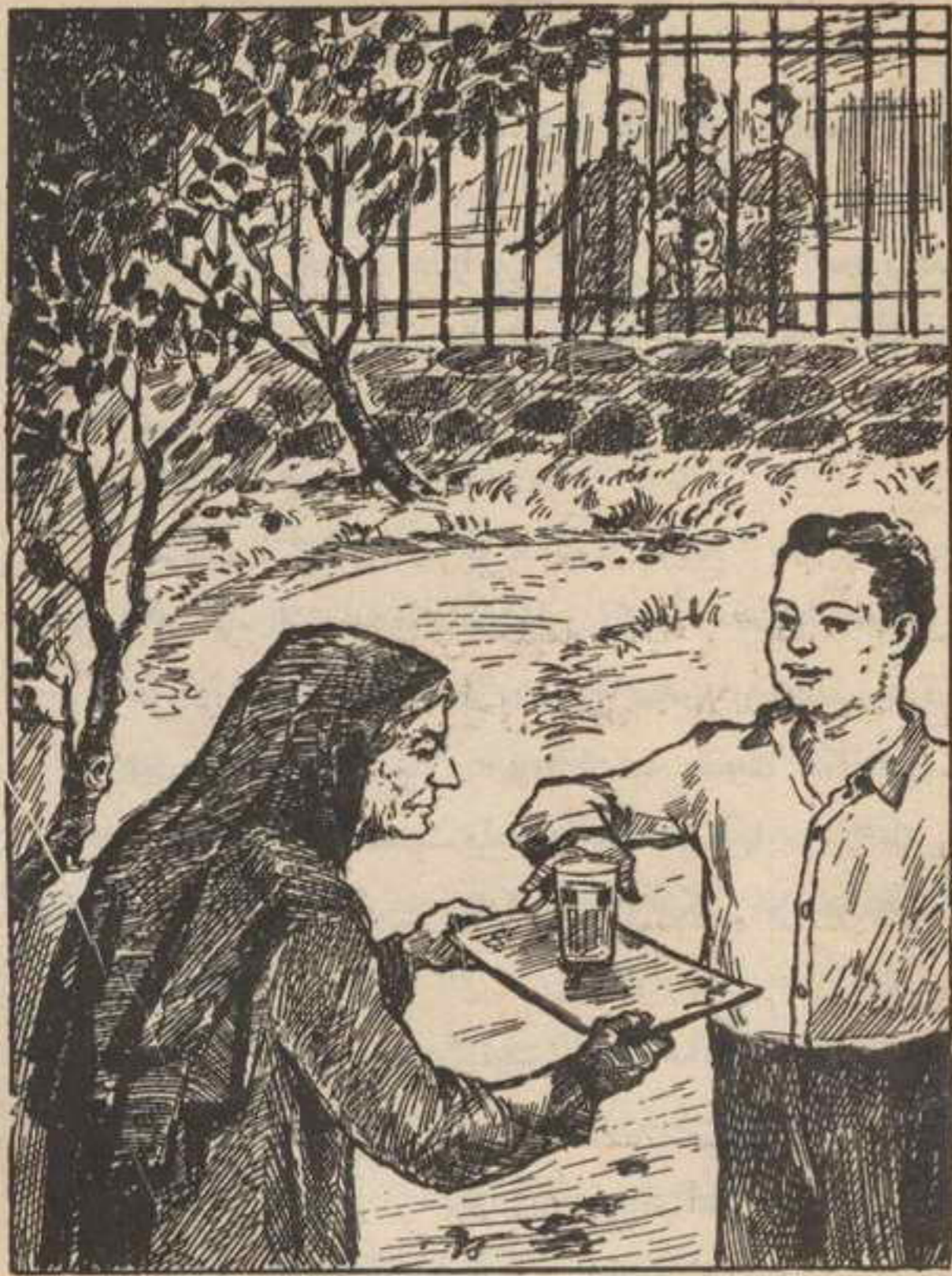
وقدمت السيدة الطيبة كوب الماء إلى "تختخ" وهي تبسم

العزیز "زنجیر" فهم الموقف ، فأخذ يهز ذيله ، ويطلق نباحاً خافتاً ، وكأنه يشجعها على استقبالهم .