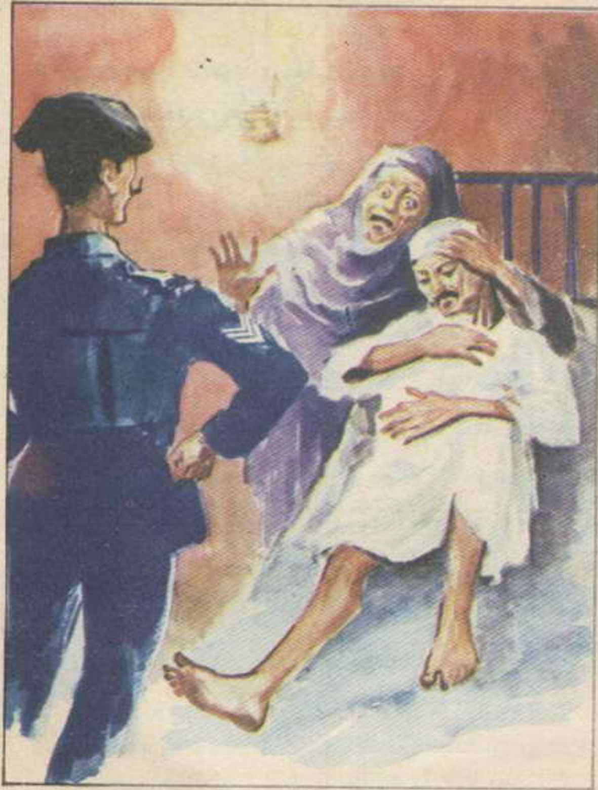
وأخذت السيدة تدافع عن زوجها المريض ، بينما الشاويش مصرّ على طرده

سوف أذهب وأتحدث معهم ، وإذا لم أجد بينهم المتهم ، فلن أسكت عنكم ، إنني لا أسمح لأحد بأن يسخر مني ، خاصة هذا الولد السمين ، وهؤلاء القروء الذين يسمون أنفسهم المغامرين الخمسة ، والآن فرقع من هنا ، وارقب النافذة » .