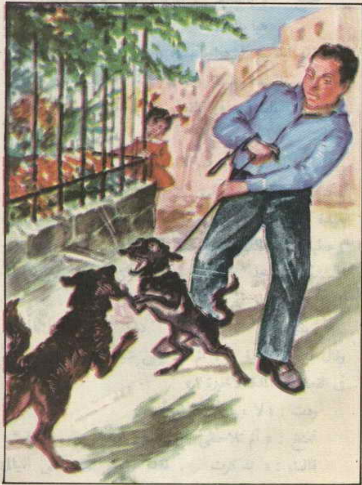
وحاول «تختخ» أن يوقف المعركة التي نشبت فجأة بين الكلبين

سماعة التليفون ثم قال للأصدقاء : « أيها المغامرون إن أمامنا لغزاً رائعاً ، ومغامرة مثيرة ، لقد قال الضابط إن الجواهر المسروقة مازالت ضائعة ، ولم يصل إليها رجال الشرطة » .