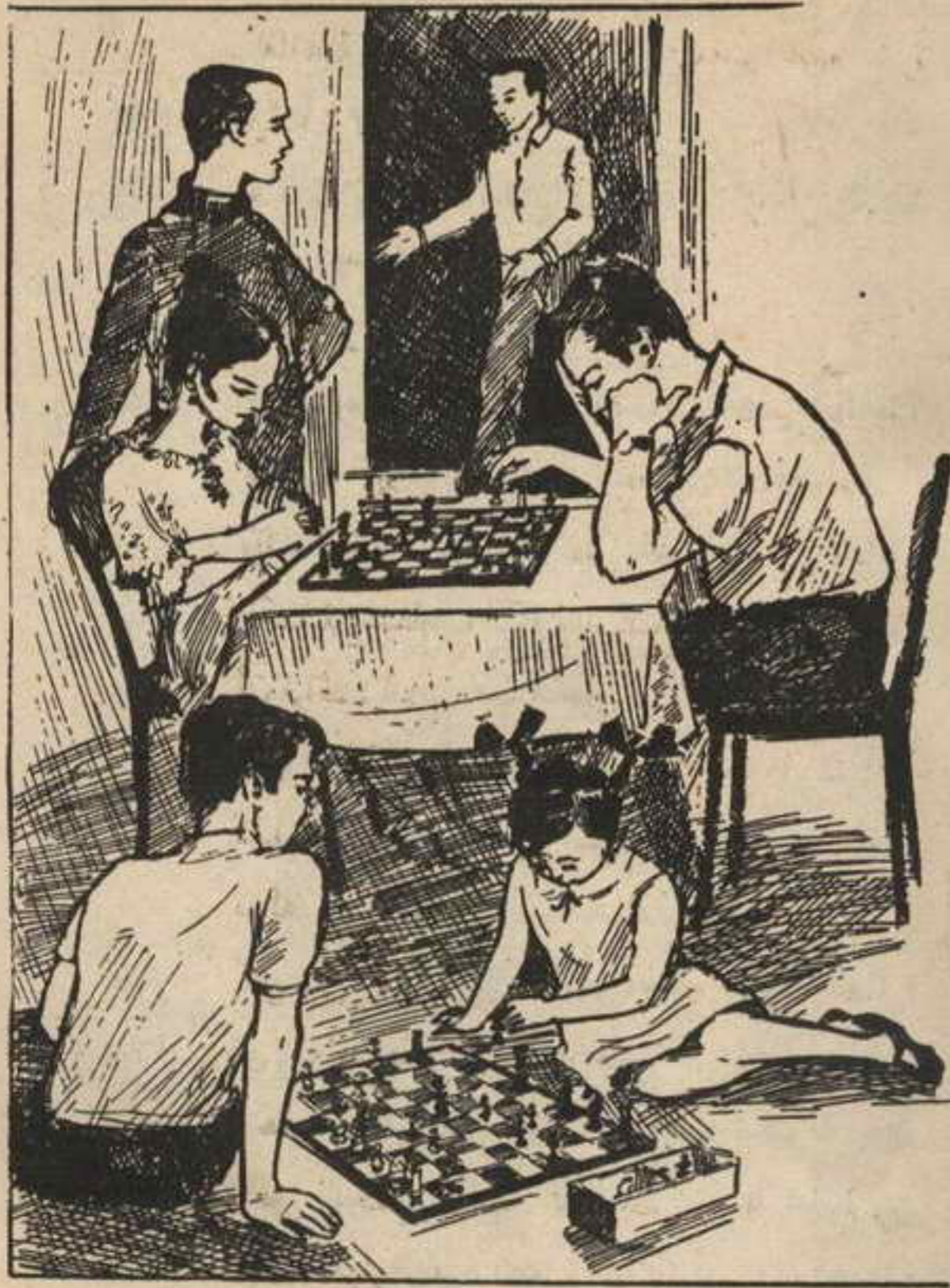
وحضر « جلال » وعنده أخبار جديدة عن بداية مغامرة

الغامضة فهل هناك رسائل غامضة هذه المرة أيضاً؟»