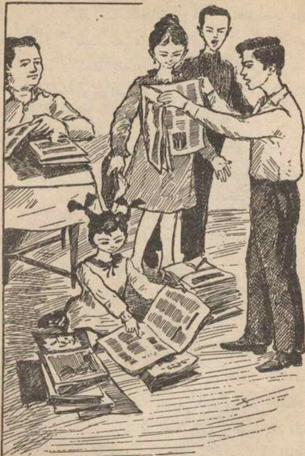
ووجد الأصدقاء جميع الثقوب التي تدل على الكلمات التي استخدمها الرجل المجهول .

يبين أن كلمة مقطوعة من هنا . أمسك "تختخ" بالمجلة . وأخذ يقرأ الجملة التي تنقص كلمة فقال : « وقد حصل الفائز الأول . . . جائزة قدرها ١٠٠٠ ليرة ، فما هي الكلمة الناقصة أيها المغامرون الحمسة ؟ » فردوا جميعاً في صوت واحد تقريباً : « على » .