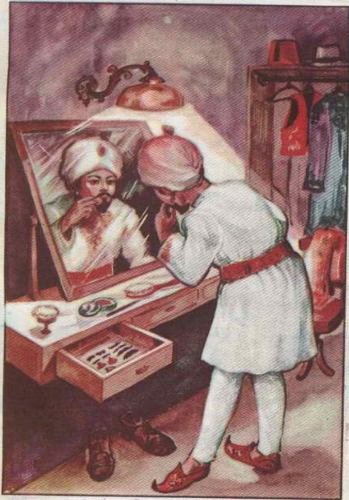
وضحك تختخ عندما نظر إلى نفسه في المرآة بعد أن تنكر في زي مهراجا

وفي تلك اللحظة سمع « تختخ » أصواتاً تصدر من غرفة المطبخ ، فأسرع يتسلل في الظلام إلى مصدر الأصوات . كانت الأصوات تصدر من المطبخ فعلاً . وعرف فيها « تختخ » صوت البواب « شحثة » وزوجته يتحدثان . وحاول « تختخ » أن يسمع ماذا يقولان . ولكن الباب كان مغلقاً تقريباً . فلم يستطع تبين