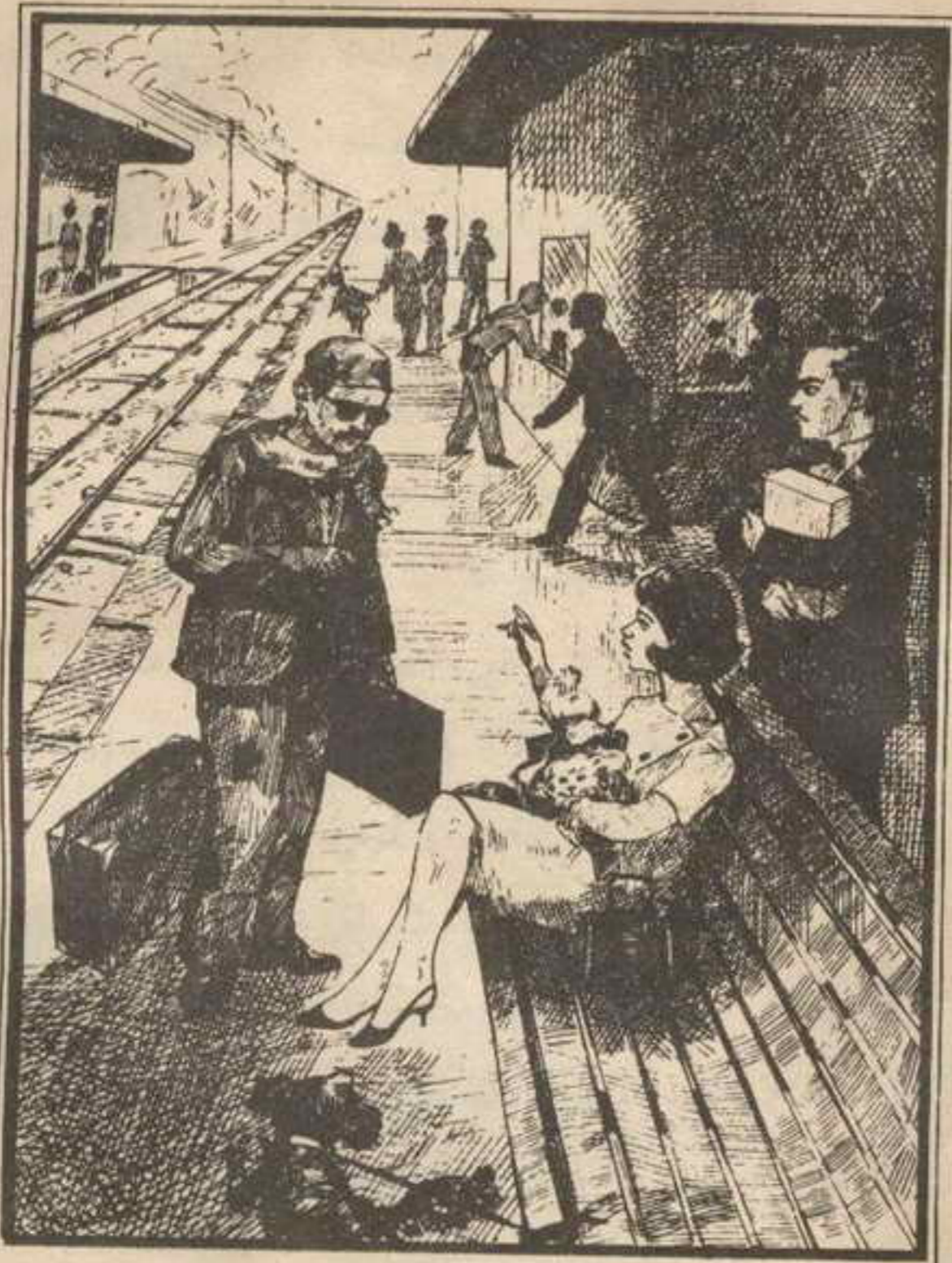
وكانت هناك سيدة أنيقة تحمل كلبة صغيرة

ولم يستمر « زنجر » في أفكاره كثيراً ، فقد حضر الكلب ، وجلس بجوار الكرسي تماماً .