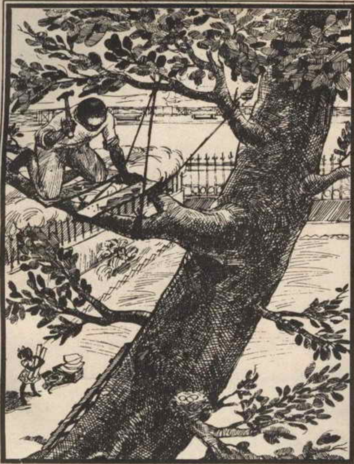
وأخذ « نور » يعد لنفسه مكانًا مريحًا

نور : إنه نسر من نوع خاص ، نسر بلا أجنحة ،