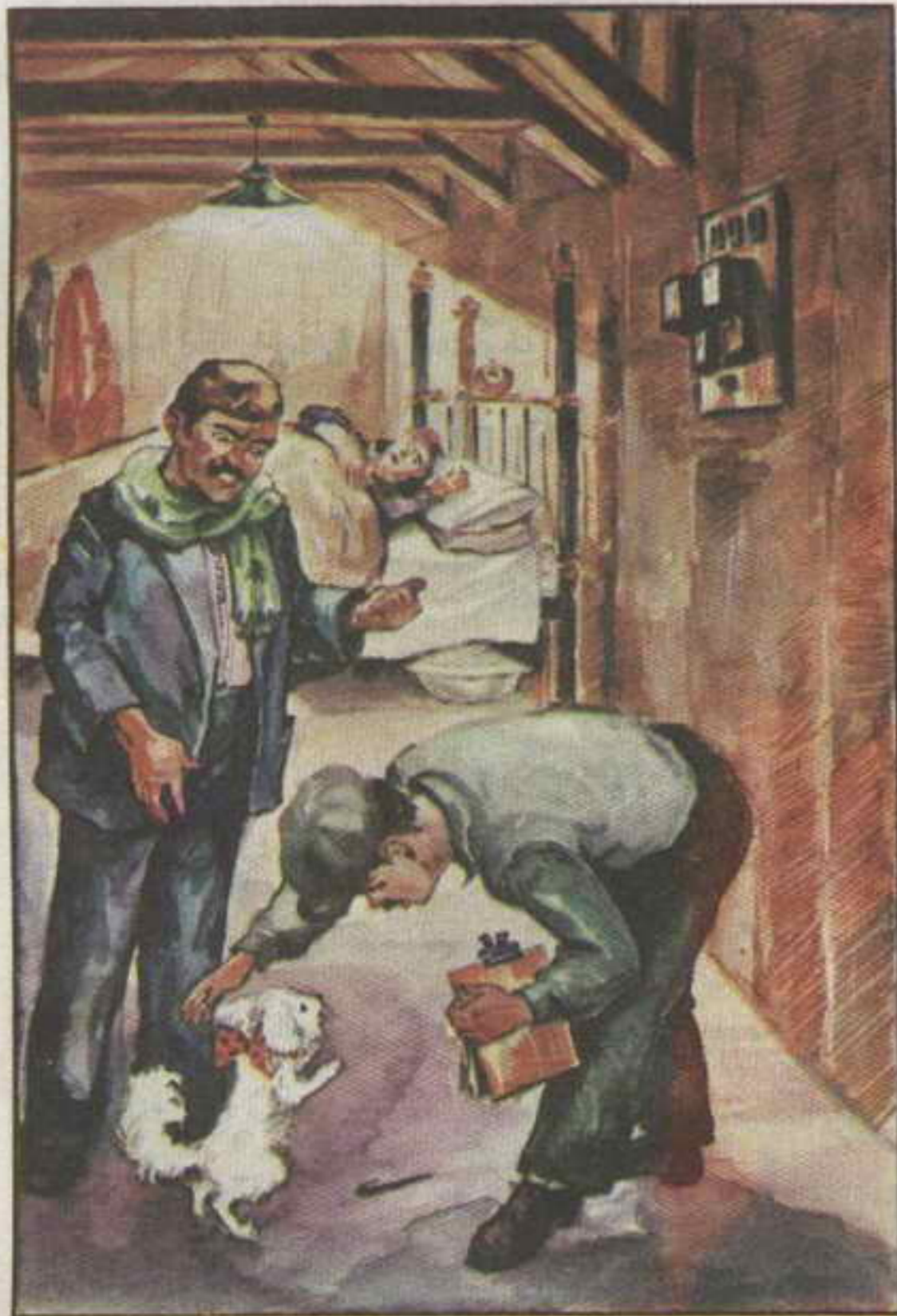
... ثم تظاهر بتخنيخ أن قلمه قد وقع منه فالتحنى على الأرض فوقعت عينه على دبوس