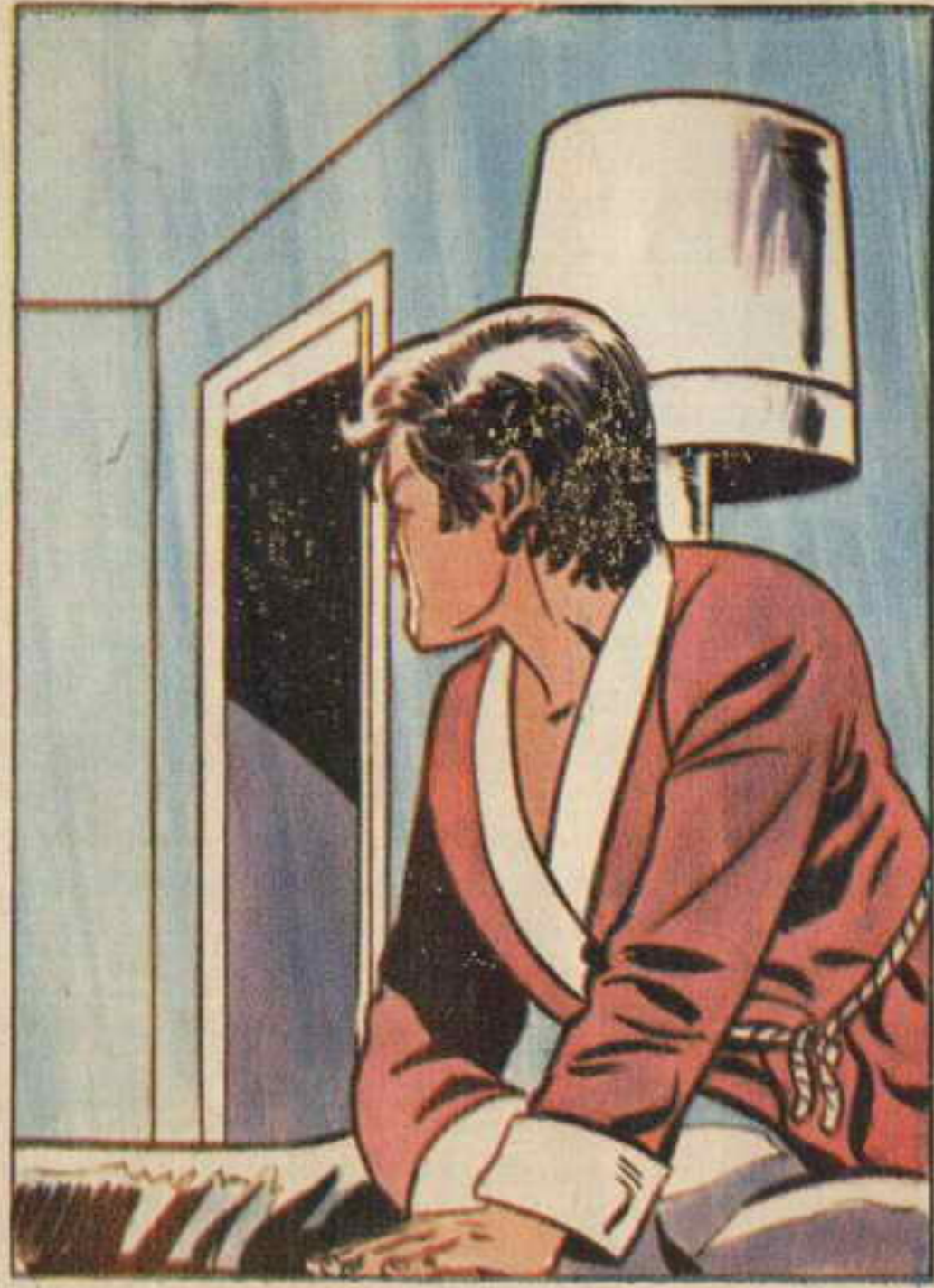
استيقظ أحمد بعد حوالي ساعة، فمتدشور بحركة ما ف الفرقة.

انضم اليه "قيس" و "أحمد" ، وظلا يختبران الباب . لحظة ، ثم قال "قيس" : - "هل ندعو احدا من الفندق ، او احدا من الاستعلامات !"