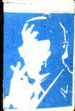
رفيع صفر الرجبى الغاناش الذى لا يعرف حقيقته احد