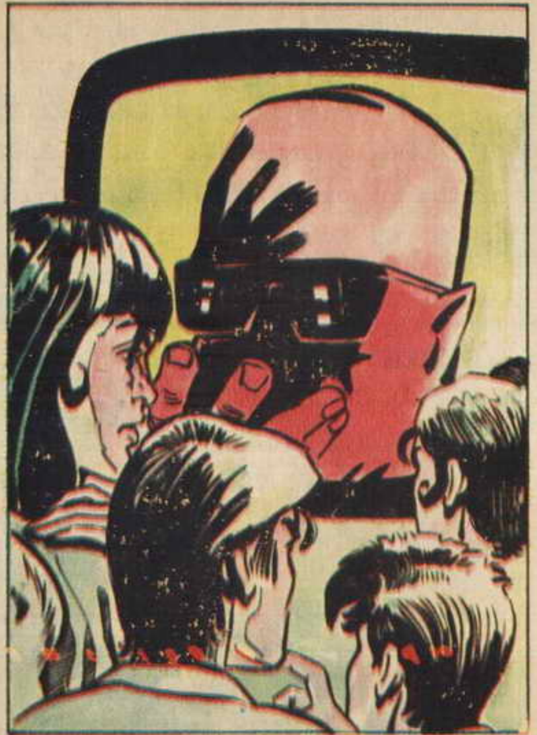
بدأ الضوء يزحف عن المكان ثم فجأة ، اضيئت شاشة ضخمة وكانها شاشة سينما ، ثم جاء صوت رقم "صفر" .