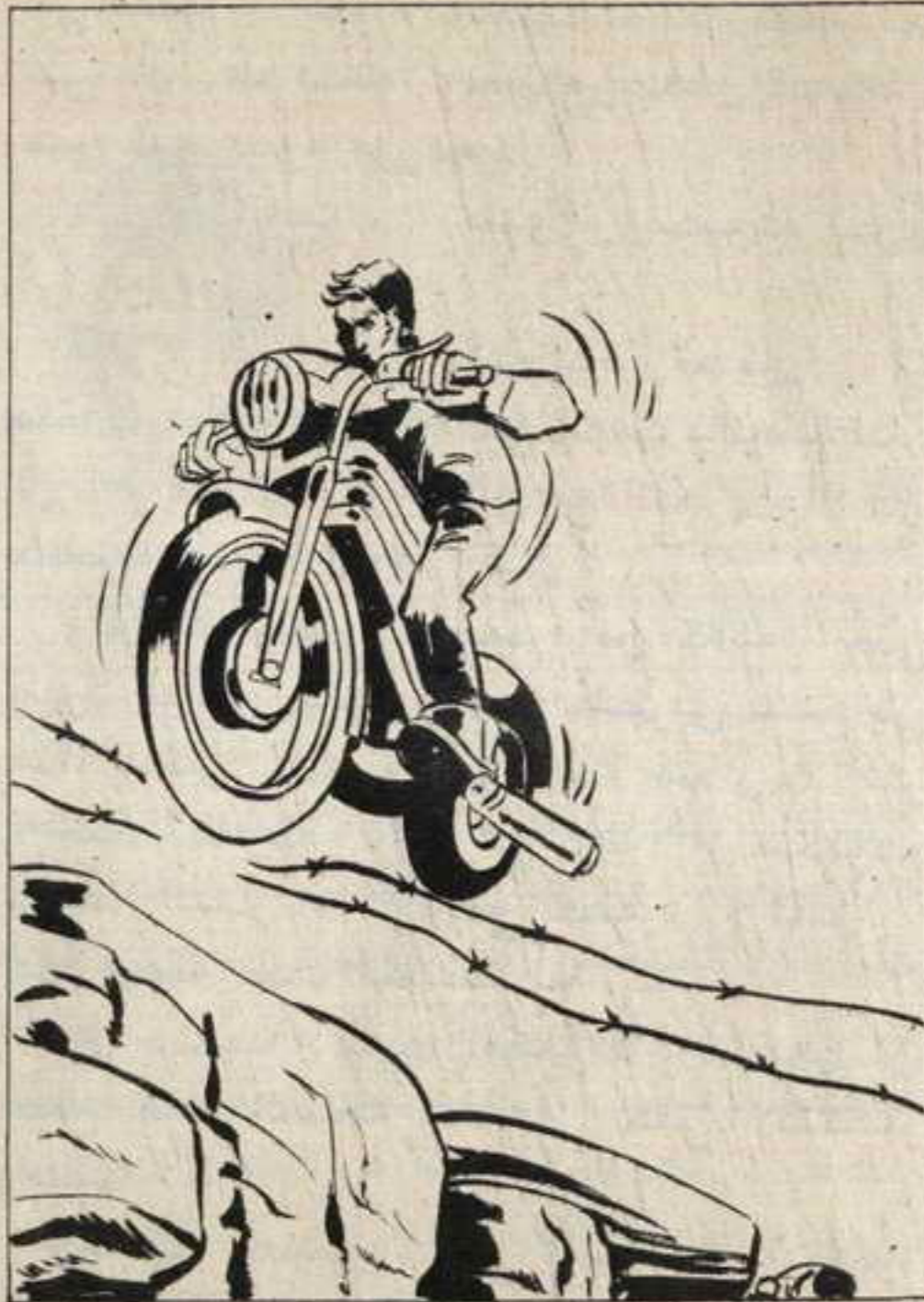
مرت دقائق ، ثم ظهرت الموتوسيكلات في سرعة عالية ، وعندما تقدم اولها اصطدم بالسلك ، فطار في الهواء في الوقت الذي اصطدم به الآخرون .

قال « أحمد » بسرعة : « انها فرصة فلنترك الموتوسيكلات دائرة ، فهي يمكن ان تشغل من ياتي خلفنا ، اذا كان هناك احد » ..