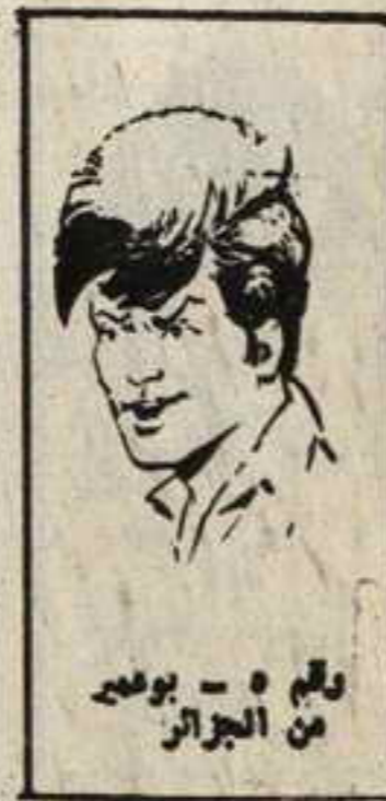
رقم ٥ - بوعصب من الجزائر