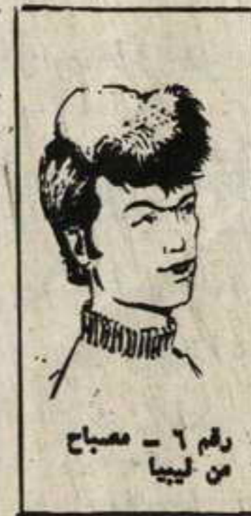
رقم ٦ - مصباح من ليبيا