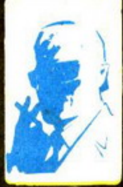
رسم من قبل الطبيب