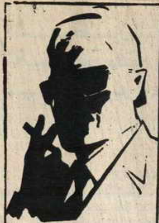
رقم صفر الزعيم الفاضل الذي لا يعرف حقيقته احد ..

انهم ١٣ فتى وفتاة في مثل معرك كل منهم يمثل بلدا عربيا . انهم يقفون في وجه الامارات الموجهة الى الوطن العربي . . . نمرنوا في منطقة الكهف السري التي لا يعرفها احد . . . اجادوا فنون القتال . . . استخدام المسدسات . . . الخناجر . . . الكاراتيه . . . وهم جميعا يجيدون عدة لغات وفي كل مفامرة يشترك نخسة او ستة من الشياطين معا . . . تحت قيادة زعيمهم الفاضل ( رقم صفر ) الذي لم يره احد . . . ولا يعرف حقيقته احد . واحداث مفامراتهم تدور في كل البلاد العربية . . . وستجد نفسك معهم مهما كان بلدك في الوطن العربي الكبير .