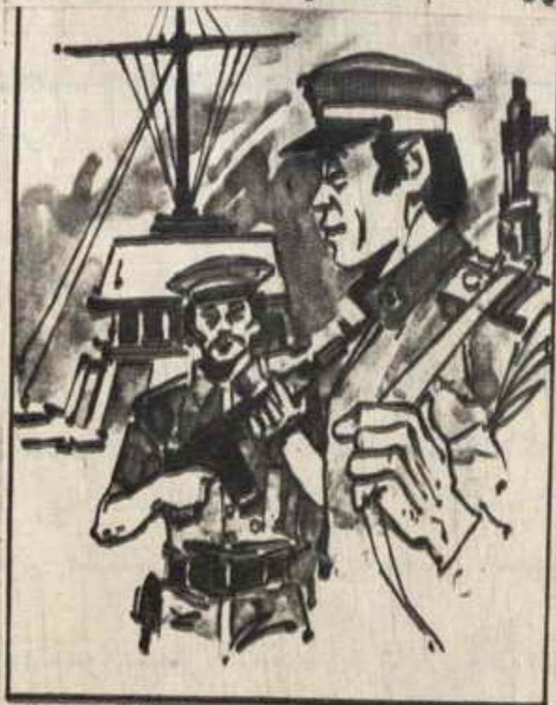
حكى "أوزى" لأحمد ما حدث .. قال : لقد حاول صديقك المقاومة ، لكن المدافع الرشاشة من الزورق المسلح جعلت المقاومة مستحيلة ، كان الزورق حكومي ، وكان رجاله يرتدون الملابس الرسمية .

كان "أوزى" يرتجف من البرد تحت شجرة ، محاوفاً الاحتماء بها من الهواء البارد ، والانظار ولم يكدر يرى "أحمد" حتى قفز من مكانه .. وسلمه "أحمد" الثياب قائلا : "غير ثيابك ، وهيا لتتناول طعام الافطار .."