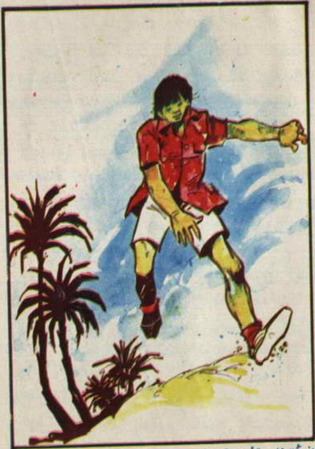
فجأة ظهر "أوزى" الولد الصغير يجرى بين الرمال .

وصاح "أحمد" : "ليو" .. اقترب من العربة !"