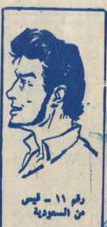
رقم ١١ - ليس من السعودية