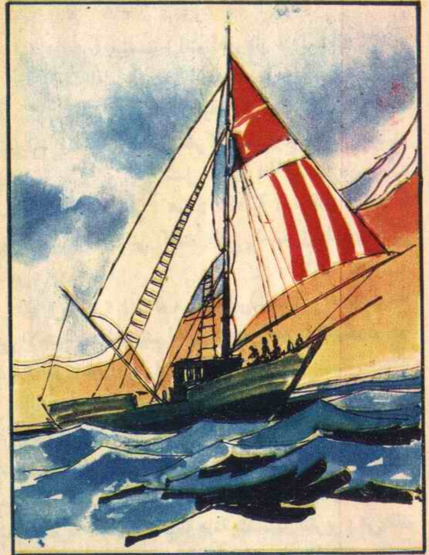
بينما كان الشياطين قد تجمعوا في مؤخرة مركب الصيد ، وهم يلبسون ملابس الصيادين ، كانت أضواء الميناء تلمع متناثرة .

انحرف « فهد » بالسيارة في اتجاه الميناء ، حتى توقف أمام البوابة الحديدية الضخمة . أخرج تصريرا ثم قدمه للحارس ، الذي ابتسم ، وسمح لهم بالمرور . وقبل أن تنقضي نصف ساعة ، كانت هناك مركب صيد ، تخرج من الميناء إلى عرض البحر ، وهي تحمل الشياطين ، ومعهم مجموعة من الصيادين السوريين . كان الوقت آخر النهار ، وكان ضوء النهار ، قد بدأ يتراجع ، ليفسح الطريق أمام ظلمة