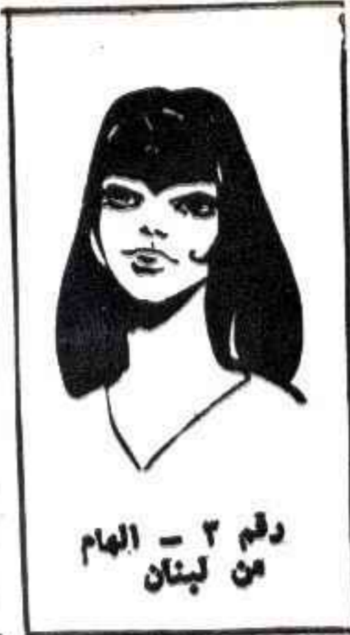
رقم ٣ - الهام من لبنان