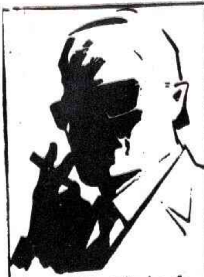
رقم صفر الزعيم الغامض الذي لا يعرف حقيقته احد . .

انهم ١٣ فتى وفتاة في مثل معرك كل منهم يمثل بلدا عربيا . انهم يقفون في وجه المؤامرات الموجهة الى الوطن العربي . . تمرنوا في منطقة الكهف السري التي لا يعرفها احد . . اجادوا فنون القتال .. استخدام المسدسات . . الخناجر . . الكاراتيه . . وهم جميعا يجيدون عدة لغات وفي كل مغامرة يشترك خمسة او ستة من الشياطين معا . . تحت قيادة زعيمهم الغامض ( رقم صفر ) الذي لم يره احد . . ولا يعرف حقيقته احد . واحداث مغامراتهم تدور في كل البلاد العربية . . وستجد نفسك معهم مهما كان بلدك في الوطن العربي الكبير .