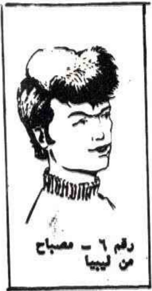
رقم ٦ - مصباح من ليبيا