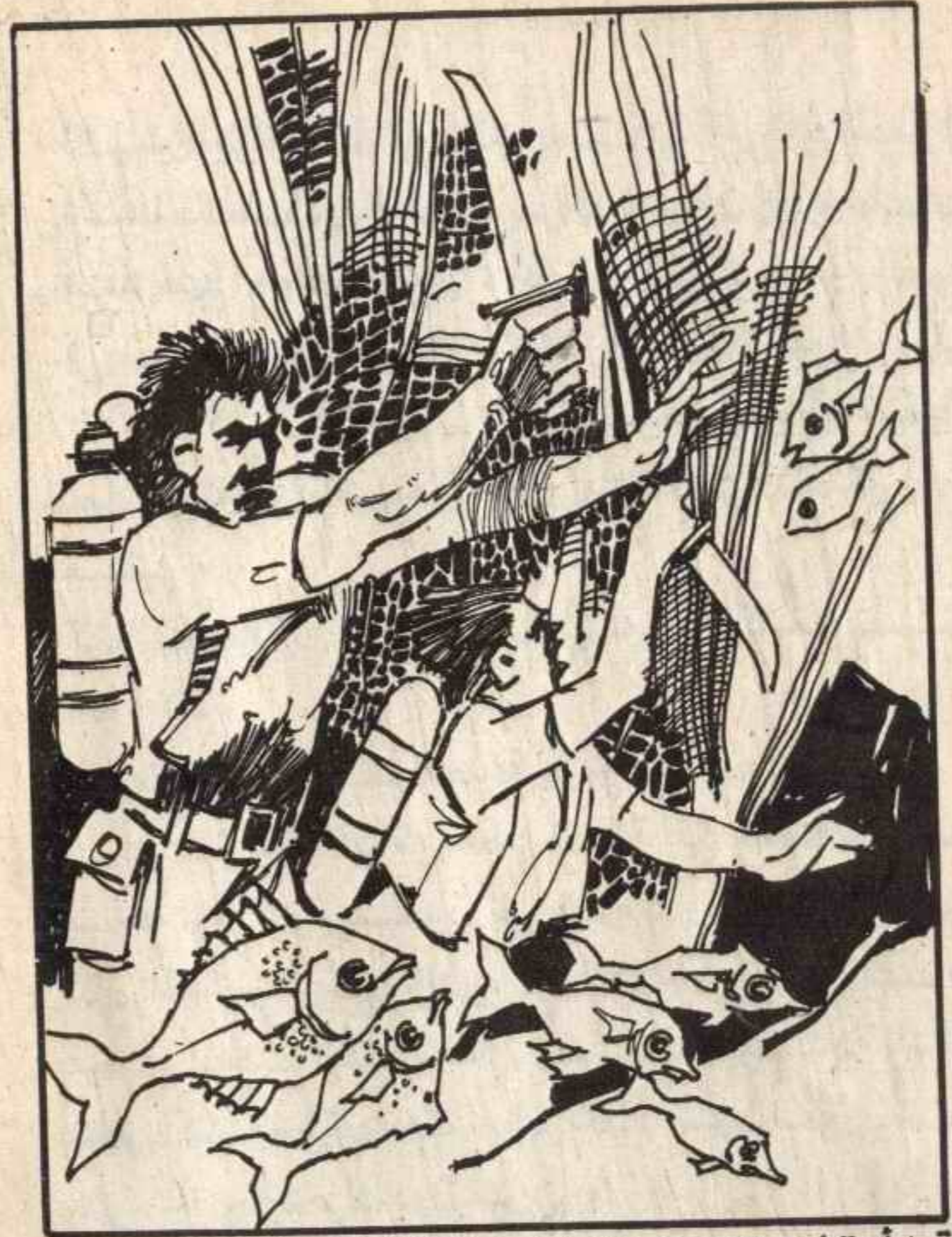
قبل أن تطبق الشبكة بكاملها على "خالد" و"فهد"، كانت خناجرهم الجادة تمر في الخيوط ، كما يمر السكين في العجين .

وكان رد « أحمد » : إحذر ، لعله شرك خداعي ! لكن الدقائق التي وصل فيها رد « أحمد » إلى « فهد » كانت كافية ، ليقع « فهد » في الشرك . فقد جذب الحبل الذي اهتز بقوة . وفجأة ، كانت شبكة تدور حول الشياطين . كانوا يرونها ، وهي تقترب منهم . ولم يكن أمامهم أي تصرف آخر ، سوى التعامل معها . كانت خيوط الشبكة من المواد الصناعية الطرية ، والقوية في نفس الوقت . لمس « أحمد » يد « خالد » وتحدث إليه : استخدموا الخناجر .