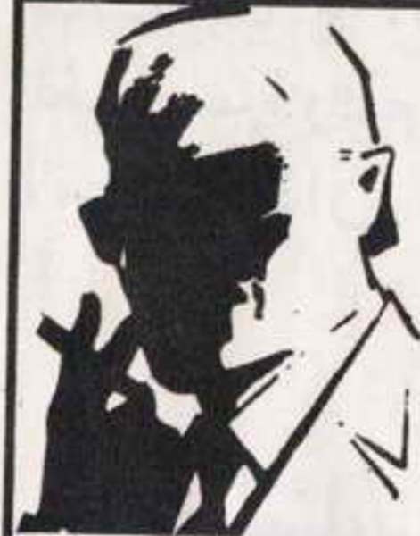
رقم ١ - صفر، الزعيم الغامض الذي لا يعرف حقيقته احد ..