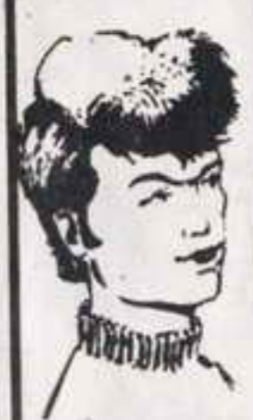
رقم ٦ - مصباح من ليبيا