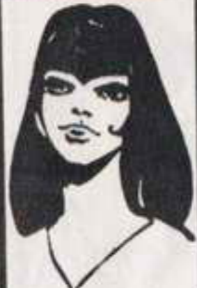
رقم ٣ - الهام من لبنان