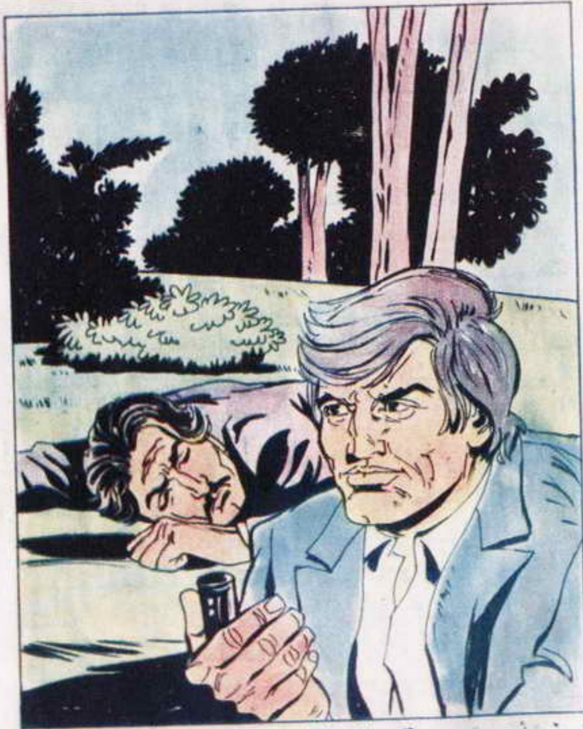
زحف أحمد بسرعة حتى اقترب منهما، وأمسك بعلبة الفيلم.

تقدم الشياطين بسرعة وكان الرجال الأربعة، يتقدمون في هدوء. تجاوزهم الشياطين، وأصبحوا يقطعون الطريق مختلفين وسط النباتات المرتفعة. كانوا قد تجمعوا في مجموعتين على جانبي الطريق. وأرسل أحمد، رسالة: الهجوم عند الإشارة!