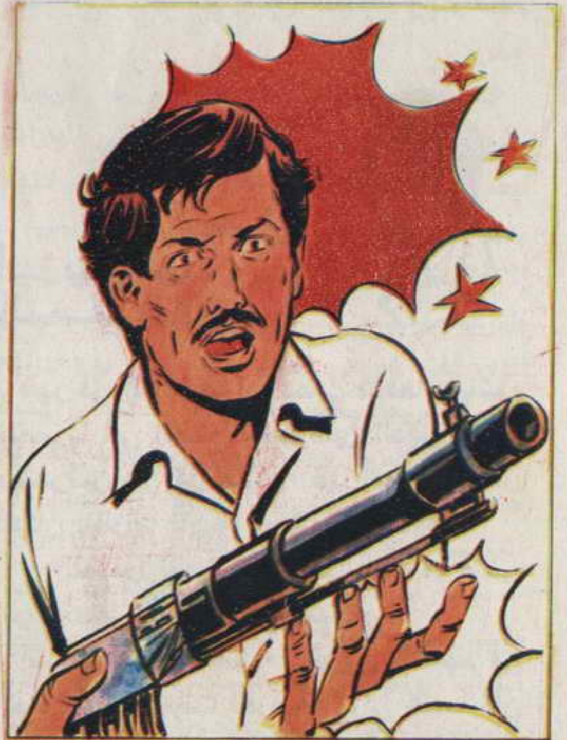
ظهر في الباب «بوار» يحمل مدفعاً رشاشاً، مصوباً في اتجاه الشياطين.

إلا أن جرس التليفون دق فنظر الشياطين إلى بعضهم، وتقدم «فهد» فتحدث في التليفون، وما أن سمع الصوت حتى نظر إلى «أحمد»، وتحدث إليه بلغة الشياطين.. تقدم «أحمد»