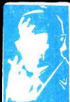
رقم صغر الزعيم العاصم الذي لا يعرف حقيقته احد