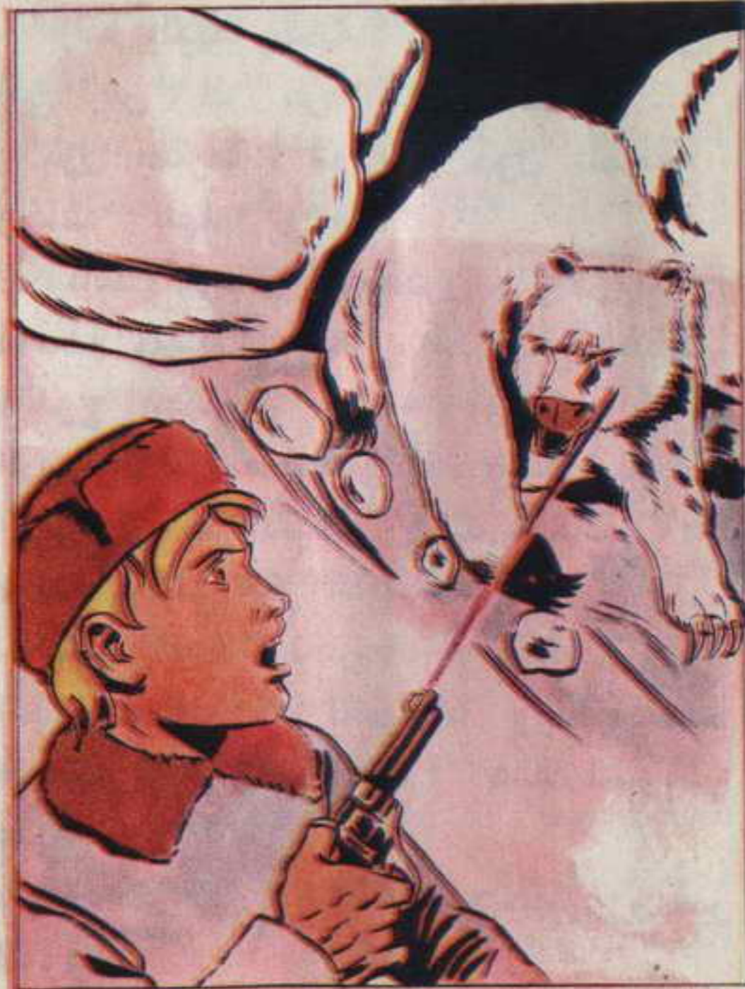
أخرج فهذا مسدسه ثم أطلق إبرة مخدرة في اتجاه الدب .

و"إلهام" ، واتجه "رشيد" و"قيس" إلى اليسار .. كانت المجموعتان تدوران حول المرتفع الثلجي ، إختفت كل مجموعة عن الأخرى وأخرج "أحمد" خنجره ثم غرزه في الثلج ، وبدأ يصعد المرتفع في هدوء ، وبواسطة الاشارات ، قال لـ "فهد" و"إلهام" : "انتظرا أسفل ولا تتحركا ، إلا إذا دعت الحاجة" .. وظل يصعد المرتفع ، حتى أصبح عند قمته ، فرأى الرجال الثمانية يتحركون من مكانهم أسفل الجبل الثلجي . وكان اتجاههم ناحية المجموعة الأخرى التي تضم "رشيد" و"قيس" ، فأرسل إليهما رسالة عاجلة ، "من" ش . ك . س" إلى "ش . ك . س" الرجال يتجهون إليكما .