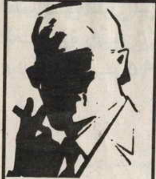
رقم . صفر، الزعيم الغامض الذي لا يعرف حقيقته احد ..