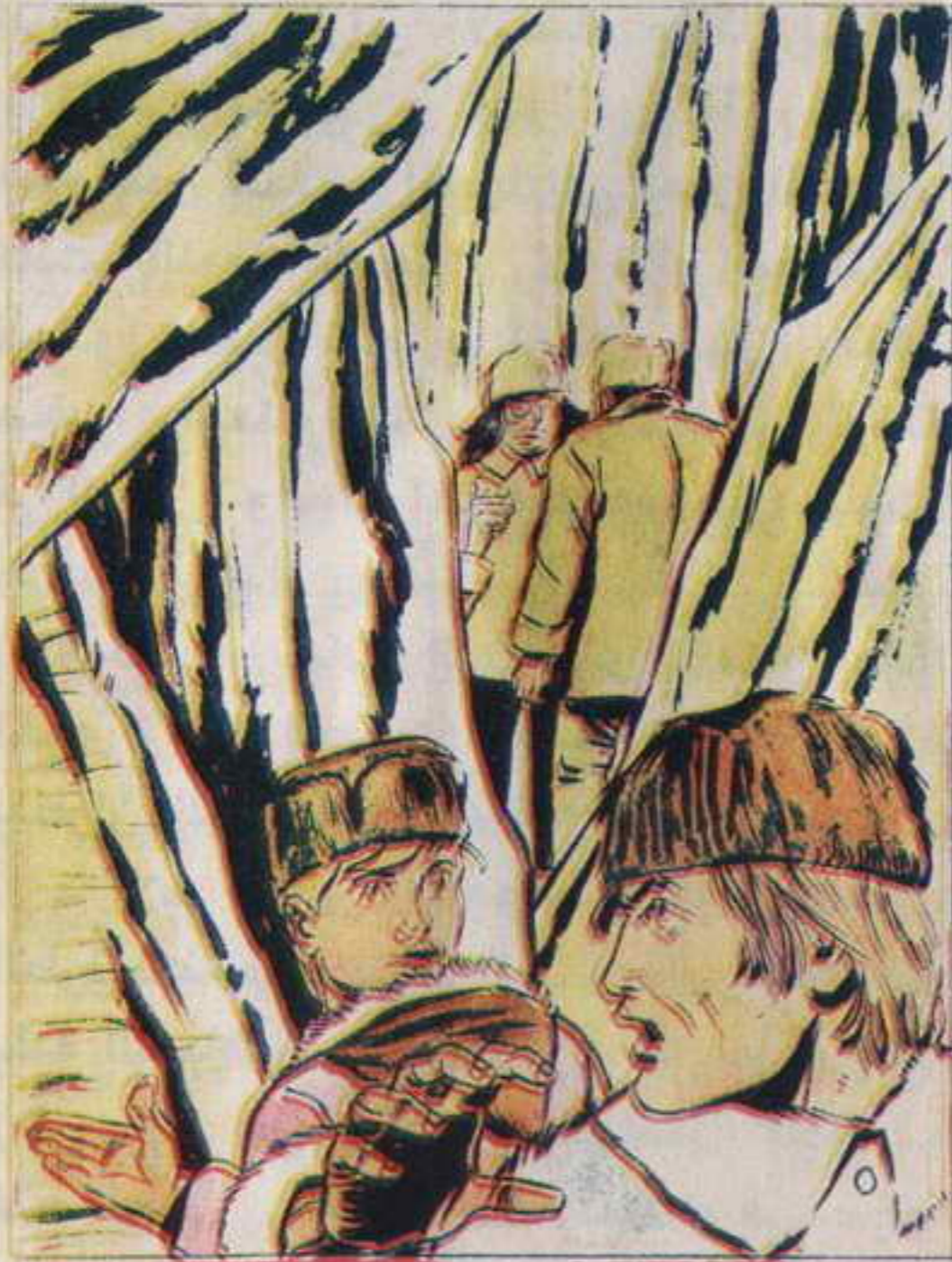
انضم كونيخ إلى «ماريوتي» .. كانا يقفان على بعد خمسين متراً من البحر

(هـ) هل تسمعني ؟ أجب " . لحظة ثم سمع رسالة من المجموعة (هـ) إلى قيادة "النجوم العشرة" .. من المجموعة (هـ) إلى القيادة .. نعم أسمعك : ردت القيادة : "من القيادة إلى (هـ) إتجه إلى المجموعة (ب) " .