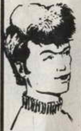
رقم ٦ - مصباح من ليبيا