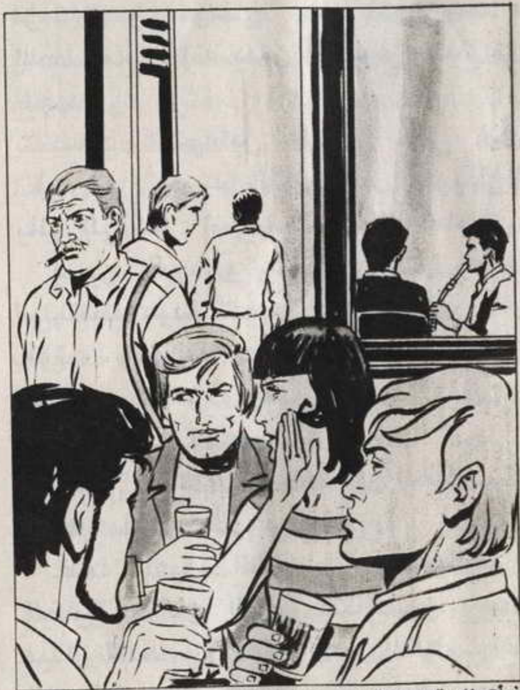
فجأة - ظهرت الدهشة على وجه "إلهام" وقالت بصوت هامس: أنظروا، إن هذا الرجل يشبه "كونباخ" ..

إلتفت الشياطين إلى نفس الاتجاه الذي كانت تنظر إليه "إلهام" ، إلا "أحمد" الذي كان مستغرقا تماما في خواطره ، فمد "قيس" يده ثم هز "أحمد" في هدوء . نظر إليه "أحمد" فوجد الشياطين جميعا ينظرون في إتجاه واحد ، ونظر في نفس الاتجاه ، ثم علت الدهشة وجهه ، وهمس : - "هل يمكن أن يكون هو" ؟