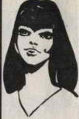
رقم ٣ - الهام من لبنان