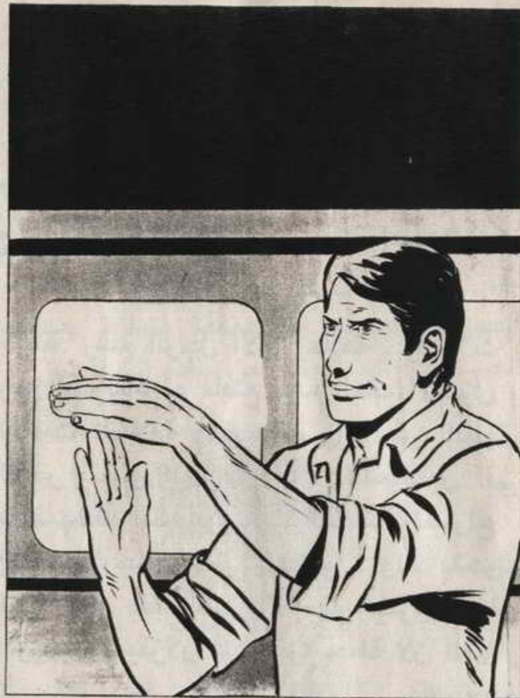
لقد رسم الرجل الأول علامة حرف "T" رفعا كفه يده ثم قاطع معه الكف الأخرى ، فجاءت العلامة واضحة .

سرعة وعندما بدأ القطار يهدىء السرعة ، استعدوا سريعا حتى يكونوا على رصيف المحطة قبل أن ينزل الرجلان . وعندما توقف القطار أسرعوا بالنزول وتجمعوا تحت المظلة الحديدية العريضة إتقاء للمطر ، الذى كان ينزل بشدة تتخلله حبات كبيرة من الثلج ، يرن صوتها فوق أرض المحطة ، وفوق المظلة الحديدية . ورغم أن القطار أبطل الماكينة ، ورغم أن الركاب القليين الذين كانوا فيه قد نزلوا منه ، إلا أن الرجلين لم يظهر . طال إنتظار الشياطين للرجلين إلا أن أحدا منهما لم يظهر ، فنظرت "إلهام" إلى "أحمد" فى دهشة وقالت : "لا أظن أن القطار قد توقف فى الطريق ، ولم يهدىء حتى من سرعته" !.. هز "أحمد" رأسه ثم قال : "من الضرورى أن نتوقع كل شيء" ! تحرك الشياطين إلى موظف المحطة