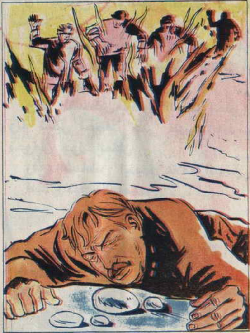
وظهرت كتلة سوداء، مشتعلة.. قال أحمد: إنه مقر النجوم العشرة وتقدموا في ببطء، قرأوا "كونباخ" ملقى على الأرض في حالة إغماء.

يجهزون مجموعة أخرى ومع إنتهاء العد ألقوا القنابل . لحظة ، ثم سمع دوى هائل ، فألقوا أنفسهم في النهر الذي كان مندفاعا في سرعة رهيبية ، فنقلهم التيار بعيدا .. غير أنهم بعد لحظة أستخدموا خناجرهم ، وبدأوا يصلون إلى ضفة النهر ، حتى خرجوا منه ووقفوا ينظرون في إتجاه الجبل . لقد إختفى تماما ، وظهرت كتلة سوداء ، مشتعلة .. قال " أحمد " : " إنه مقر " النجوم العشرة " وتقدموا في ببطء فأروا " كونباخ " ملقى على الأرض في حالة إغماء ، وأبصروا مجموعات من الرجال تخرج مشتعلة من الجبل ، الذي ذاب . كان المنظر غريبا تماما .. كانت عبارة عن كتلة سوداء مستقلة ، وسط الثلوج البيضاء . أرسل " أحمد " رسالة إلى رقم " صفر " : " من ( ش . ك . س ) إلى رقم " صفر " . لقد تمت المهمة ، تحت أيدينا