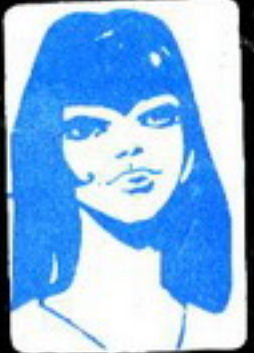
رفد صفر الزعيم العاصم الذي لا يعرف حقيقته أحد