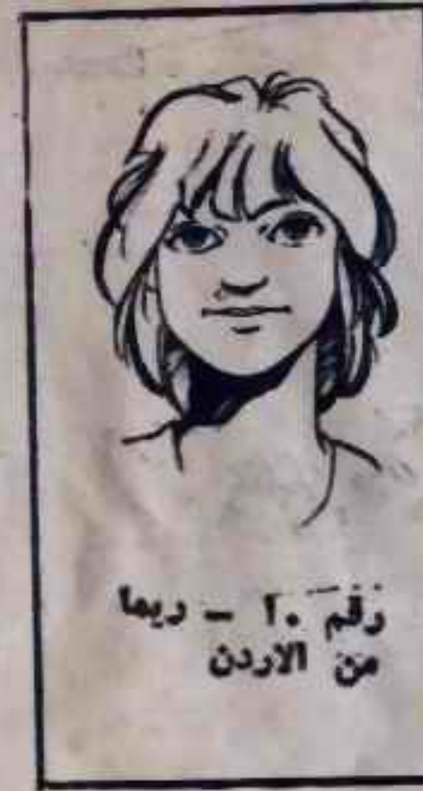
رقم ٢٠ - ريم من الاردن

كان قرار طرد « أحمد » من مجموعة الشياطين ال ١٣ قد صدر في الصباح ، ففي الاجتماع الصباحي في « المقر السري » - الواقع في مكان ما من الصحراء - سمع الشياطين ال ١٣ صوت رقم ( صفر ) وهو يعلن القرار في هدوء ... كانت صدمة لا مثيل لها ، لكن لم يكن من حق الشياطين معرفة أسباب قرارات رقم ( صفر ) ، فان النظام الذي تدربوا عليه منذ انضموا جميعا الى المجموعة هو تنفيذ التعليمات حرفيا « حتى ولو كانت تعني الموت » ! ولكن طرد « أحمد » - كما فكر الشياطين جميعا - كان شيئا أقسى من الموت .. كانوا جميعا يحبونه ، فقد كان دائما نموذجا ممتازا للمغامر الذكي الجريء ذي القلب