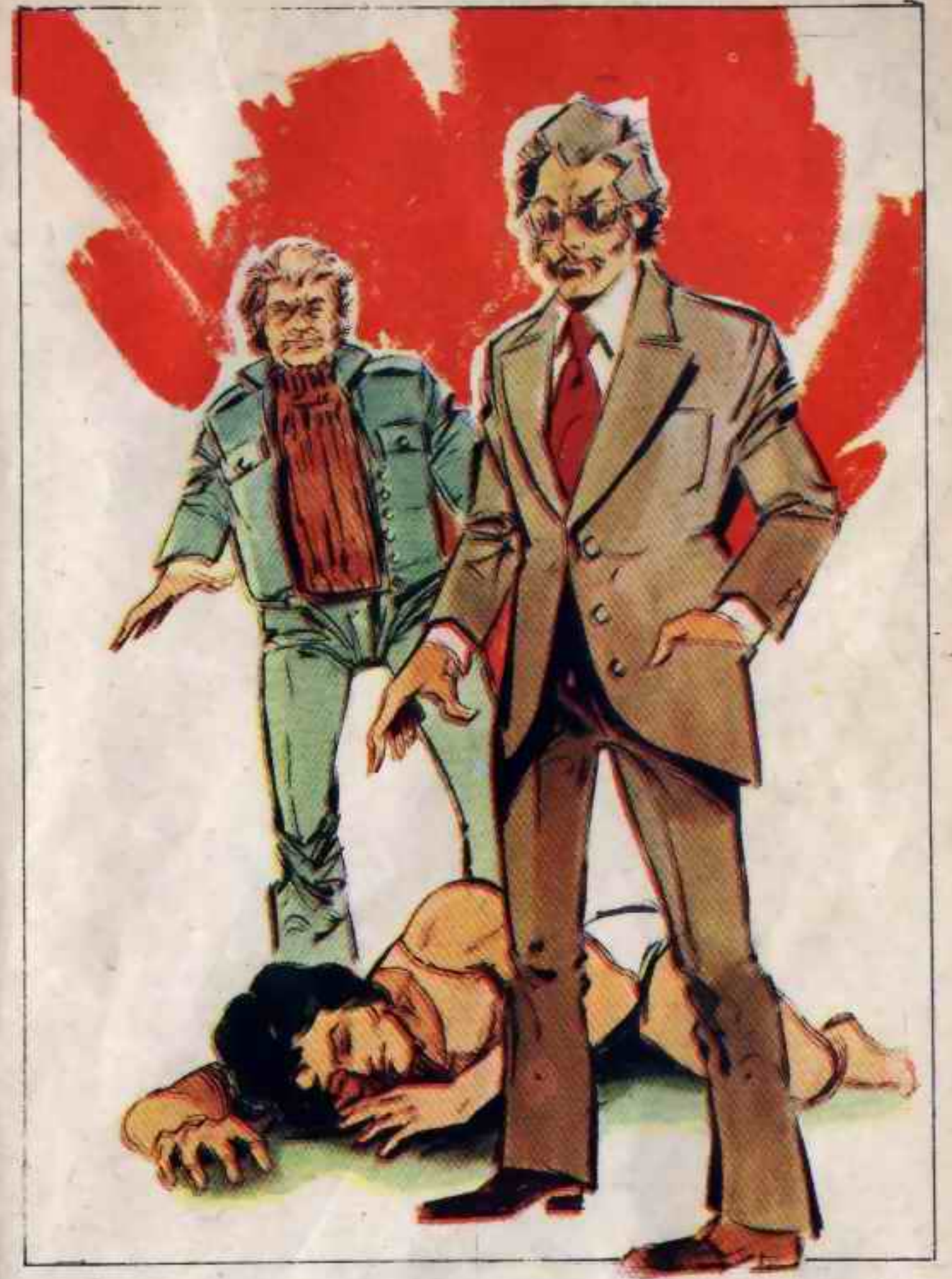
سمع أحمد صوت الزعيم وصوت « كرادوك » فتظاهر بأنه مغمى عليه

انتهى من تناول الساندوتش ، ثم تلفت حوله للمرة الأخيرة ، وترك السيارة مكانها ، فقد كان قريبا من العمارة