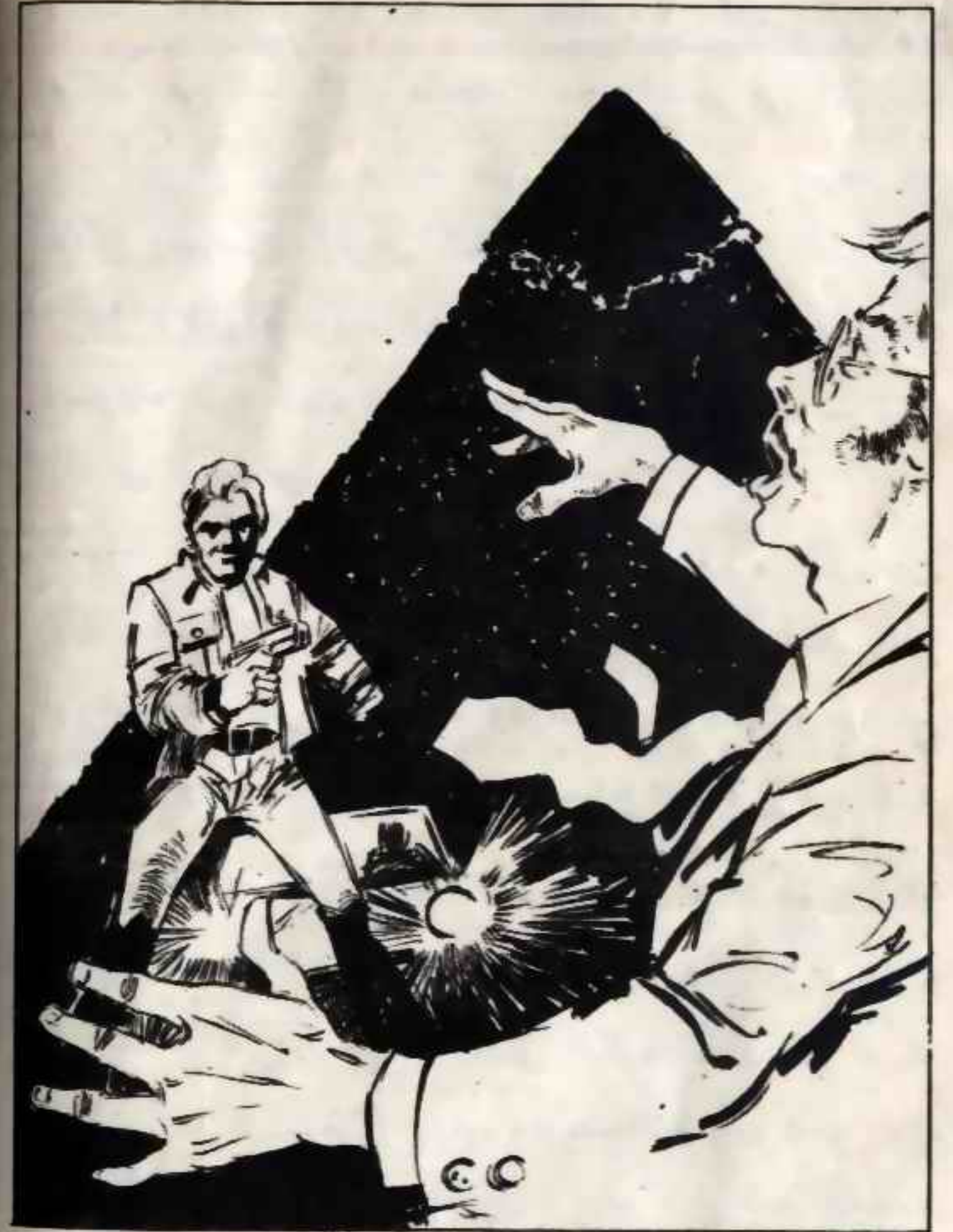
.. اطلق احمد رصاصة بين قدمي الرجل

جلس « أحمد » ، وفتح الزعيم الحقيبة مسرعا ، وبدأ يخرج ما بها من أوراق ، وقال من بين أسنانه يسأل