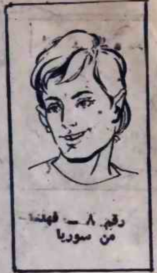
رقم ٨ - فهما من سوريا