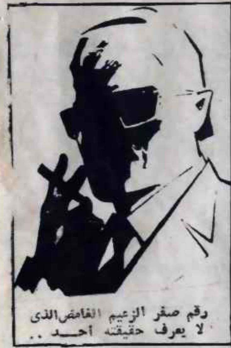
رقم صفر الزعيم الغامض الذي لا يعرف حقيقته احد ..