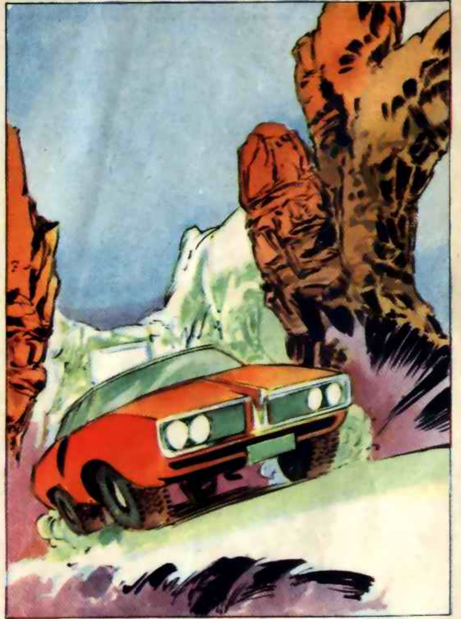
دار « كرادوك » حول الهرم الأكبر ووقف بالسيارة بجوار صخرة