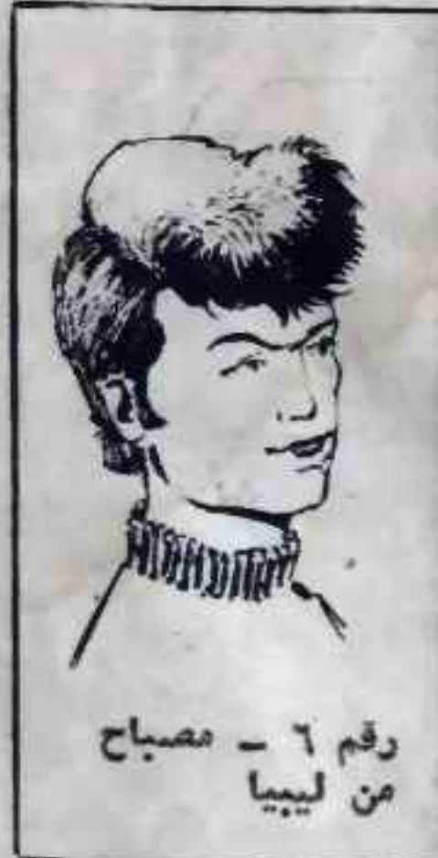
رقم ٦ - مصباح من ليبيا