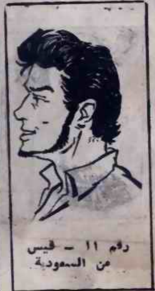
رقم ١١ - فاحيس من السعودية