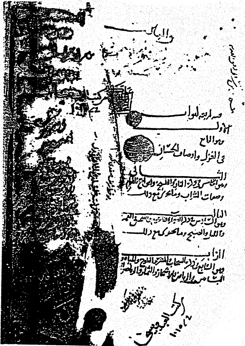
ظهيرة نسخة عاطف أفندي (ع)