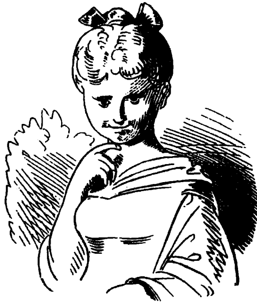
جمال بلا عظام

فهوت الأخيرة على الأرض ساقطة على ردفها، ومن ثم برمي قطعة من الجبن على حين غرة عرض الحائط من فوق رؤوس الحاضرين، ليغادر بعدها دون رجعة لشدة خجله من نفسه. وعلى مثل هذه الأحاسيس المحطمة تجيب ألوان الموت التي يجدها لشخصياته. إذ لا يكفيه أن يودي بحياة شخصياته، بل ويذهب إلى أبعد من ذلك ليمحو ما يمكن التعرف عليه من صورتهم عن وجه البسيطة، فتعرك هذه بحجار رحي من غضب ساخط كماكس وموريتس، وترق صفائحا كغلمان كورينث الأشقياء، وتحرق لتتحول إلى رماد مثل هيلينه التقية، وتحول إلى أشكال جليدية مسننة ليذيبها بعد ذلك دونما شكل محدد مثل Der Eispeter (بيتر الجليد). وهذا ما يميز بوش جوهريا عن الرسوم المتحركة، التي يعتبر هو جدّها الأعلى بلا مرء فحين يسقط سندان على رأس القيوط كارل، نراه قد عاد ليظهر متعافيا في الصورة القادمة على الرغم من وجود بعض اللصقات الطيبة على جسمه. أما لدى بوش فيبقى الأموات أمواتا. فالموت عند بوش يشكل حد اختبار المضحك الذي يعمل بكل حزم من أجل التوصل إليه.