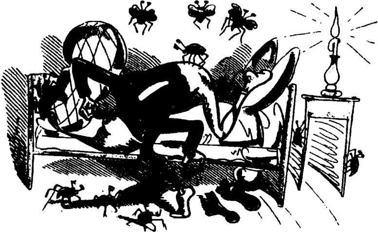
العم فريتس والخنافس

البالغة في يومنا هذا، بكعب العم وبطن ساقه كراس وعنق مخلوق عجيب - دون أن يجد في ذلك ما يثير الجدل.