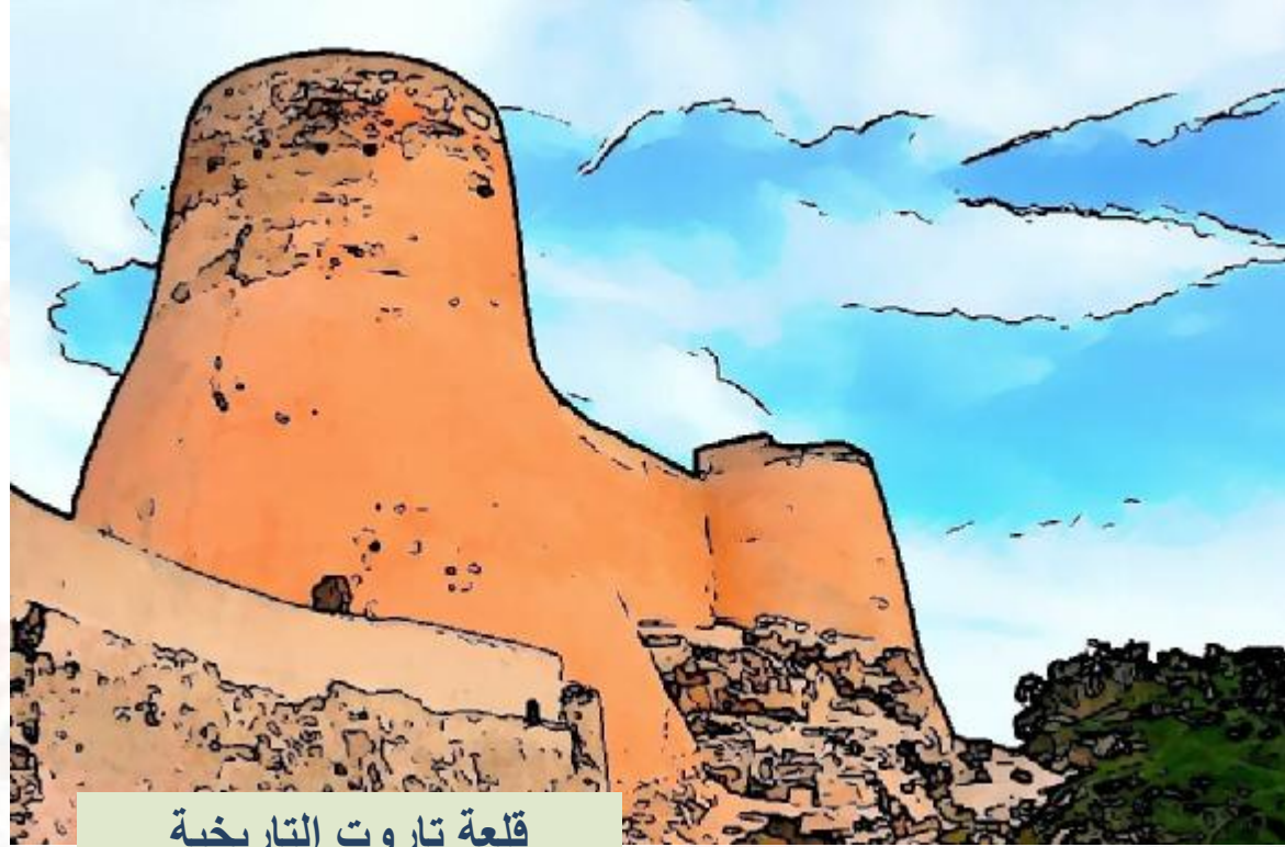
قلعة تاروت التاريخية

:: مدونة هندسة الإطفاء والسلامة:: نحو مجتمع واعي للمخاطر المحيطة