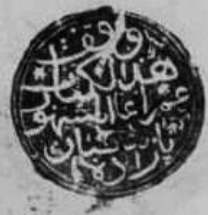
( خاتمة نسخة «بايزيد» )

كتبه عبد الكريم بن محمد بن علي بن ابراهيم بن محمد بن محمد بن