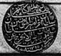
( خاتمة نسخة «مهر شاه» )

وَصَلَّى اللهُ عَلَى سَيِّدِنَا مُحَمَّدٍ وَآلِهِ وَصَحْبِهِ وَسَلَّمَ هـ