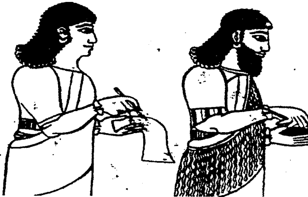
الرسم الجداري للكاتبين الآشوري والآرامي في تل بارسيب

وهكذا بدأ استخدام اللغة الآرامية في بلاد آشور فصار للحكام الآشوريين كتاب آراميون إلى جانب الكتبة الآشوريين، وهذا ما نجده على عدة آثار مرسومة من أصل آشوري، ومن هذه الرسوم الرسم الجداري الذي عثر عليه في قصر تل بارسيب والذي يعود لزمن الملك تجلات فلاسر الثالث حيث يظهر فيه كاتبان أحدهما يكتب على ورقة بردي أو قطعة من الجلد والآخر على رقيم طيني ، فالأول كان يكتب باللغة الآرامية والآخر يدون بالخط المسماري ٧ .