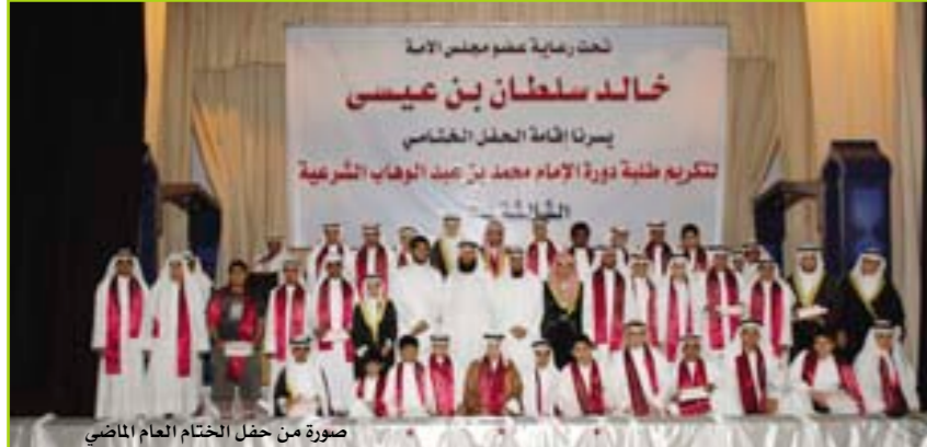
صورة من حفل الختام العام الماضي

● حرصت إدارة الدورة على أن تختار الكفاءات من المدرسين، فلدينا مجموعة من الأساتذة من كلية الشريعة بالكويت، وخريجون من الكلية نفسها وكذلك بعض طلبة العلم المتميزون في مجال العلم