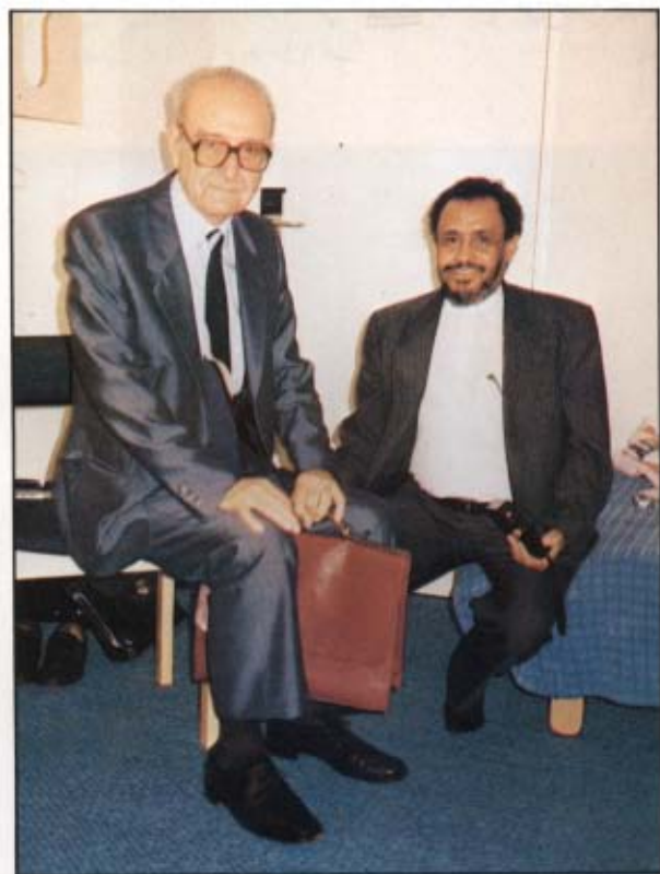
[٢٠] مع البروفيسور الفرنسي «رجاء جارودي» . باريس: ١٤٠٨ / ١ / ٢٣ هـ.