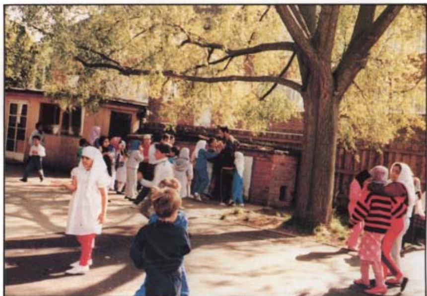
[١٨] تلاميذ مدرسة الأخ «يوسف إسلام» الإسلامية. لندن: ١٤٠٨ / ١ / ١٧ هـ.