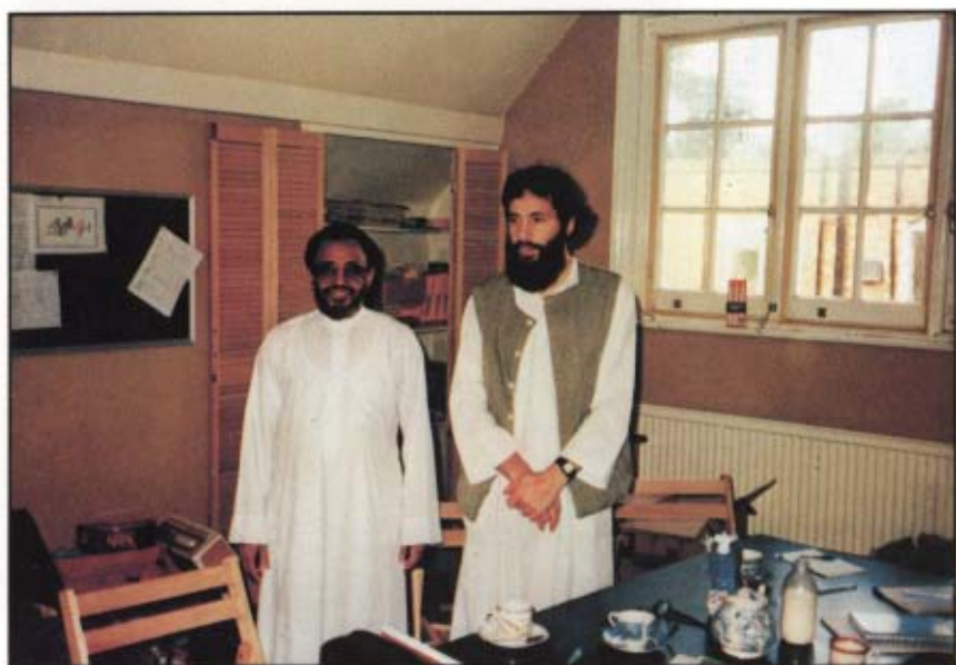
[١٧] مع الأخ المسلم البريطاني «يوسف إسلام» في مدرسته الإسلامية. لندن: ١٤٠٨ / ١ / ١٧ هـ.