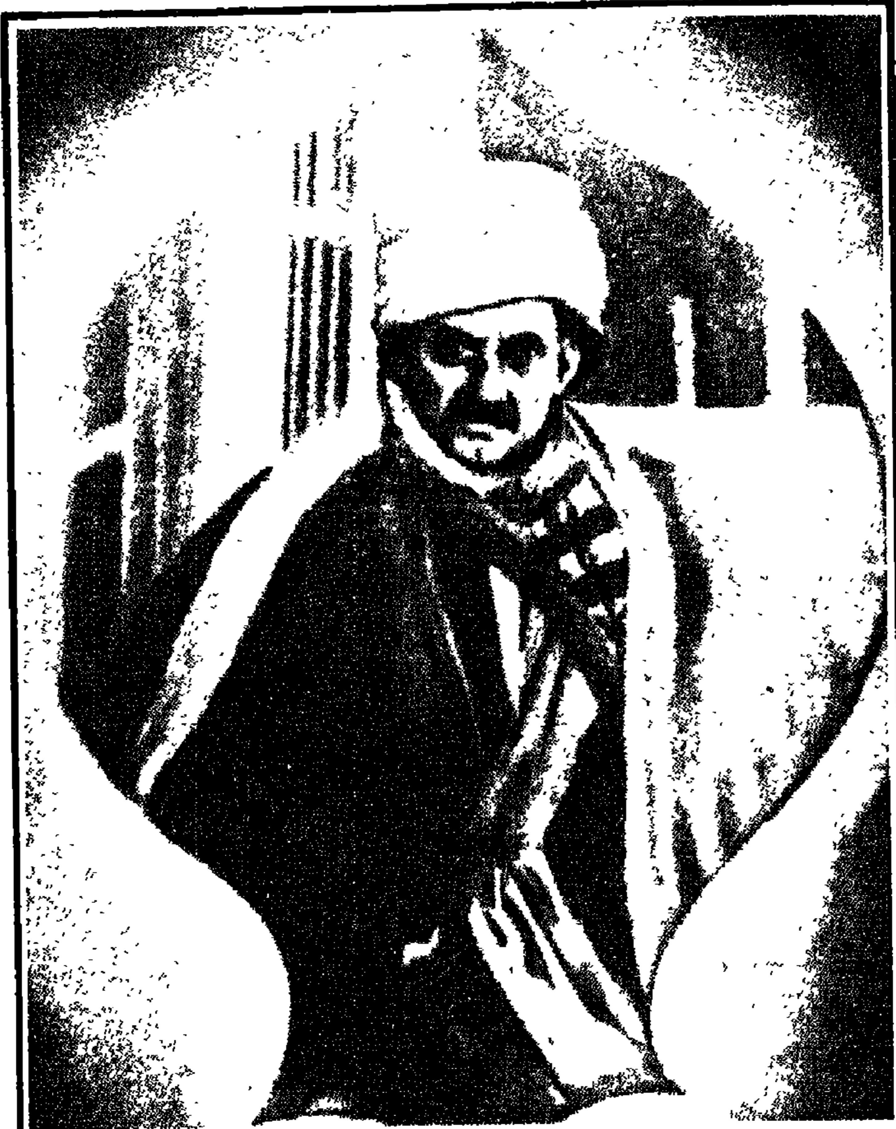
الإمام بديع الزمان سعيد النورسي في منفاه الأول عام (١٩٢٦ م) بقرية ( بارلا ) التي ألف فيها ثلاثة أرباع رسائله المسماة برسائل النور . . .