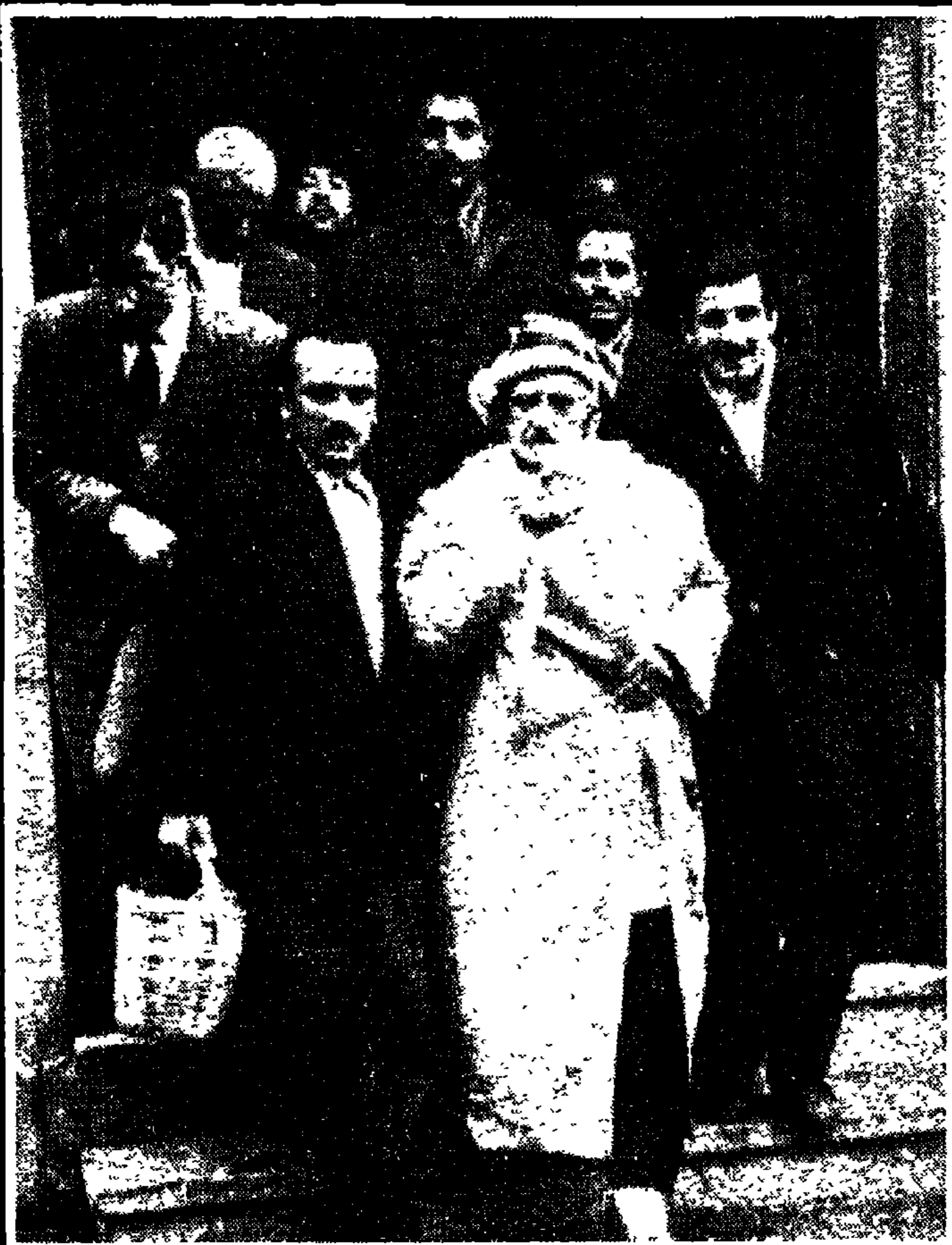
الإمام بديع الزمان سعيد النورسي، إذ ينزل من مدارج الفندق بأنقره ، مع بعض تلاميذه وأصدقائه ، عام ( ١٩٥٩ ) م . . .