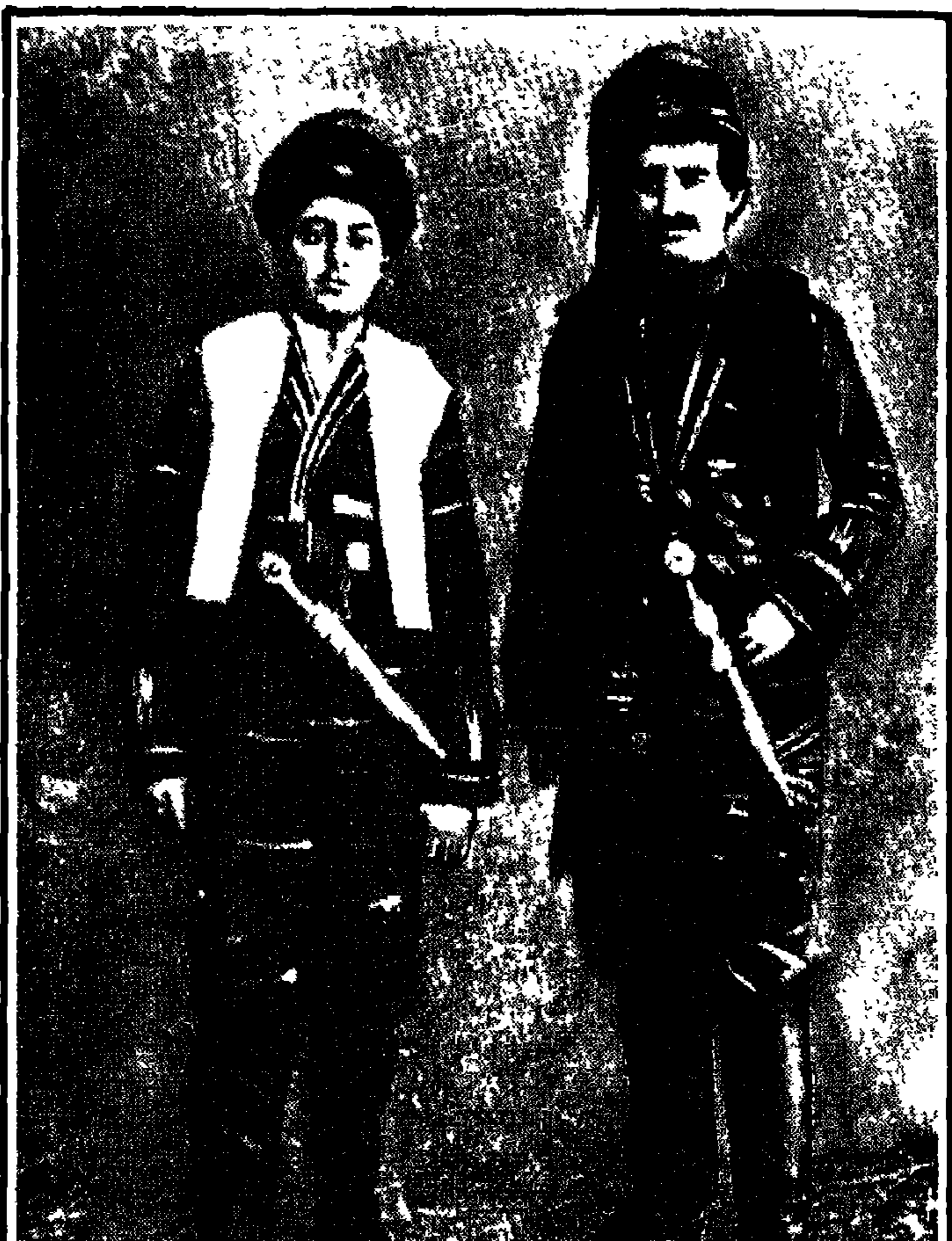
الإمام بديع الزمان سعيد النورسي في أواسط عمره ، ومعه ابن أخيه عبد الرحمن بزيها الوطني ، في إستانبول بعد الحرب العالمية الأولى . . .