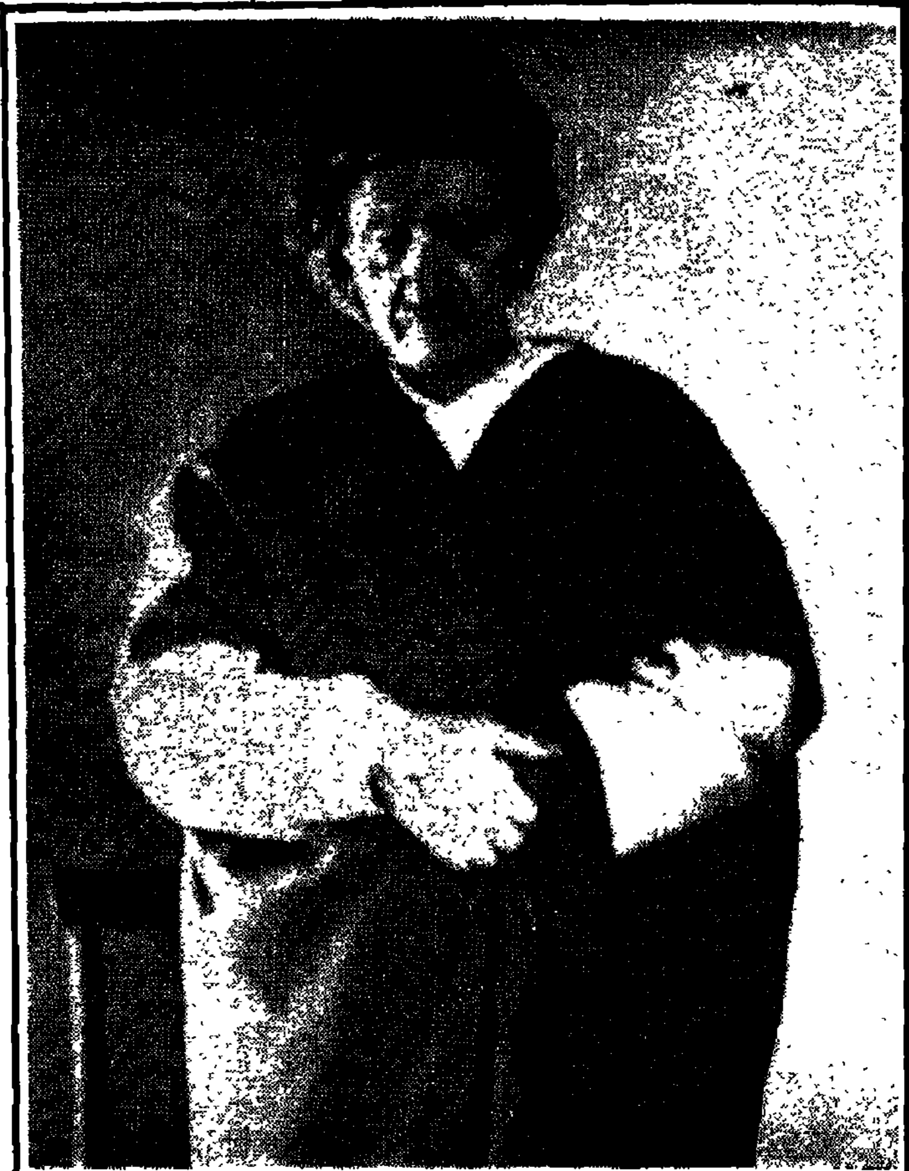
الإمام بديع الزمان سعيد النورسي رضي الله ، في سجن مدينة (آفيون) عام (١٩٤٧ م)...