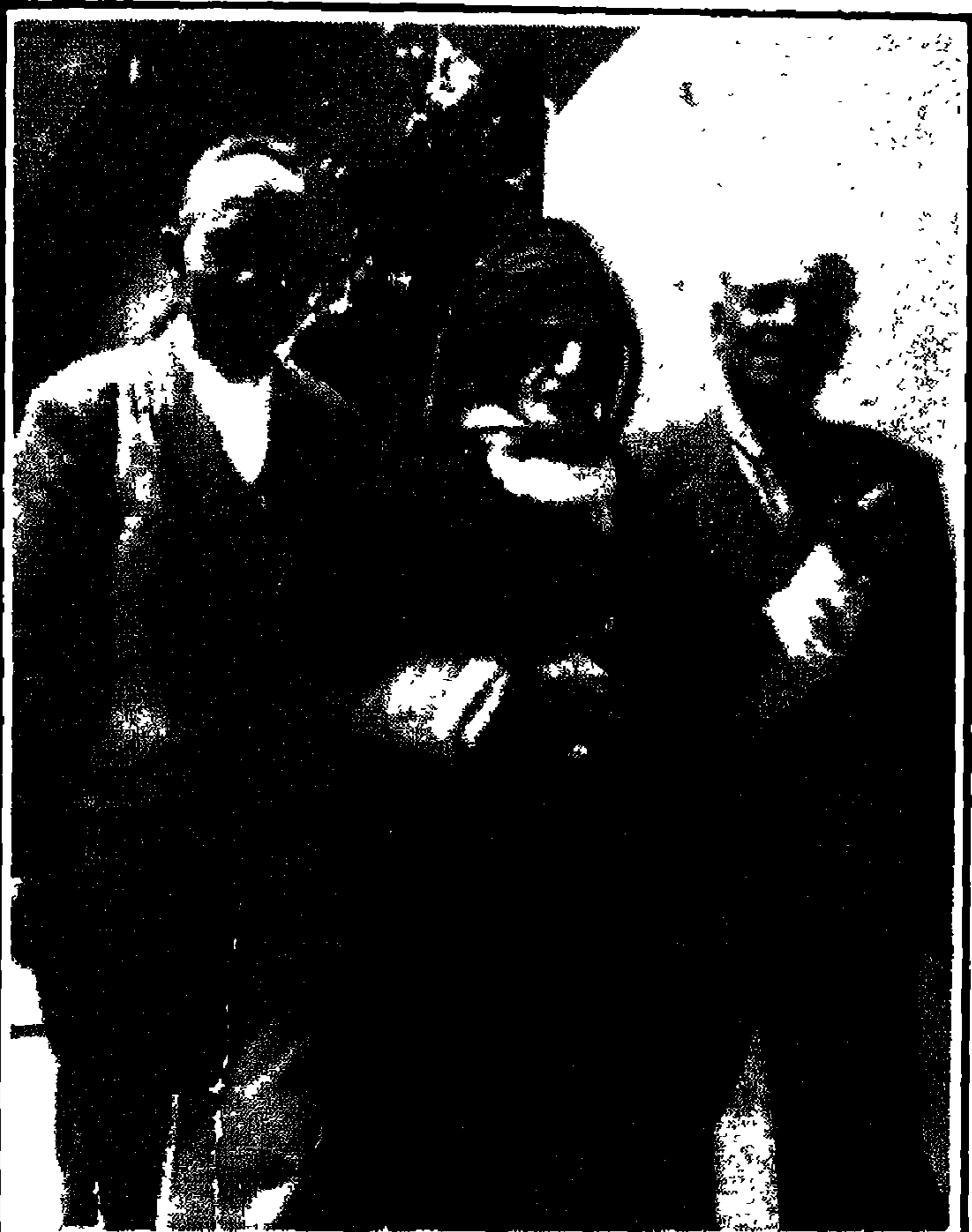
الإمام بديع الزمان سعيد النورسي معه طائفة من تلاميذ رسائل النور، يأتون من سجن ( آفيون ) إلى محكمتها في فترة استبداد الحزب الجمهوري، عام ( ١٩٤٧ ) م. . .