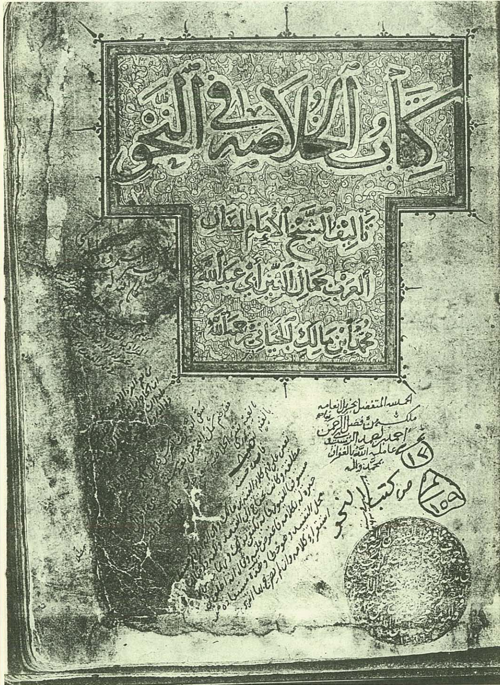
صورة لغلاف نسخة (ب)