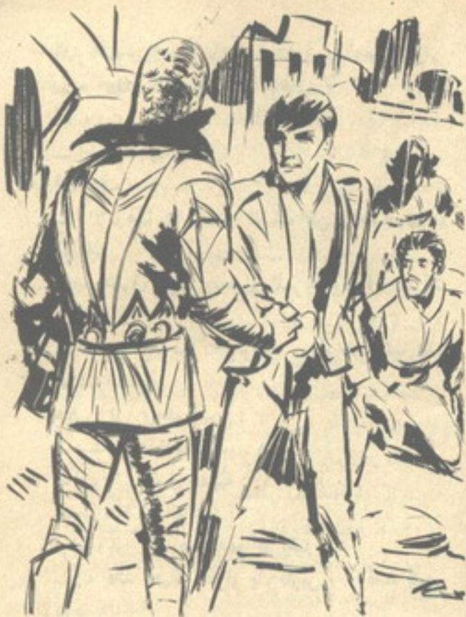
تابع بصره (نور)، وهو يندفع نحو المخلوق غير الآدمي، ويصافحه في حرارة

الفضائي الخفيف ، حتى أنه قد أصيب بذهول شديد ، عندما تهللت أسارير ( نور ) ، وهو يتف : — أنت !؟ .. يا لها من مفاجأة ! لم يتسم المخلوق الفضائي .. لم يبد عليه حتى أنه قد سمع عبارة ( نور ) ، بلولا أن قال في صوت جاف ، وبلغة لم يفهم منها ( فارس ) حرفاً واحداً : — إنها مفاجأة لي أن أجدك حيّاً . اجتم ( نور ) ، وهو يقول في حماس : — وأنا أيضاً . التفت ( فارس ) إلى ( سلوى ) ، يسألها في جدّة : — من هذا ؟ أجابه في صوت يشف عن الارتياح : — صديق .. تمم في عصبية : — هذا في حد ذاته يجعلني متوتراً . تابع بصره ( نور ) ، وهو يندفع نحو المخلوق غير الآدمي ، ويصافحه في حرارة ، قائلاً بلغة عجيبة : — مرحباً بك في كوكبنا هذه المرة .