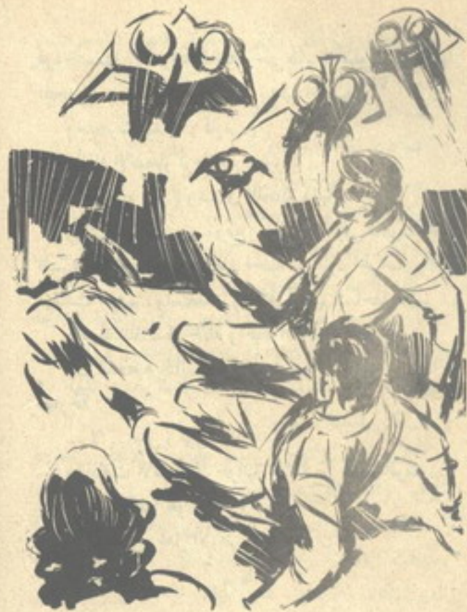
وأدرك الثلاثة في لحظة واحدة أن النهاية محتومة .