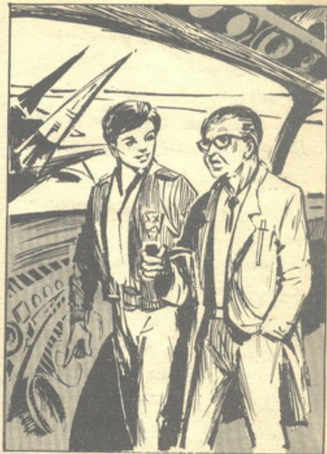
كان ( نور ) يسير في أروقة القاعدة الفضائية بجوار الدكتور ( سامي ) ..

أجاب الدكتور ( سامي ) : — بالطبع .. ولكنه لم يتردد في العمل من أجل وطنه حينما دعت الحاجة . استقبلهما الدكتور ( منير ) بحفاوة ، وقال لـ ( نور ) :