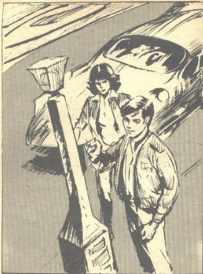
ضحك (نور) وهو يخرج كارثا صغيرا ويدنسه في ثقب صغير في العمود ..