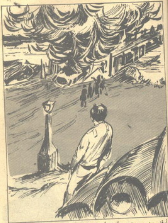
أوقف ( نور ) سيارته ، وأخذ يتأمل النيران المشتعلة ورجال الإنقاذ وهم يهرعون

العربة المتفجرة .. أوقف ( نور ) سيارته ، وأخذ يتأمل النيران المشتعلة ورجال الإنقاذ وهم يهرعون إلى مكان السيارة المخطئة ، في محاولة يائسة لإيقاف النيران .. وحدث ( نور ) نفسه :