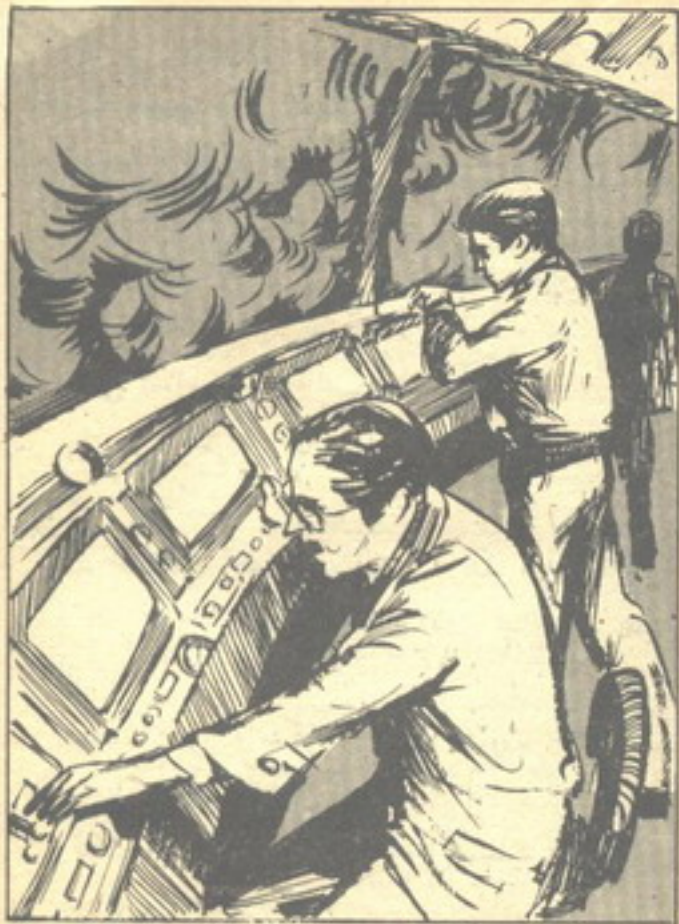
أسرع ( نور ) بالنظر إلى ساعة يده الذرية ، ولاحظ أنها بيضاء .. إذن فهناك شيء ما .. قوة ما تصيب الآلات ..

الآلات كلها تصرخ والشاشات كلها بيضاء ، وكأن مساً من الجنون أصابها ..